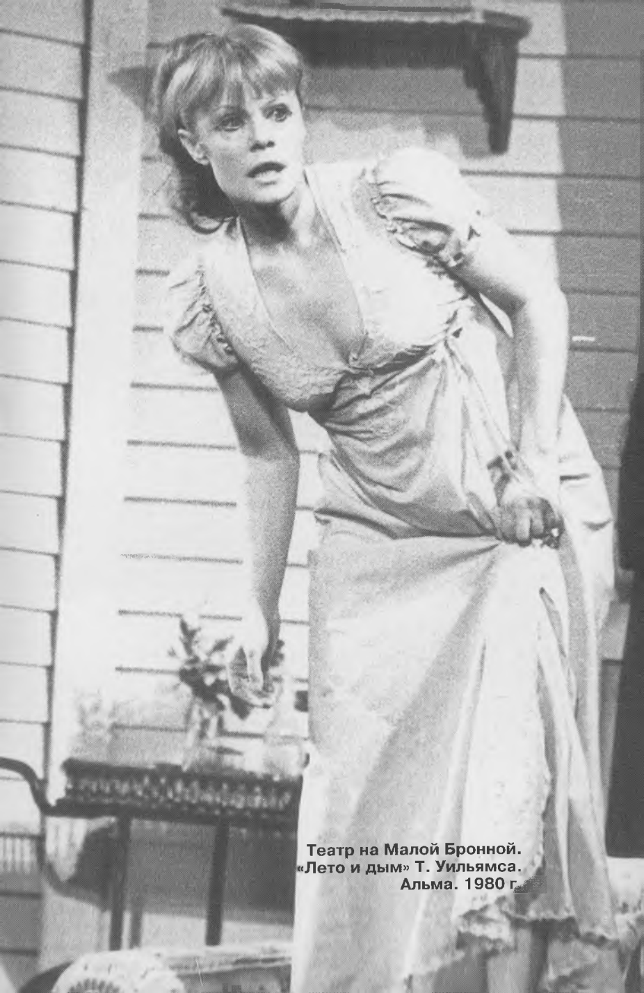
Театр на Малой Бронной. «Лето и дым» Т. Уильямса. Альма. 1980 г.