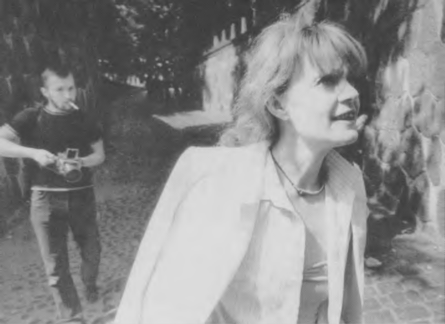
На гастролях в Литве. 80-е годы