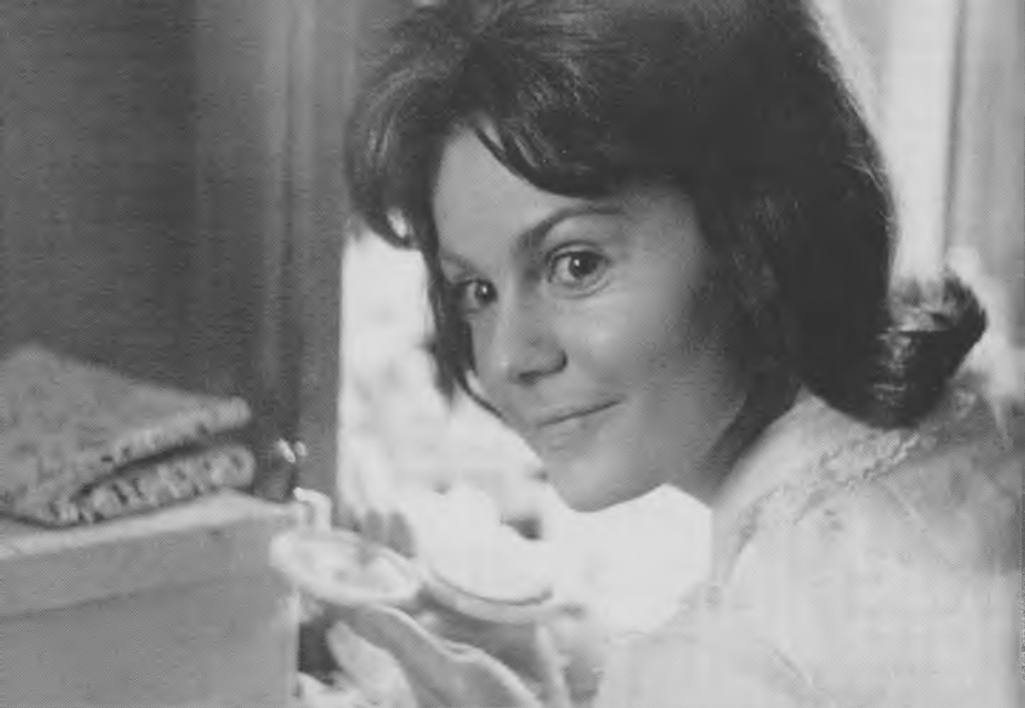
Гастроли. Пермь. Перед премьерой «104 страницы про любовь» Э. Радзинского. Наташа. 1964 г.