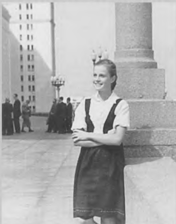
Абитуриентка у МГУ. 1958 г.