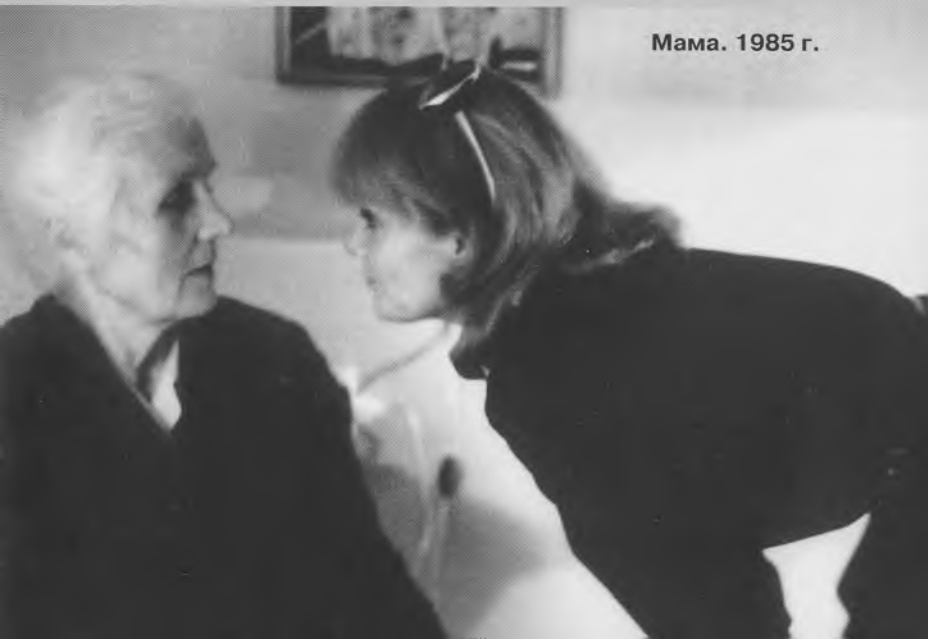
Мама. 1985 г.