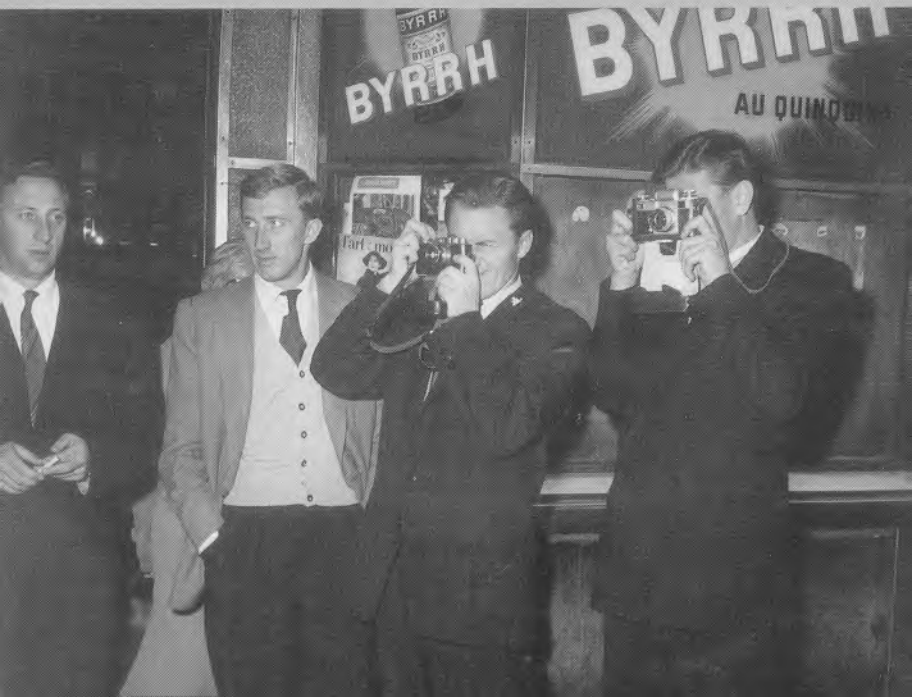
Прогулка по Парижу. 50-е годы