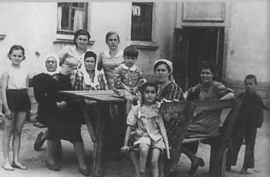
Мое босоное детство. Наш двор. Я слева