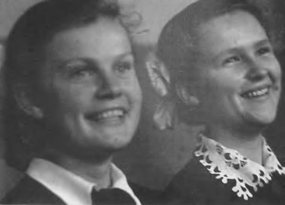
Студийцы ТЮЗа. Алма-Ата. 1957 г.