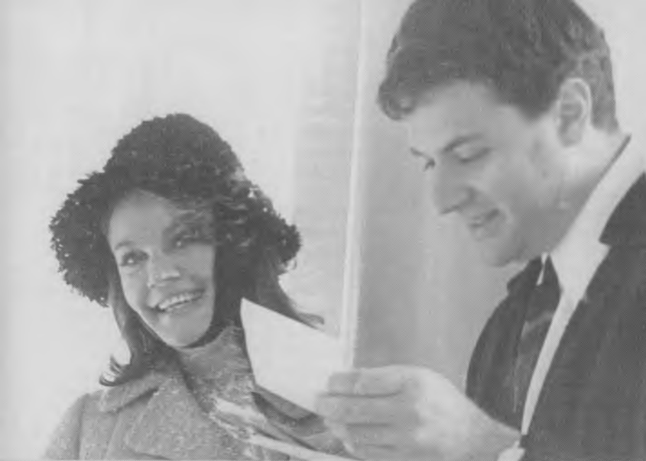
С А. Ширвиндтом. Читаем письма от поклонников. 60-е годы