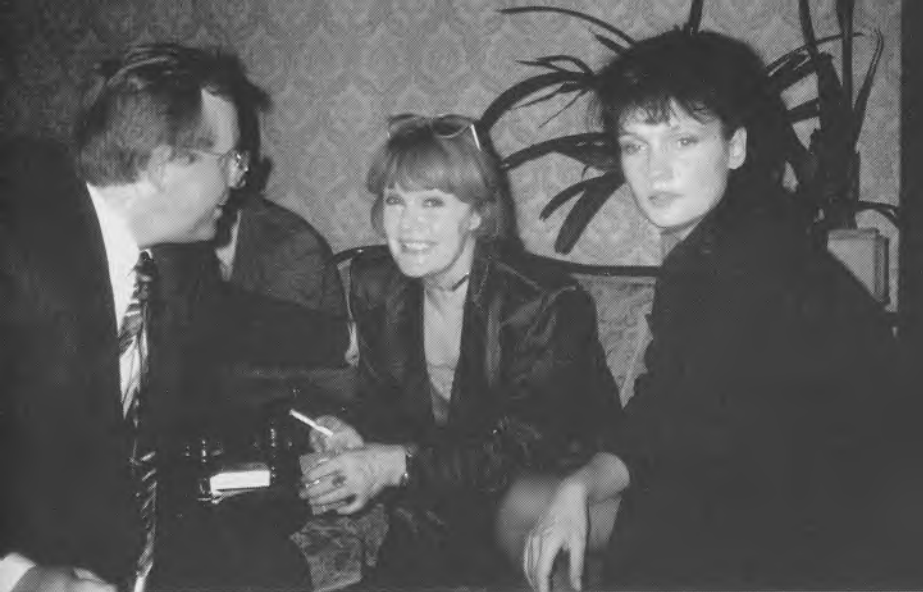
Гастроли Театра им. Вл. Маяковского в Варшаве. Прием в посольстве. 90-е годы