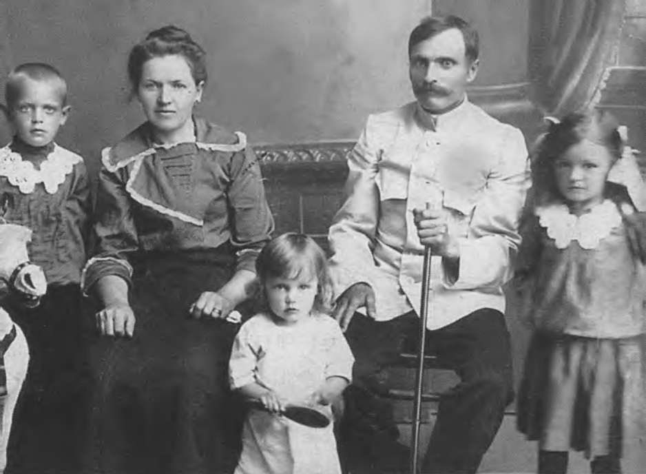
Мамина семья. 20-е годы. Со щеткой — моя мама