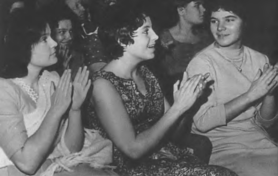
С однокурсницами на очередном чествовании «Спартака»