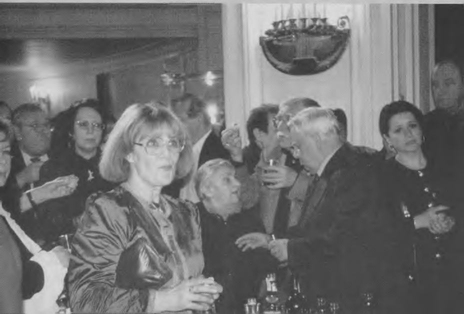
После юбилея в Театре им. Вл. Маяковского. 2001 г.