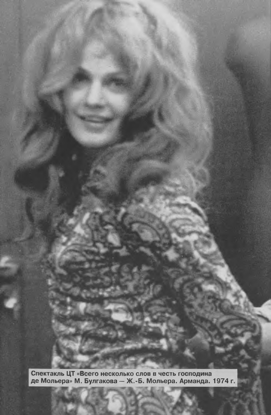
Спектакль ЦТ «Всего несколько слов в честь господина де Мольера» М. Булгакова — Ж.-Б. Мольера. Арманда. 1974 г.