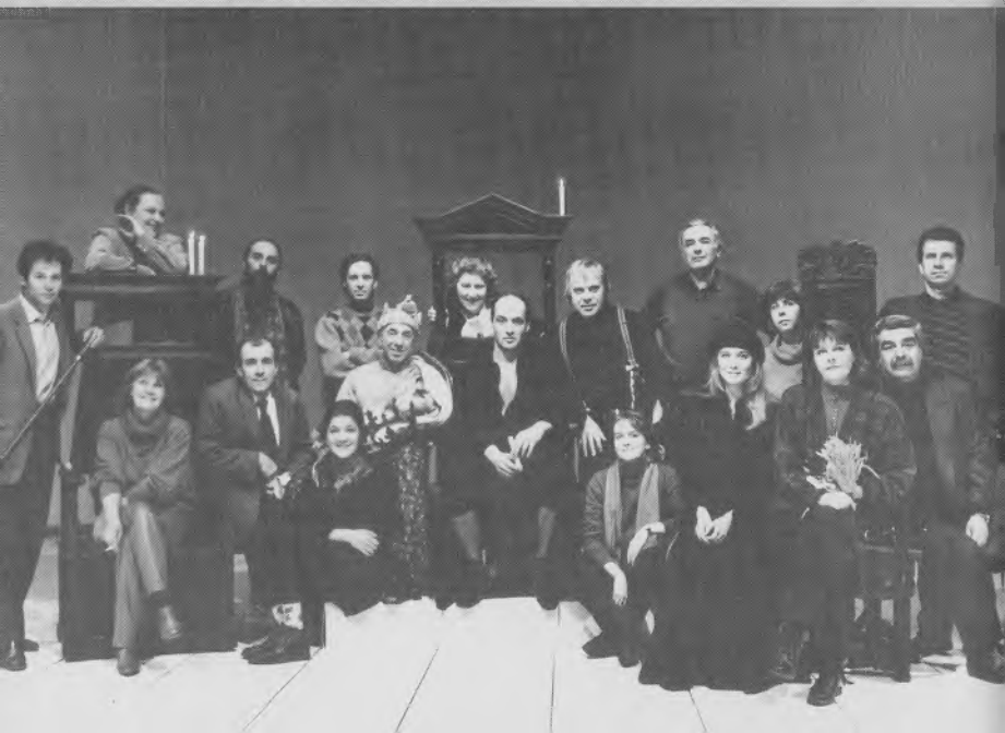
Французский культурный центр. «Король умирает» И. Ионеско