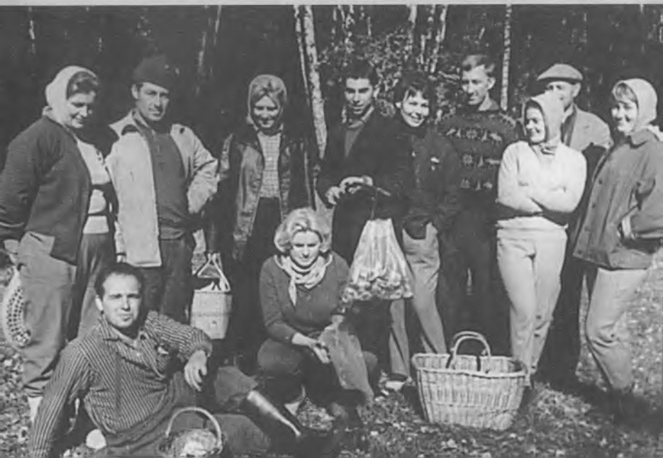
Театрально-футбольная вылазка по грибы