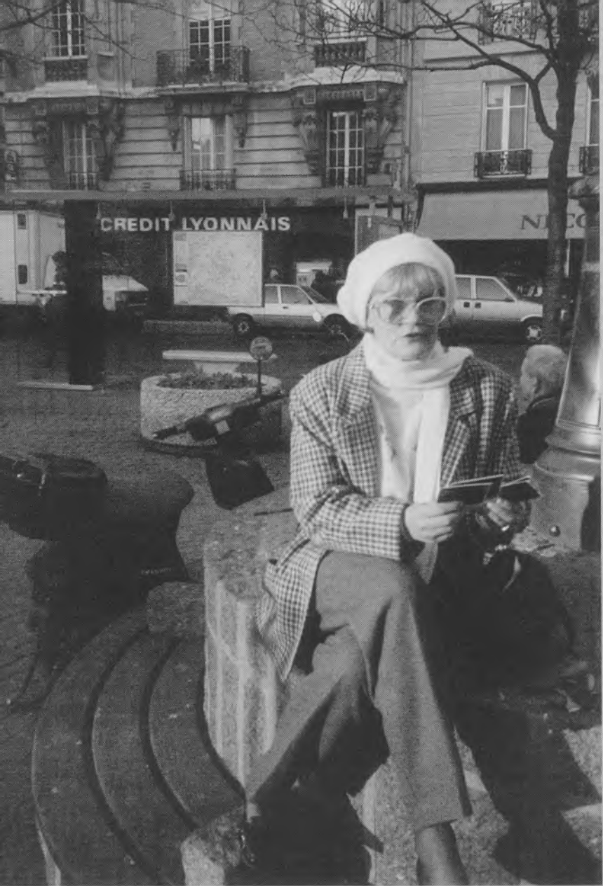
Париж. 90-е годы