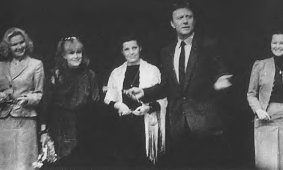
Однокурсники. Двадцатилетие со дня окончания училища им. Б.В. Щукина. 1984 г.