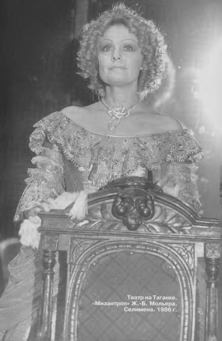
Театр на Таганке. «Мизантроп» Ж.-Б. Мольера. Селимена. 1986 г.