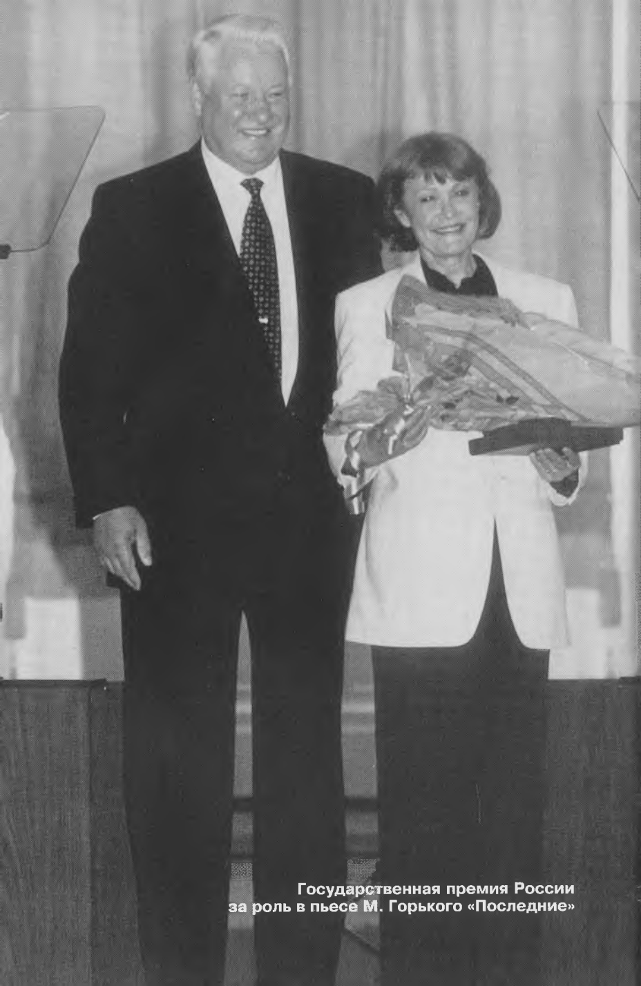
Государственная премия России за роль в пьесе М. Горького «Последние»