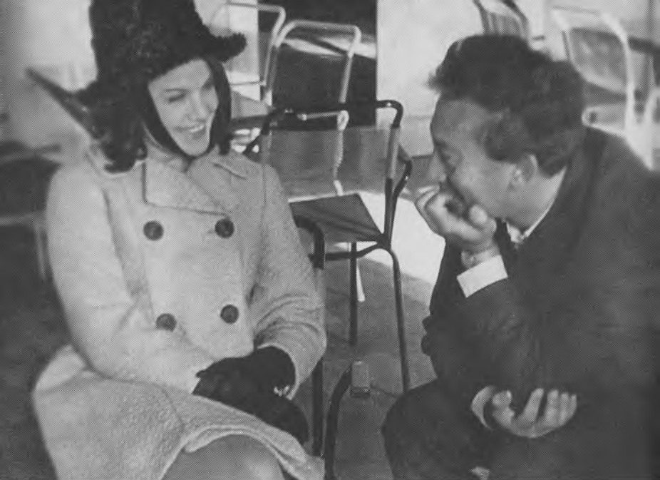
Малая Бронная. Конец 70-х годов