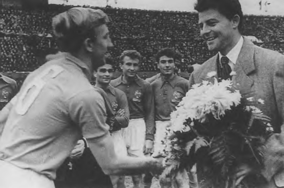
Известная фотография Игоря с Жераром Филипом. 1966 г.