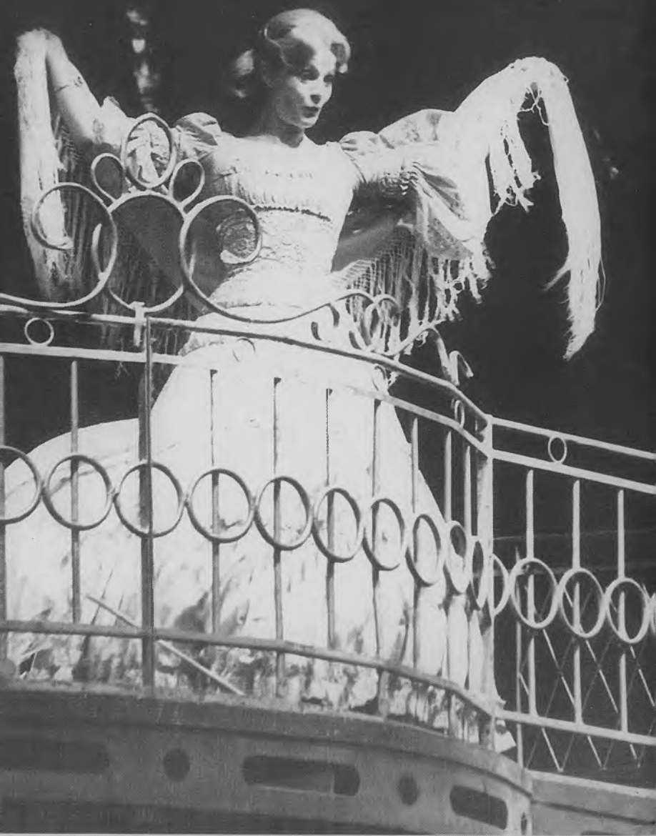
«Месяц в деревне» И. Тургенева. Наталья Петровна