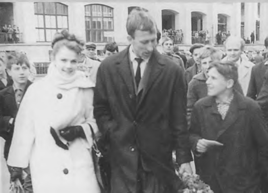
Матч был удачным. Лужники. 60-е годы