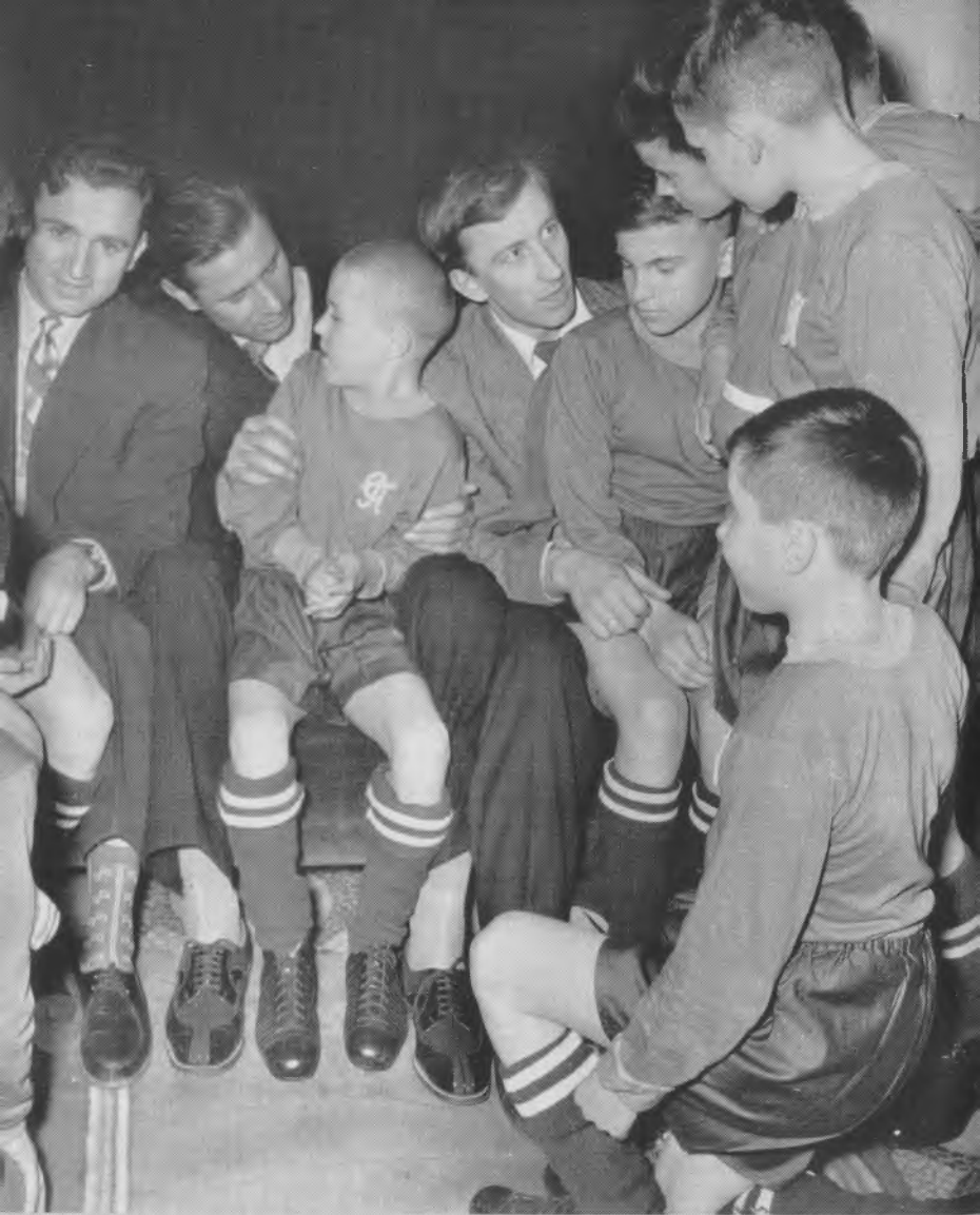
И. Нетто, Н. Симонян, Л. Яшин с будущими чемпионами