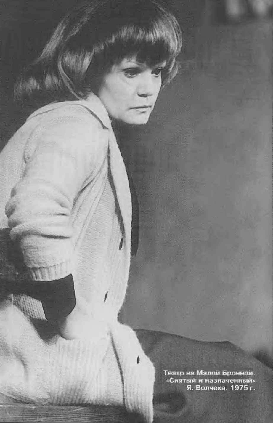
Театр на Малой Бронной. «Снятый и назначенный» Я. Волчека. 1975 г.