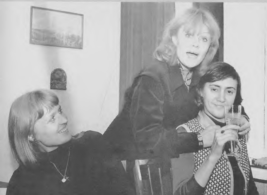
После спектакля. 80-е годы