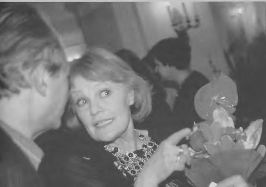
С А. Шапиро после вручения премии «Золотая маска». 1995 г.