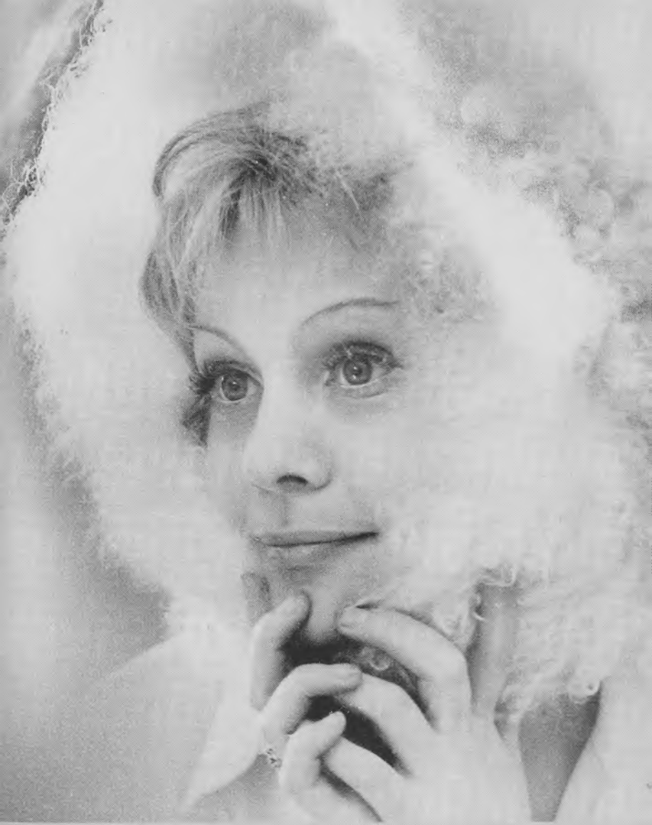
Телефильм «Таня» А. Арбузова. 1974 г.