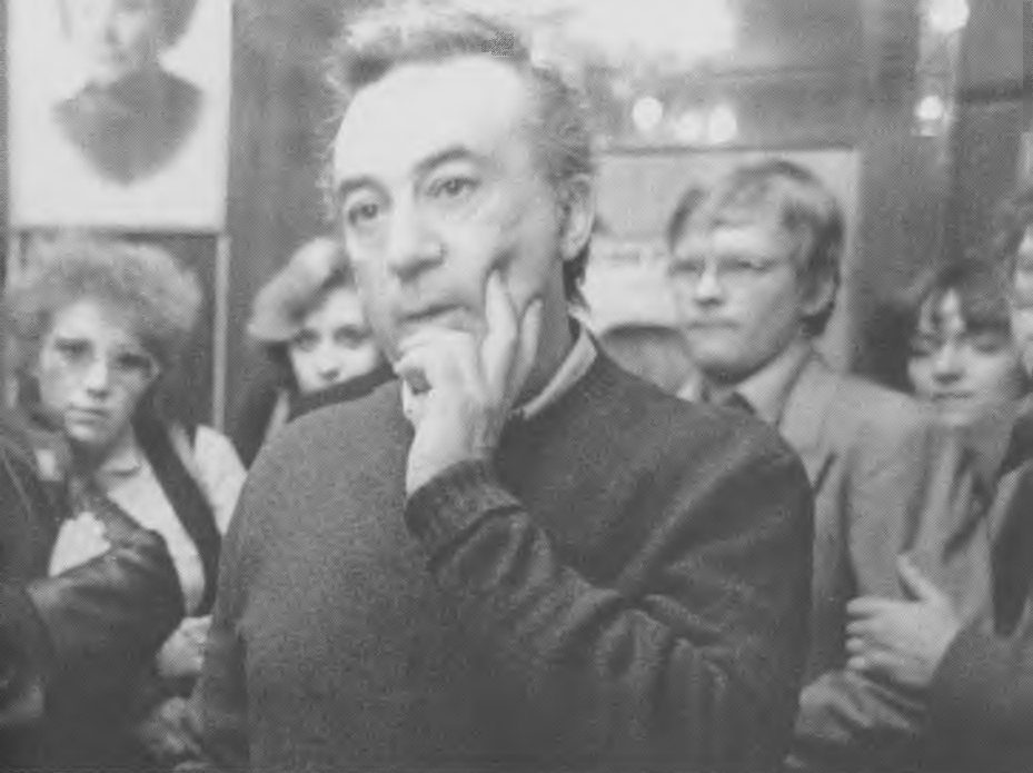
Творческий семинар А.В. Эфроса

Прием в Дюссельдорфе по поводу фестиваля в Дуйсбурге. 70-е годы