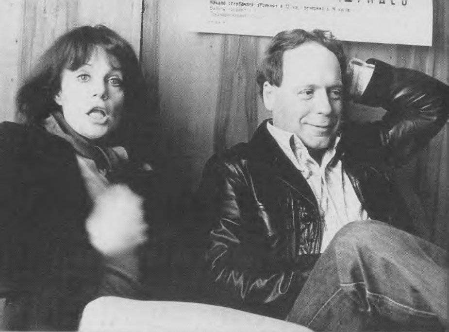
После репетиции спектакля «Продолжение Дон Жуана», «Разбор полетов» с автором Э. Радзинским. 1979 г.