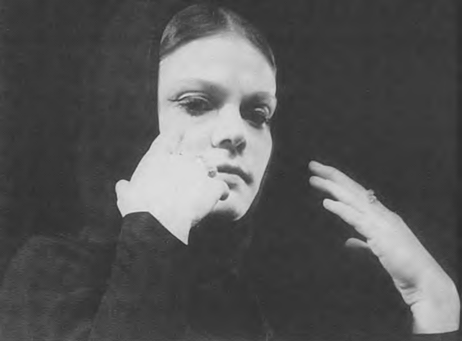
Ленком. «Чайка» А. Чехова. Нина Заречная. 1966 г.