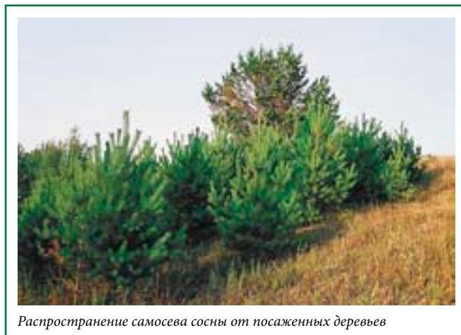
Распространение самосева сосны от посаженных деревьев

Полезно (а если вы хотите создать подобие естественной лесной экосистемы, то просто необходимо) подсаживать в ваш лес различные виды кустарников. Так же как при выращивании деревьев, старайтесь использовать только те кустарники, которые естественным образом произрастают в вашей местности. Как правило, лесные кустарники имеют значительно меньшую продолжительность жизни, чем деревья, и быстрее развиваются и размножаются естественным образом (если для этого есть необходимые условия — в первую очередь защитный полог древостоя). Поэтому чаще всего достаточно принести