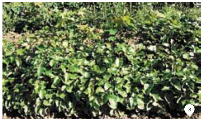
Выращивание березы бородавчатой и серой ольхи: а — смесь семян березы с семенными чешуями (стрелочкой обозначена одна из чешуй); б — всходы березы недельного возраста; в — всходы серой ольхи недельного возраста; г — всходы-дички березы на обочине шоссе; д — всходы березы через месяц после посева семян; е — всходы ольхи через месяц после посева семян; ж — сеянцы березы первого года жизни в середине лета; з — сеянцы березы первого года жизни в начале осени (на среднем плане видны сеянцы ольхи)