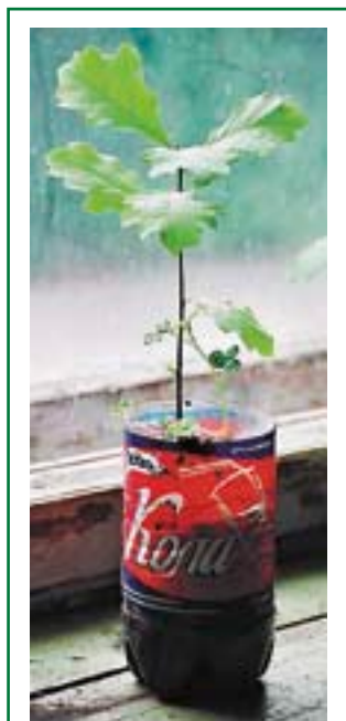
Сеянец дуба, выращенный за лето в домашних условиях

Зимовка «домашних» саженцев должна происходить под снегом: там теплее и корневые системы саженцев не пострадают. Всходы лишь немногих деревьев (например, лиственницы или кедра) способны перенести суровую зимовку без укрытия снегом, и то лишь в относительно мягкие зимы. Подготовка «домашних» саженцев к зимовке — дело не простое: если сеянец выставить сразу из тепла на мороз, он тоже погибнет. Нужна закалка саженцев, т.е. надо выставить их на улицу еще в сентябре, пока не очень холодно. Все это довольно сложно, поэтому лучше всего выращенные в комнате саженцы уже осенью высаживать на постоянное место.