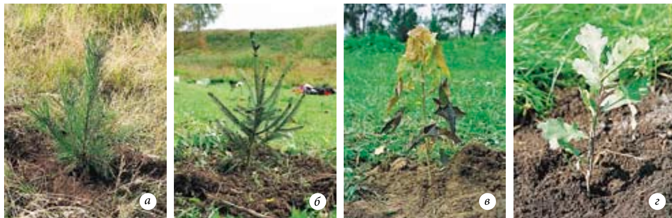
Высаженные на постоянное место саженцы различных древесных пород: а — сосна обыкновенная (возраст саженца — три года); б — ель обыкновенная (четыре года); в — клен остролистный (один год); г — дуб черешчатый (два года)

удобно им будет расти в первые несколько недель, во многом зависит их дальнейшая судьба. Одновременно с прополкой поправьте покосившиеся саженцы, подсыпая или прижимая землю с нужной стороны стволика. Если у вас есть такая возможность, повторите прополку еще через 2-4 недели.