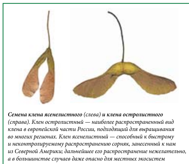
Семена клена ясенелистного (слева) и клена остролистного (справа). Клен остролистный — наиболее распространенный вид клена в европейской части России, подходящий для выращивания во многих регионах. Клен ясенелистный — способный к быстрому и неконтролируемому распространению сорняк, занесенный к нам из Северной Америки; дальнейшее его распространение нежелательно, а в большинстве случаев даже опасно для местных экосистем

Семена большинства ив и тополей созревают также в конце мая или июне, в зависимости от погодных условий и региона. Вы можете собрать их — так называемый тополиный пух (ивовые семена выглядят так же) — прямо с дерева или с поверхности земли. Собранные семена надо посеять сразу же — они хранятся даже меньше время, чем семена вязов.