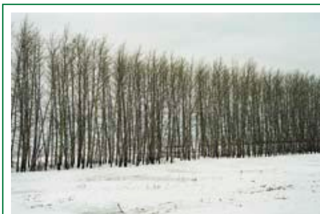
Одной из разновидностей лесоразведения является создание защитных полос, сберегающих поля от засух и ветров. Такие полосы очень важны и нужны, но они еще не являются полноценным лесом — поскольку не способны образовать по-настоящему лесную среду

Создание защитных лесонасаждений — не единственная цель разведения новых лесов на ранее безлесных участках. Подобные леса могут создаваться и с хозяйственными целями — для обеспечения деревень и поселков местными источниками топлива (дровами или хворостом) и некоторыми строительными материалами. Специально выращиваемая топливная древесина (которая может также получаться как побочный продукт ухода за молодым лесом — его прореживания) позволяет отказаться от использования невозобновляемых природных ресурсов, таких как нефть, газ или уголь. Кроме того, выращивание топливной древесины на окраинах населенных пунктов или на заброшенных полях и различных бросовых землях создает дополнительные рабочие места, столь необходимые для большинства сельских населенных пунктов. Благодаря тому, что использование местных искусственно выращиваемых древесных ресурсов дает сельским населенным пунктам новые рабочие места и позволяет отказаться от привозных невозобновляемых видов