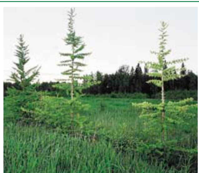
Посадки лиственницы Сукачева на заброшенных сельскохозяйственных землях через четыре года после высадки (Архангельская область)

2. Восстановление пород деревьев, исчезающих или практически исчезнувших в лесах вашего региона или района вследствие хозяйственной деятельности человека. Таких немало, особенно в регионах с длительной историей хозяйственного освоения природных лесов. Например, в большинстве регионов Севера Европейской России за последние несколько столетий сильно сократилось количество лиственницы Сукачева — в первую очередь из-за того, что эта древесная порода специально выборочно заготавливалась для строительства различных специальных объектов (древесина лиственницы медленнее всего гниет в воде, и поэтому она издревле пользовалась особым спросом во многих европейских странах). Во многих регионах того же Европейского Севера сильно сократилось количество пихты и сибирского кедра — эти два дерева находятся здесь на самой западной границе своего распространения и потому наиболее чувствительны