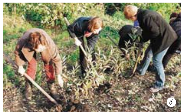
Выращивание ивы из черенков: а — черенки ивы через месяц после посадки; б — выкапывание однолетних саженцев ивы осенью для пересадки на постоянное место