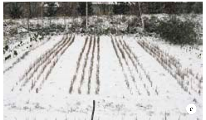
Выращивание лиственницы: а — всходы лиственницы через месяц после посева; б — густой посев (12-15 граммов семян на метр) позволяет получить больше сеянцев меньшего размера; в — редкий посев (5-10 граммов семян на метр) позволяет получить меньше сеянцев большего размера; г — общий вид питомника лиственницы через месяц после посева; д — питомник осенью; е — питомник в начале зимы

Пересадку производите в течение одного дня, стараясь, чтобы каждый сеянец как можно меньше находился на воздухе — это позволит в максимальной степени сохранить его корни от высыхания. В теплую погоду корни сеянца, не защищенные от солнца и ветра, могут засохнуть и погибнуть в течение нескольких минут. Старайтесь как можно меньше повреждать корневые системы сеянцев: чем большая их часть сохранится при пересадке, тем лучше будут развиваться сеянцы в последующие годы.