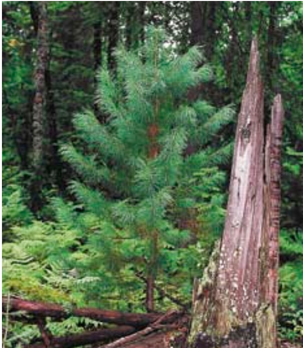
Сибирский кедр почти исчез во многих районах севера Европейской России в результате хозяйственной деятельности человека. Посадка этой породы необходима для восстановления видового разнообразия таежных лесов

В общем, восстановление лесов на вырубках или создание новых лесов в таежной зоне России чаще всего не имеет того большого природоохранного смысла, как в «малолесных» регионах, где и природа, и человек серьезно страдают от недостатка леса. Восстановление хозяйственно-ценных лесов на вырубках имеет, прежде всего, хозяйственный, а не природоохранный смысл, и связано с современной коммерческой деятельностью (заготовкой древесины). В этом случае надо стремиться к тому, чтобы предприятия, ведущие коммерческую заготовку древесины, были обязаны сами восстанавливать хозяйственно ценный лес после своих рубок, тем более что на таких гигантских площадях, которые ежегодно вырубаются сплошь в таежных лесах России (а это примерно 10.000 кв. км), силами общественности вряд ли можно добиться хозяйственно значимого результата.