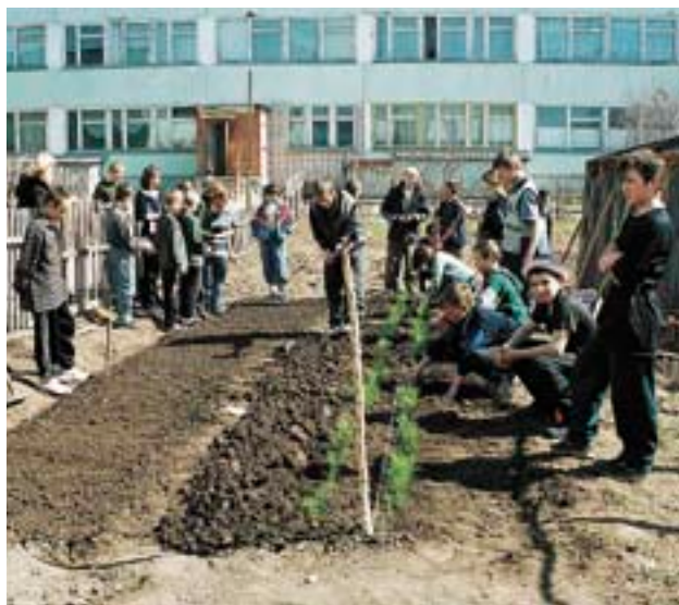
Закладка небольшого лесного питомника в школе: слева — посевное отделение, справа — «школка»

повреждения посадок скотом (вытаптывание, обкусывание): они быстрее достигнут той высоты, при которой скот им уже не страшен. При озеленении городов и поселков также чаще всего используются саженцы — в основном для того, чтобы как можно быстрее получить результат.