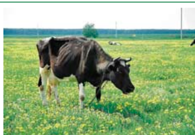
Не следует высаживать деревья на используемых пастбищах и скотопрогонах

Следует также помнить, что некоторые нелесные участки могут иметь большое значение для сохранения редких и подлежащих специальной охране видов растений и животных или быть последними остатками природных степей. Высадка леса на таких участках может привести к неблагоприятным экологическим последствиям — исчезновению угрожаемых видов или экосистем. Для того чтобы этого избежать, старайтесь не засаживать лесом те участки, которые характеризуются редкими для вашей местности условиями (например, выходы известковых скал или особенно сухие и прогреваемые склоны). Используйте для посадки леса те участки, которые явно были нарушены в результате хозяйственной деятельности человека — заброшенные сельскохозяйственные угодья, растущие овраги, карьеры и т.д. Кроме того, относительно выбранного участка можно проконсультироваться у местных специалистов в области охраны природы (чаще всего таких специалистов можно найти в университете, ближайшем заповеднике или в региональном управлении Федеральной службы по надзору в сфере природопользования — Росприроднадзора).