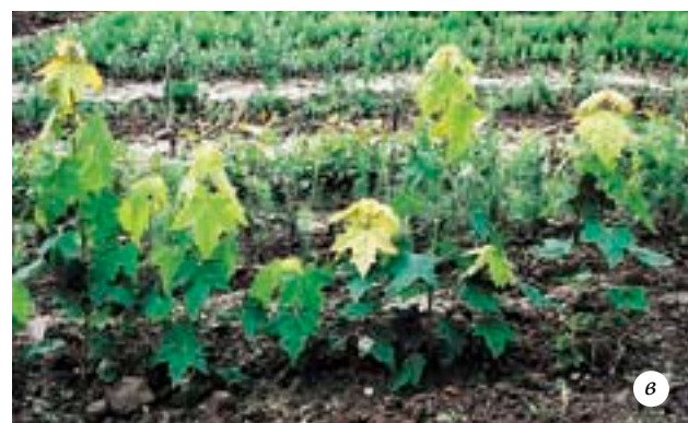
Выращивание клена: а — «дикие» всходы клена под взрослым деревом; б — «дикие» всходы, пересаженные в питомник, через месяц после пересадки; в — крупные однолетние сеянцы клена, выращенные из «диких» всходов