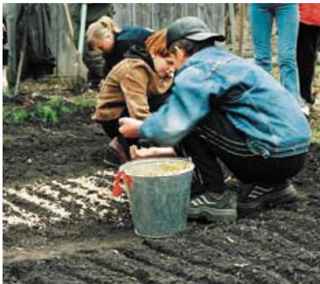
Посев семян в лесном питомнике. Между рядами мульчируются (укрываются) древесными опилками, чтобы уменьшить высыхание почвы и ослабить рост сорняков

При смешанных посадках (посадка в пределах одного участка двух или более разных древесных пород) могут использоваться одновременно саженцы одной древесной породы, и сеянцы или даже семена другой. Например, при смешанной посадке сосны и дуба можно использовать трехлетние или четырехлетние саженцы сосны и однолетние или двухлетние сеянцы или желуди дуба.