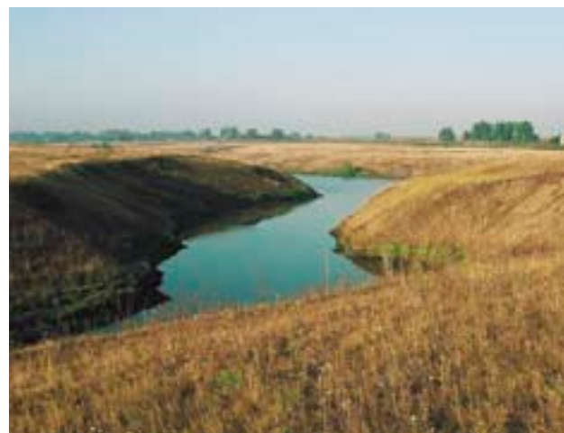
Склоны оврагов и берега рек и прудов — подходящие участки для посадки новых лесов в «малолесных» районах