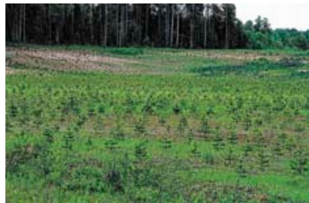
Отработанные карьеры, заброшенные сельхозугодья — наилучшие места для разведения новых лесов в «многолесных» районах. Зброшенний песчаный карьер, засаженный сосной (Вологодская область)