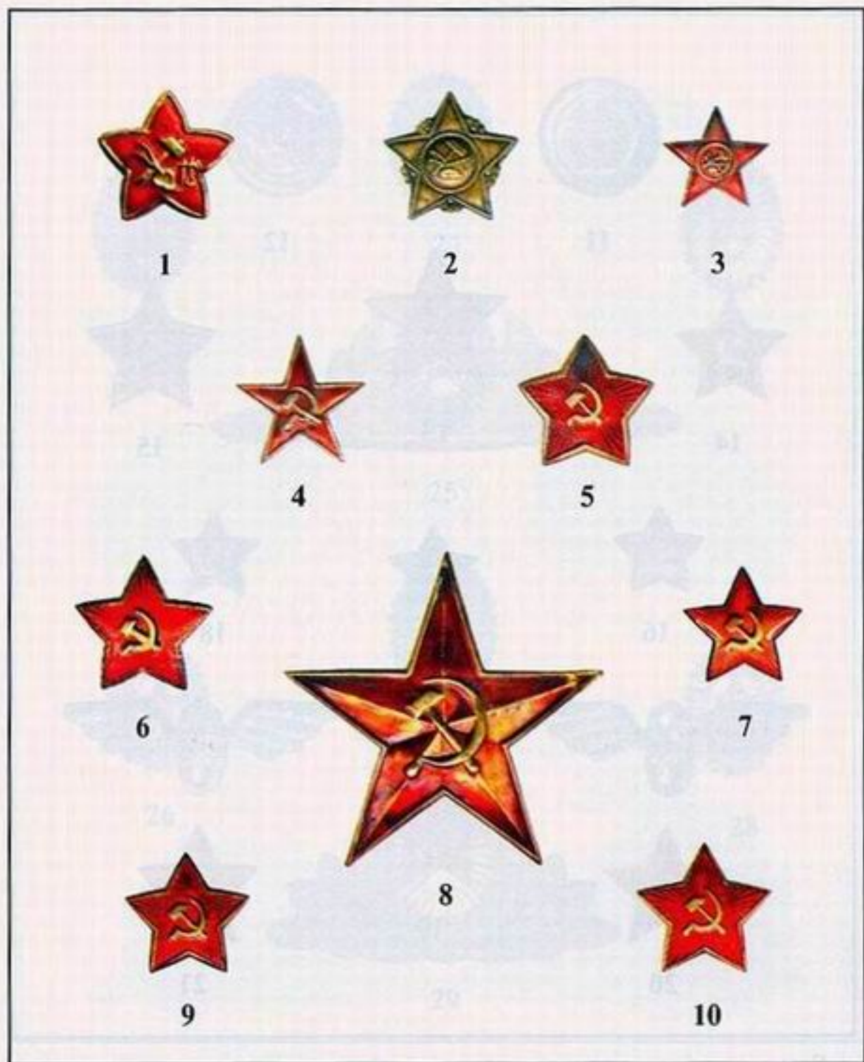
1. Лица, состоящие на службе в РККА, 1918. 2. Сотрудники Военных комиссариатов, 1919. 3. Начальствующий состав, 1920. 4-5. Красноармейцы, комиссары и командиры, 1922. 6-7. Высший, старший и средний командный состав, 1934. 8. Рядовой, младший и старший начальствующий состав (на касках), 1927. 9-10. Все категории военнослужащих (кроме генералов и маршалов), 1940.