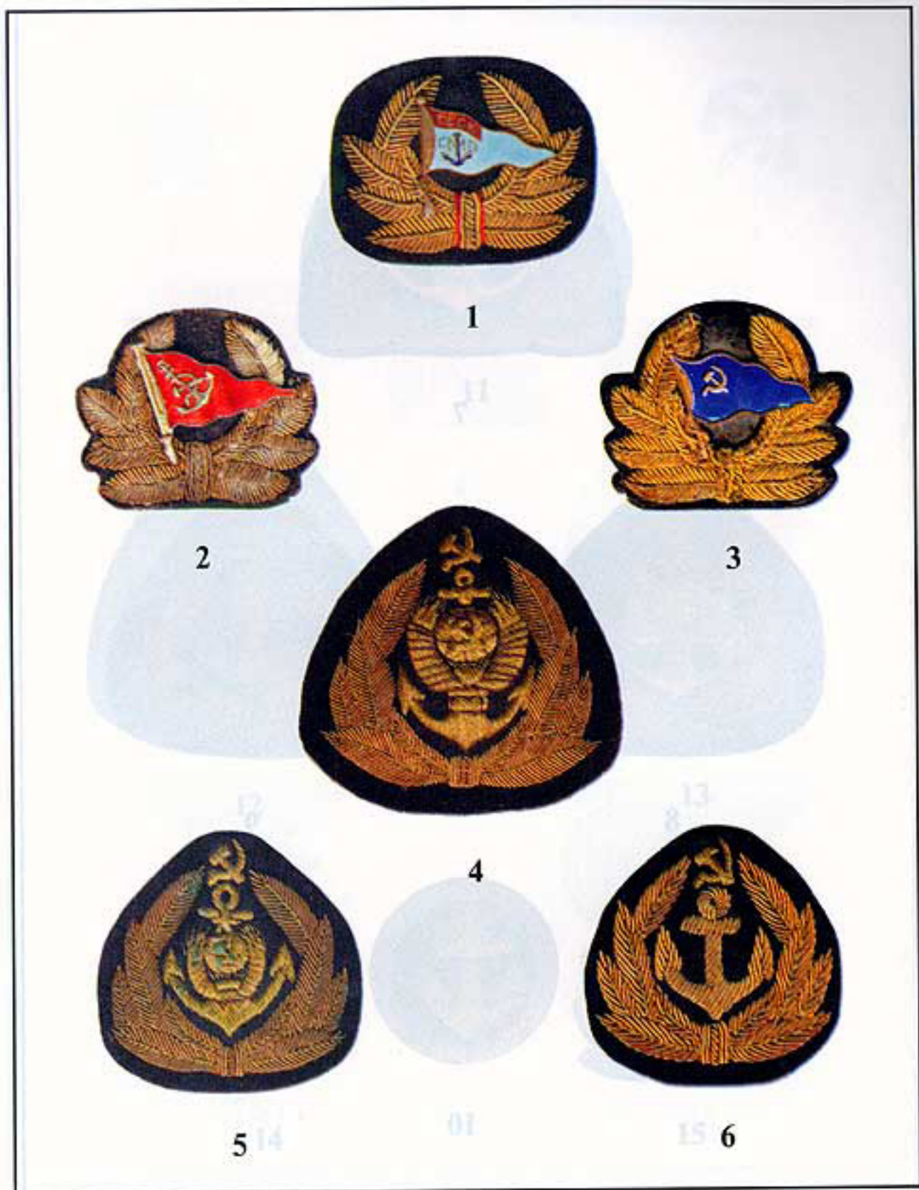
1. Начальствующий состав Главного управления Северного морского пути, 1932. 2. Работники Каспийского пароходства, 1934. 3. Работники Балтийского пароходства, 1934. 4-5. Высший и старший начальствующий состав флота рыбной промышленности, 1964. 6. Средний начсостав ФРП, 1964.