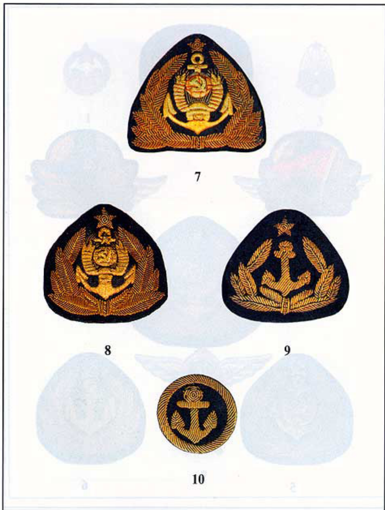
7. Высший начальствующий состав эксплуатационно-судовой службы, 1949. 8. Старший начсостав эксплуатационно-судовой и технической службы, 1949. 9. Средний начсостав эксплуатационно-судовой и технической службы, 1949. 10. Младший начсостав и студенты института инженеров Морфлота, 1949.