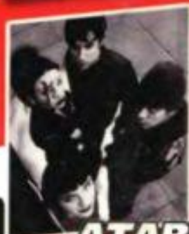
ATARI TEENAGE RIOT