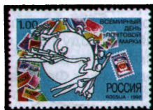
Рисунок Г. Ракова. Офсет на мелованной бумаге. Зубцовка гребенчатая 12 :12 1/2.

1998. Октябрь, 10. Всемирный день почтовой марки. 27