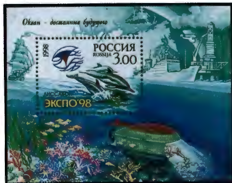
Рисунок Л. Зайцева. Офсет на мелованной бумаге. Зубцовка рамочная 12 1/2 : 12. Размер блока 9 x 7 см.

1998. Апрель, 15. Всемирная выставка "ЭКСПО-98" в Лиссабоне (Португалия, 22.05-30.09). 13 Почтовый блок.