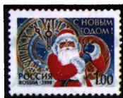
Рисунок М. Ларюшиной. Офсет на мелованной бумаге. Зубцовка гребенчатая 11 1/2.