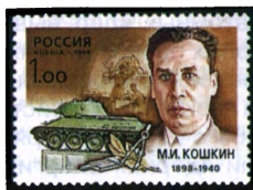
Рисунок Л. Зайцева. Офсет на мелованной бумаге. Зубцовка гребенчатая 12 1/2 : 12.

1998. Ноябрь, 20. 100 лет со дня рождения М. И. Кошкина, конструктора танков.