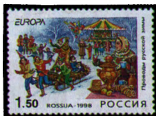
Рисунок Г. Линде. Офсет на мелованной бумаге. Зубцовка гребенчатая 12 1/2 : 12.

1998. Май, 5. Народные фестивали (праздники). Проводы русской зимы. Выпуск по программе "Европа".