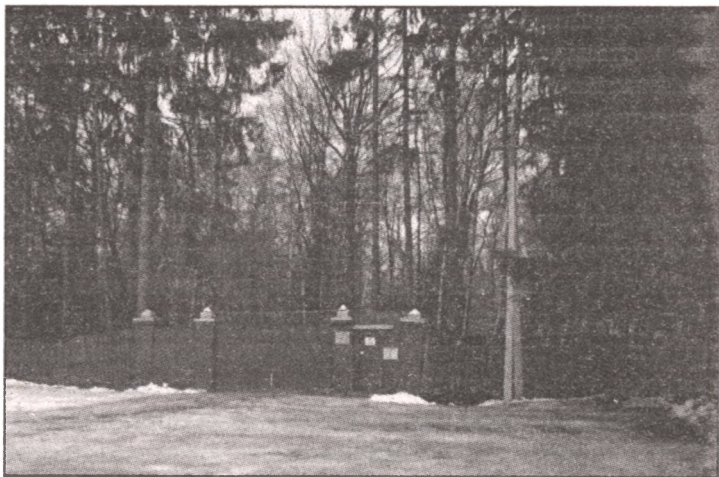
Мартовские сумерки перед воротами бывшей дачи Ягоды «Лоза». Такими они были и семьдесят лет назад

нуты свои слова в одном из писем Максиму Горькому: «Как мы быстро-быстро живем, и как ярко-ярко горим» 452 .