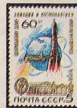
Рисунок И. Мартынова. Гравюра на металле О. Клочковой. П. глуб. в сочетании с металлогравией на мелованной бумаге. Рам. 11 1 / 2 .

1984. Ноябрь, 6. 60-летие Центрального дома авиации и космонавтики имени М. В. Фрунзе*.