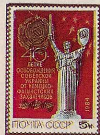
Рисунок И. Козлова. П. глуб. на мелованной бумаге. Рам. 12:11 1 / 2 .

1984. Октябрь, 8. 40-летие освобождения Украинской ССР от немецко-фашистских захватчиков.