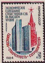
Рисунок Ю. Бронфенбрера. П. глуб. на мелованной бумаге. Рам. 11 1 / 2 .

5516. 5 к.— Спасская башня (см. 5510) Московского Кремля и здание СЭВ (1969, архитекторы М. Посохин, А. Мндоянц; В. Свирский, инженеры Ю. Рацкевич, С. Школьников и др.) в Москве. Надпись: «Единство, Сплоченность, Сотрудничество». Памятный текст — красная и синяя . . . . . —05 —02