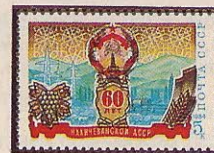
Рисунок Ю. Косорукова. Офсет на мелованной бумаге. Греб. 12:12 1 / 2 .

1984. Сентябрь, 20. 60-летие Нахичеванской АССР.