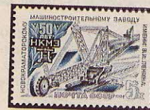
Рисунок Ю. Арцименева. Гравюра на металле А. Ткаченко. П. глуб. в сочетании с металлографией на мелованной бумаге. Рам. 11 1 / 2 .

1984. Сентябрь, 20. 50-летие Новокраматорского машиностроительного завода имени В. И. Ленина.