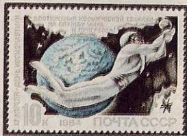
Рисунок Ю. Арцименева. П. глуб. на мелованной бумаге. Рам. 11 1 / 2 :12.

5495. 10 к.—Символический образ человека, устремленного в космос, с первым советским искусственным спутником Земли (запущен 4.10.1957) в руках. Фоновое изображение — Земля и сопредельное космическое пространство. Текст: «Достижения космической техники — на службу мира и прогресса!» — многоцветная . . . . . —10 —03