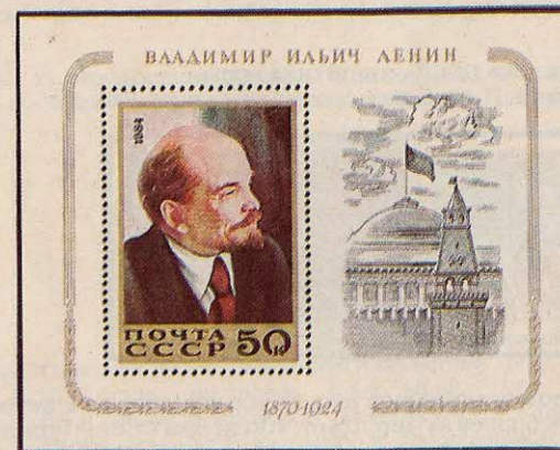
Рисунок И. Мартынова. Офсет на мелованной бумаге с лаковым покрытием. Рам. 11 1 / 2 :12 1 / 2 .

5500. 50 к.—На марке — портрет В. И. Ленина по картине Е. Широкова «Встреча В. И. Ленина с членами Исполкома IV конгресса Коминтерна» (фрагмент, подлинник в ЦМЛ).