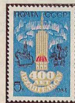
Рисунок И. Козлова. Гравюра на металле В. Стариковского. П. глуб. в сочетании с металлографией на мелованной бумаге. Рам. 11 1 / 2 .

5515. 5 к.—Эмблема в честь юбилея на фоне полярного сияния, морского судна и памятника покорителям Севера (скульптор И. Алтухов). Памятный текст — многоцветная . . . . . —05 —02