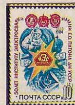
Рисунок Ю. Бронфенбренера. П. глуб. на мелованной бумаге. Рам. 11 \frac{1}{2} .

1984. Май, 15. 50-летие Института электросварки имени Е. О. Патона Академии наук УССР.