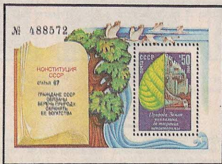
Рисунок Ю. Левиновского. Офсет на мелованной бумаге. Рам. 12 1 / 2 :12. Размер 9x6,5 см.

5581. 50 к.— На марке в блоке — лист липы, символизирующий окружающую нас природу. Левая часть его естественна, не занята человеческой деятельностью, правая представляет собой индустриальную панораму. Текст: «Природа Земли уникальна, ее творения неповторимы».