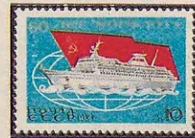
Рисунок Т. Панченко. Гравюра на металле М. Сильяновой. П. глуб. в сочетании с металлографией на мелованной бумаге. Рам. 11 1 / 2 .

5524. 10 к.— Пассажирское судно на фоне Государственного флага СССР, условного изображения земного шара и стилизованных морских волн — многоцветная . . . . . —10 —03