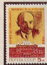
Рисунок А. Шмидштейна. П. глуб. на мелованной бумаге. Рам. 11 1 / 2 .

5514. 5 к.—Портрет организатора КПСС и основателя Советского государства В. И. Ленина (с офорта М. Рундальцова по фотографии М. Напельбаума 1918 г.), хранящийся в музее, на фоне фасада его здания (бывшая Московская городская дума; 1890—1892; архитектор Д. Чичагов) — многоцветная . . . . . —05 —02