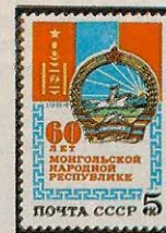
Рисунок Ю. Косорукова. П. глуб. на мелованной бумаге. Рам. 11 1 / 2 .

1984. Ноябрь, 26. 60-летие Монгольской Народной Республики.