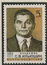
Рисунок П. Бенделя. П. глуб. на мелованной бумаге. Рам. 11 1 / 2 .

1984. Март, 23. 90-летие со дня рождения С. В. Ильюшина (1894—1977).