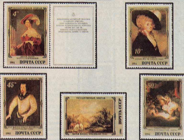
ПОЧТОВЫЙ БЛОК Размер 14,5x8 см.