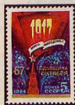
Рисунок С. Горлищева. Гравюра на металле В. Стариковского. П. глуб. в сочетании с металлогравией на мелованной бумаге. Рам. 11 1 / 2 .

1984. Октябрь, 23. 67-я годовщина Великой Октябрьской социалистической революции.