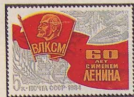
Рисунок Ю. Левиновского. П. глуб. на мелованной бумаге. Рам. 11 1 / 2 :12.

5523. 5 к.— Нагрудный комсомольский значок на развевающемся красном полотнище. На втором изобразительном плане — панорама тех отраслей народного хозяйства, науки и техники, исследования и освоения космического пространства, в которых Ленинский комсомол принимал и принимает сейчас активное участие — многоцветная . . . . . —10 —02