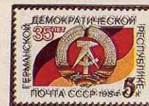
Рисунок Ю. Арцименова. П. глуб. на мелованной бумаге. Рам. 11 1 / 2 .

5563. 5 к.—Государственный герб и флаг ГДР. Памятный текст — многоцветная . . . . . —05 —02