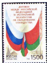
Рисунок Ю. Арцименева. Офсет на мелованной бумаге. Зубцовка гребенчатая 12 :12 1/2.

□□□ 313. 1 500 р. - Государственные флаги Российской Федерации и Республики Белоруссия. Слева на марке - изображения Спасской башни и купола правительственного здания Московского Кремля. Справа - Монумент Победы в Минске. Дополняет композицию памятный текст: "Договор между Российской Федерацией и Республикой Белоруссия об образовании Сообщества" - многоцветная 1 500-00 300-00