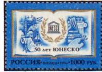
Рисунок М. Ларюшиной. Офсет на мелованной бумаге. Зубцовка гребенчатая 12 : 12 1/2.

□□□ 320. 1000 р. - Изображение раскрытой книги, на страницах которой помещены эмблема ЮНЕСКО в обрамлении лаврового венка и рисунки, символизирующие образование, науку и культуру. Дополняет композицию рисунка памятный текст: "50 лет ЮНЕСКО" - черная, голубая, бронзовая 1000-00 200-00