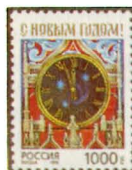
Рисунок Ю. Арцименева. Офсет на мелованной бумаге. Зубцовка гребенчатая 11 1/2.