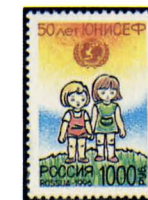
Рисунок М. Ларюшиной. Офсет на мелованной бумаге. Зубцовка гребенчатая 12 1/2 : 12.

1996. Июнь, 1. 50 лет Детскому фонду Организации Объединенных Наций (ЮНИСЕФ). 15