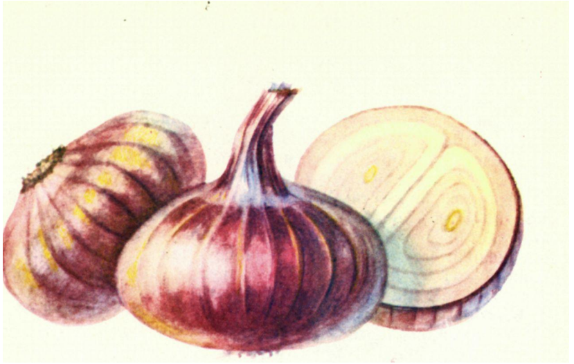
Рис.3. Даниловский 301;