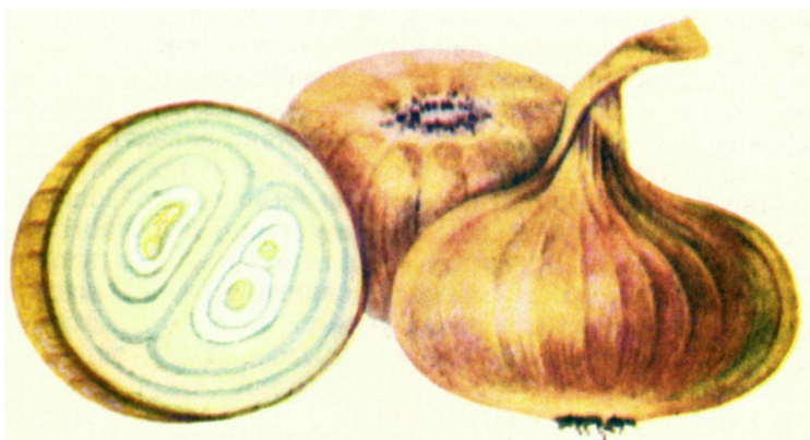
Спасский местный улучшенный