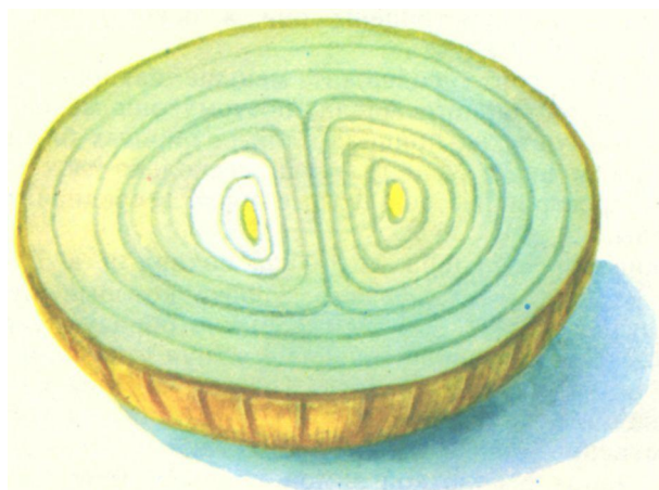
Рис. 2. Бессоновский местный