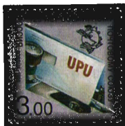
Рисунок Ю.Н. Арцименева. Офсет на мелованной бумаге. Зубцовка гребенчатая 12. Размер марки 32,5 x 32,5 мм.

1999. Август, 23. 125 лет Всемирному почтовому союзу. 22