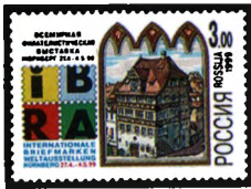
Рисунок А.В. Плетнева. Офсет на мелованной бумаге. Зубцовка гребенчатая 12 1/2 : 12. Размер марки 42 x 30 мм. ©

1999. Апрель, 27. Всемирная филателистическая выставка «ИБРА-99». (27.04-4.05. Нюрнберг, Германия).