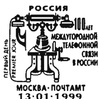
Рисунок А.Ю. Жарова. Офсет на мелованной бумаге. Зубцовка гребенчатая 12 : 11 1/2. Размер марки 49,4 x 31,3 мм.