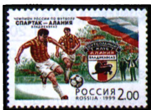
Рисунок Р.К. Стрельникова. Офсет на мелованной бумаге. Зубцовка гребенчатая 12 : 12 1/2. Размер марки 40 x 28 мм.