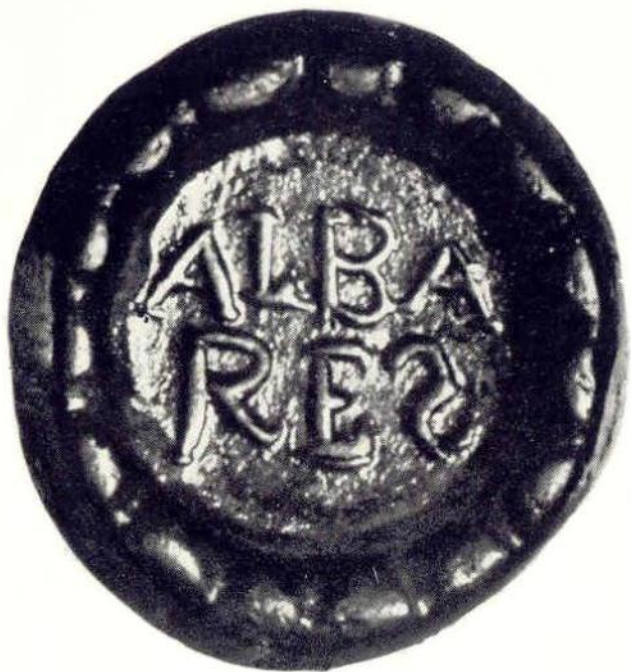
26. Именной односторонний глазо «Albares». Медь