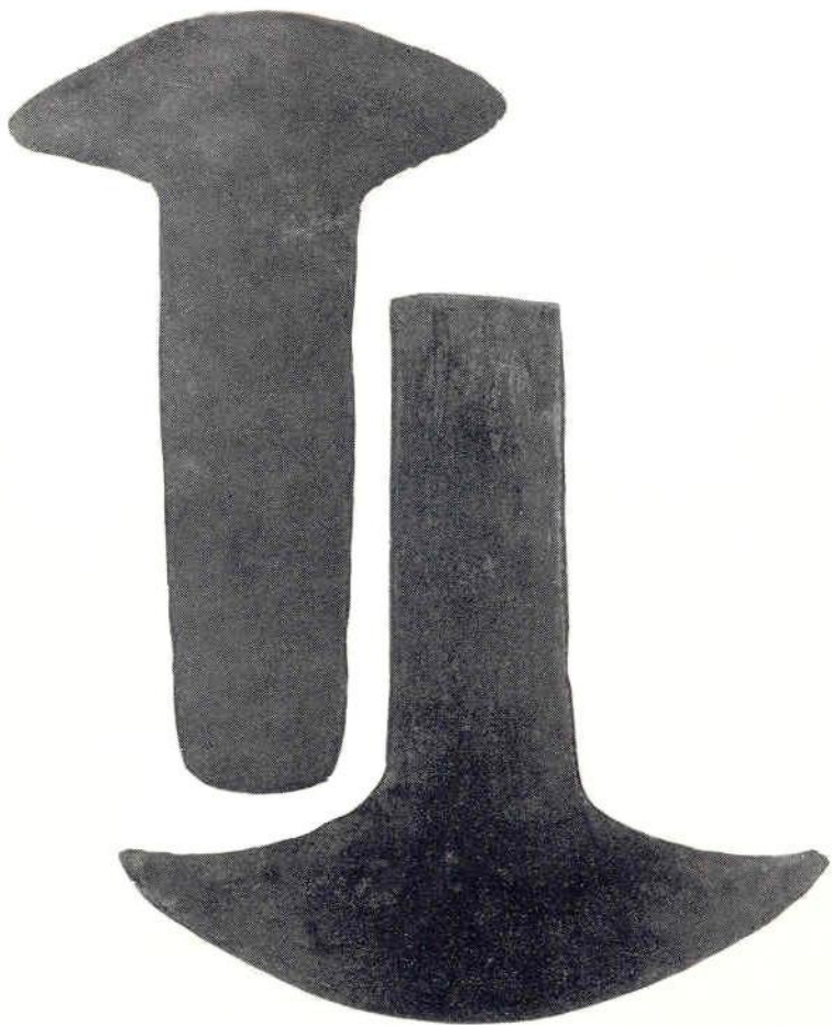
2. Медные топорики