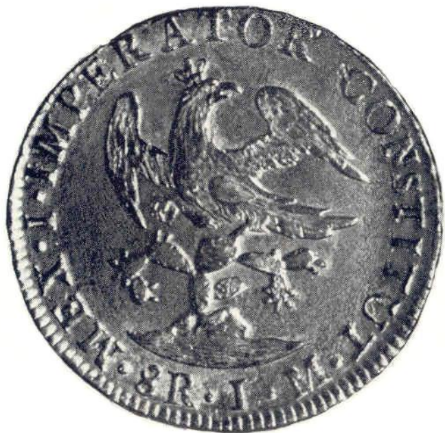
17. Об. ст. Августин I Итурбиде. 8 реалов 1823 г. Серебро. 2-я серия