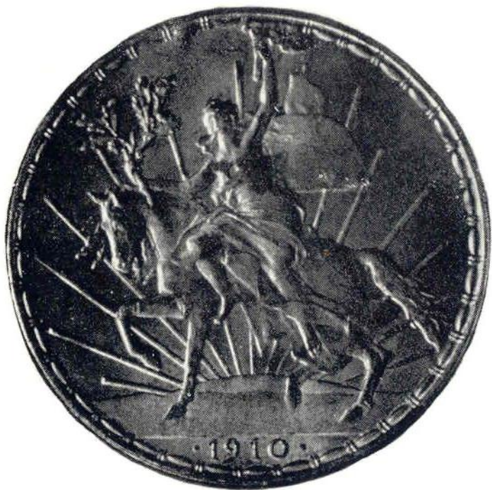
25. Об. ст. Мексиканские Соединенные Штаты. 1 песо 1910 г. Серебро