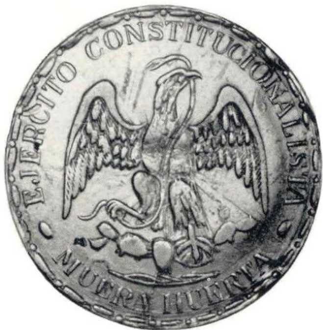
30. Л. ст. Революция, 1 песо 1914 г. с надписью «Долой Уэрту». Серебро