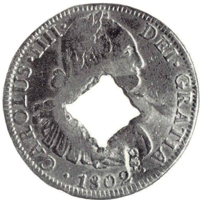
13. Л. ст. Карл IV. 8 реалов 1802 г. Надчеканена на Гваделупе. Сребро