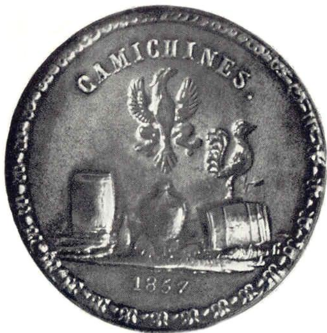
27. Л. ст. Глако асбенды Камичинес 1857 г. Латунь