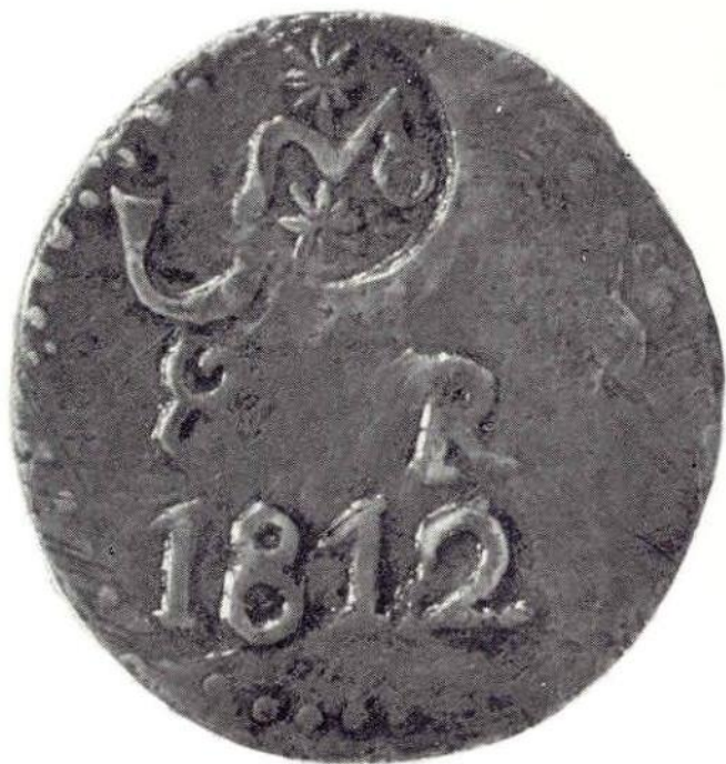
Об. ст. Генерал Х. М. Морелос. «Монета необходимости». 8 реалов 1812 г. Медь