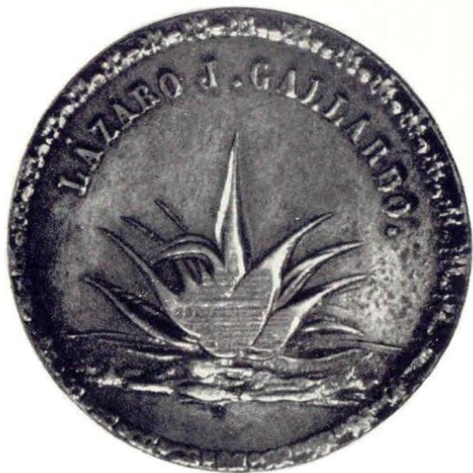
Об. ст. Глако асьенды Камичинес 1857 г. Латунь