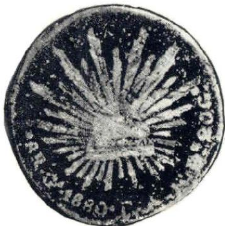
29. Л. и об. ст. Революция. Монета отлита в песочной форме в 1913 г. В качестве модели использованы 8 реалов 1880 г. Серебро