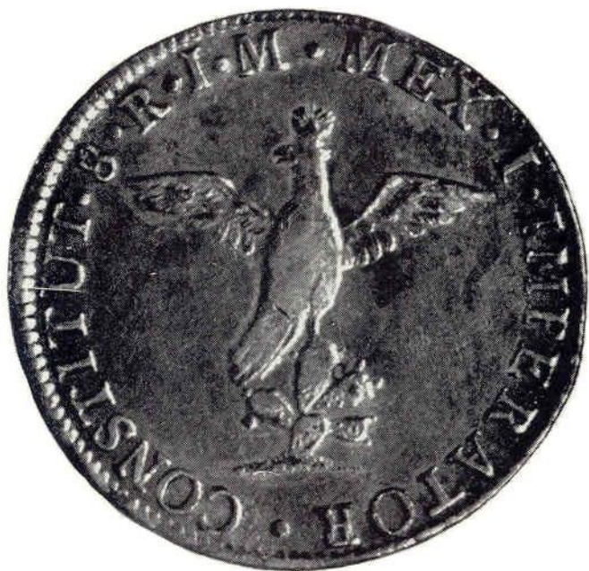
16. Об. ст. Августин I Итурбиде. 8 реалов 1822 г. Серебро. 1-я серия