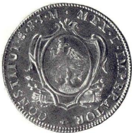
15. Л. и об. ст. Августин I Итурбиде, 8 эскудо 1823 г. Золото. 2-я серия