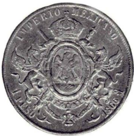
18. Л. и об. ст. Максимилиан. 1 песо 1866 г. Серебро