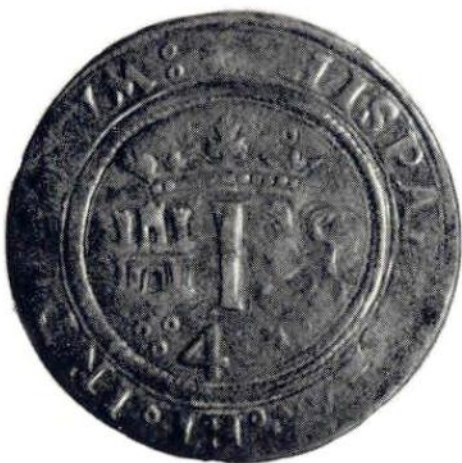
4. Л. и об. ст. Карл I и Хуана. 4 мараведи. Медь