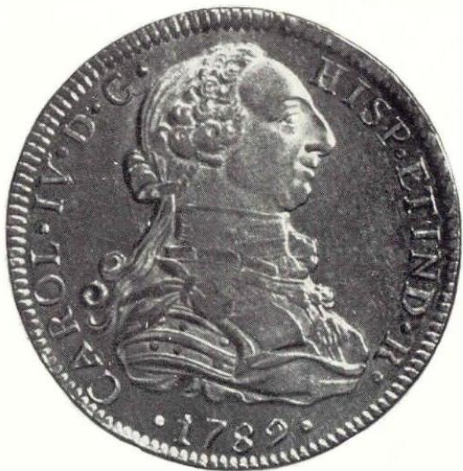
8. Л. ст. Карл IV, 8 эскудо 1789 г. Золото