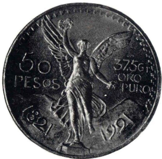
24. Об. ст. Мексиканские Соединенные Штаты. 50 песо 1921 г. в память столетия освобождения. Золото