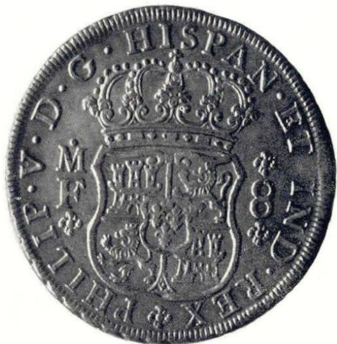
7. Л. ст. Филипп V. 8 реалов 1735 г. Серебро