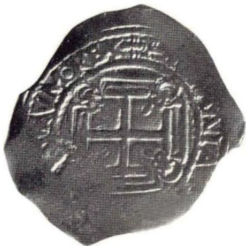
б. Л. и об. ст. Кара II. 4 зскудо 1698 г. Золото