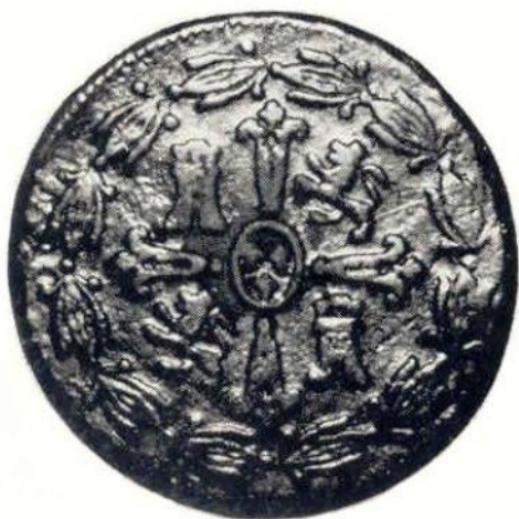
9. Л. и об. ст. Фердинанд VII, 2/4 реала 1815 г. Медь