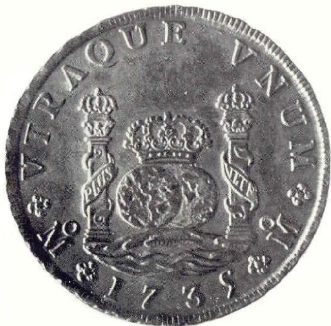
Об. ст. Филипп V. 8 реалов 1735 г. Серебро