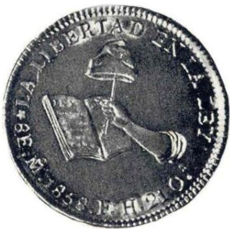
20. Л. и об. ст. Мексиканская республика. 8 эскудо 1858 г. Золото