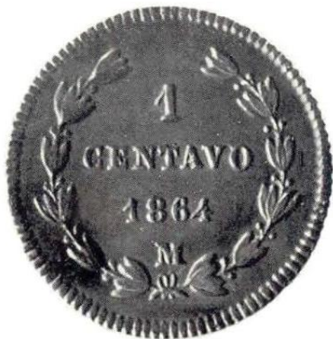
19. Л. и об. ст. Максимилиан. 1 сентаво 1864 г. Медь