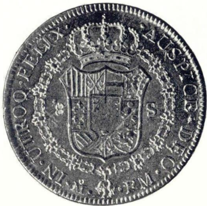
Об. ст. Карл IV. 8 эскудо 1789 г. Золото