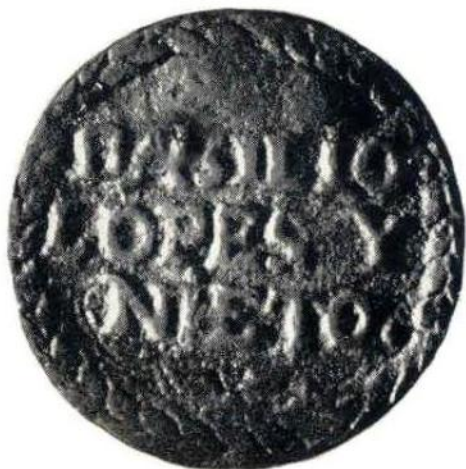
28. Л. и об. ст. Керетаро. Местный глако 1806 г. Медь