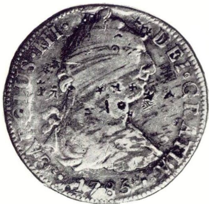
14. Л. ст. Карл III. 8 реалов 1785 г. с «чопами». Серебро