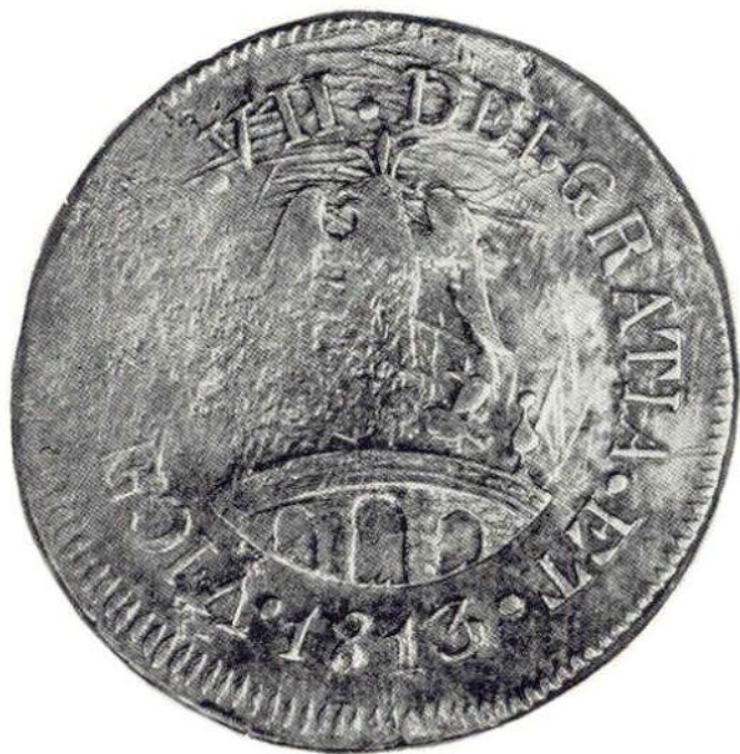
11. Л. ст. Верховная Хунта Ситакуаро. «Монета необходимости». 8 реалов 1813 г. Серебро