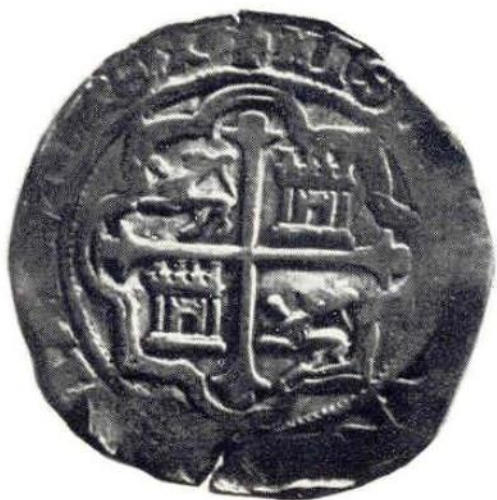
5. Л. и об. ст. Филипп II. 8 реалов. Серебро