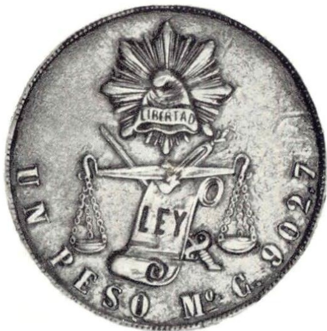
22. Об. ст. Мексиканская республика, 1 песо 1869 г. Серебро