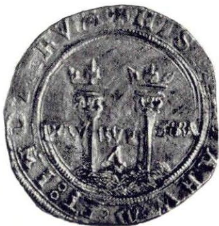
3. Л. и об. ст. Карл I и Хуана. 4 реала, Серебро, 2-я серия