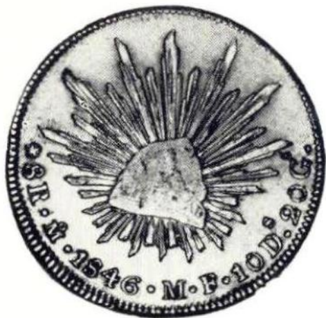
21 Л. и об. ст. Мексиканская республика, 8 реалов 1846 г. Серебро