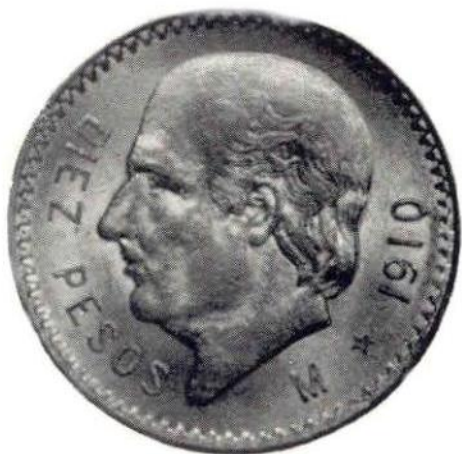
23. Л. и об. ст. Мексиканские Соединенные Штаты. 10 песо 1910 г. с портретом Идальго. Золото