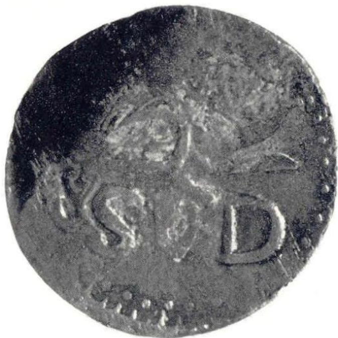
12. Л. ст. Генерал Х. М. Морелос. «Монета необходимости». 8 реалов 1812 г. Медь