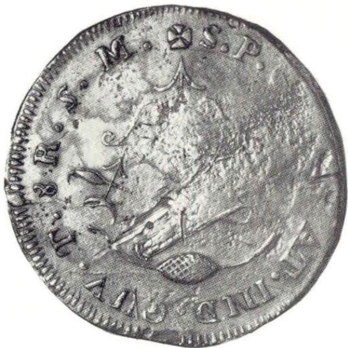
Об ст. Верховная Хунта Ситакуаро. «Монета необходимости». 8 реалов 1813 г. Серебро