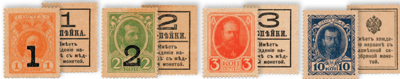
Марки-деньги. 1915-1916 гг. 24x30 мм