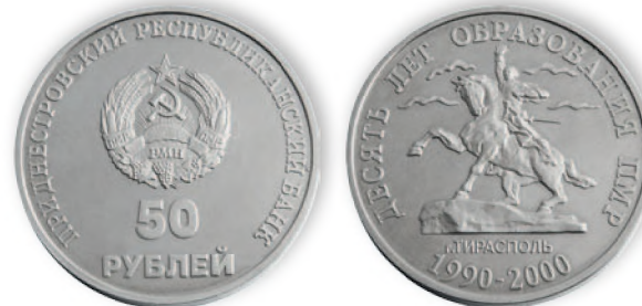
Приднестровский Республиканский банк. 50 руб. Медно-никелевый сплав. 2000 г. 33 мм