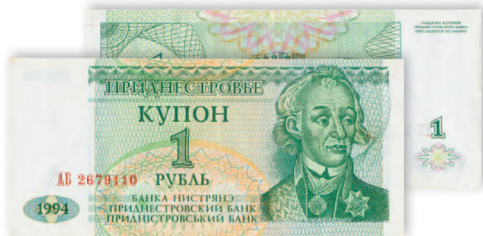
Купон Приднестровского Республиканского банка. 1 руб. образца 1994 г. 125x57 мм

Русский полководец, основатель столицы Приднестровья, стал основной фигурой приднестровских денег.