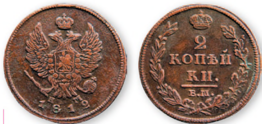
Александр I. 2 копейки. Медь. 1812 г. 29 мм

При Александре I на русские монеты вернулся двуглавый орел.