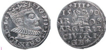
Речь Посполитая. Сигизмунд III Ваза. Тройной грош. Рига. Серебро. 1590 г. 21 мм