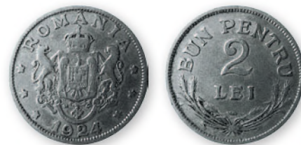
Королевство Румыния. Фердинанд 1.2 лей. Медно-никелевый сплав. 1924 г. 24 мм

Рост инфляции к концу войны привел к преобладающему обращению бумажных денег—в основном банкнот в 1,2 и 5 тыс. леев, которые несли на себе изображения идиллических сцен мирной сельской жизни.