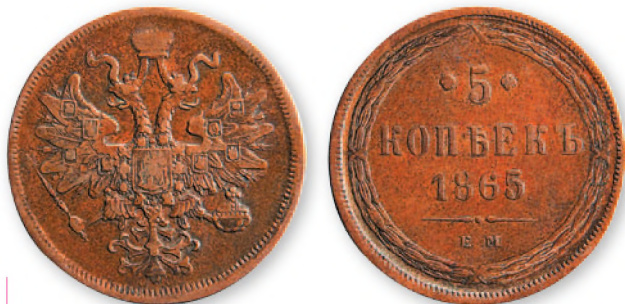
Александр II. 5 копеек. Медь. 1865 г. 36 мм