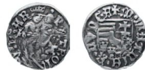
Королевство Венгрия. Матвей Корвин. Денарий. Серебро. 70—80-е гг. XV в. 15-16 мм