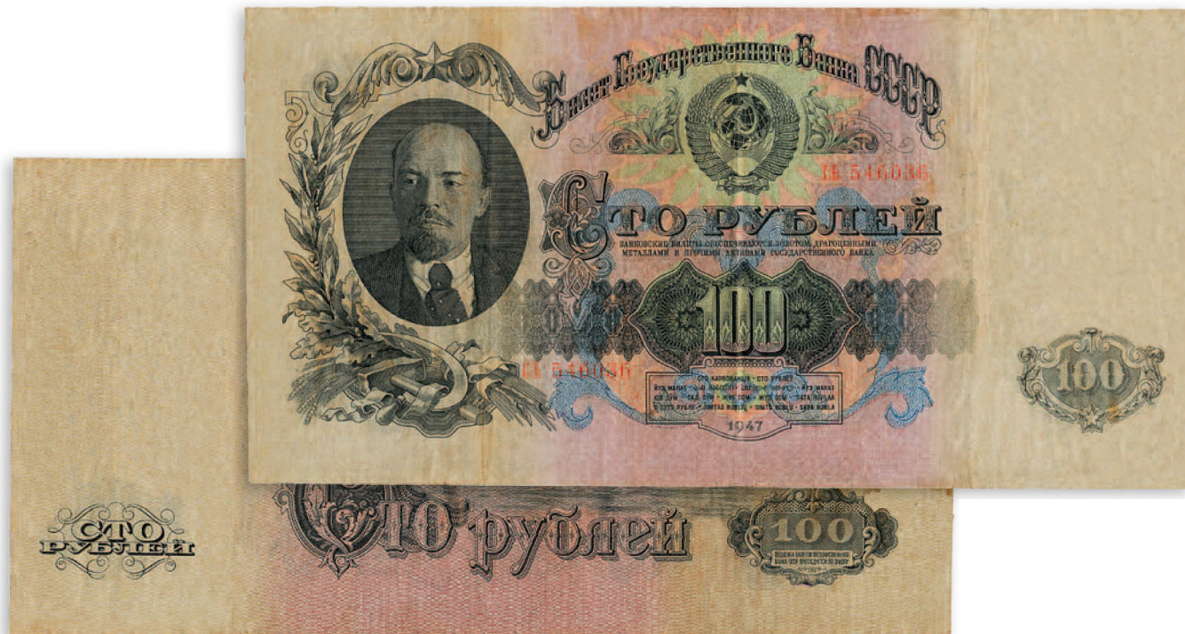
СССР. Билет Государственного банка. 100 руб. 1947 г. 230x115 мм