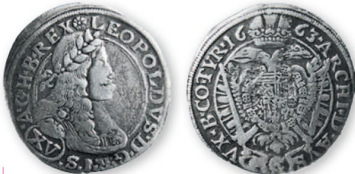
Австрия. Леопольд I (император Священной Римской империи). 15 крейцеров. Серебро. 1663 г. 29 мм