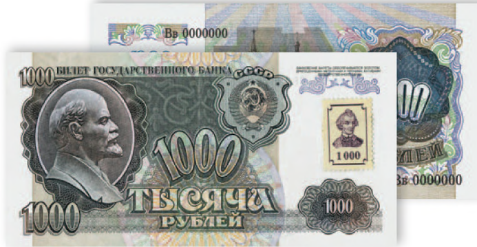
Билет Государственного банка СССР. 1000 руб. образца 1992 г. с защитной маркой ПМР. 144x71 мм