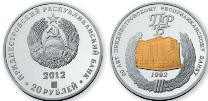
ПМР. 20 руб. «20 лет Приднестровскому Республиканскому банку». Серебро, проба 925, позолота. 2012 г. 39 мм

Тираж памятных монет очень невелик. Так, серебряные монеты обычно выпускаются в количестве 500-1000 штук, иногда 200-300. Тираж золотых монет не превышает 100 экземпляров.