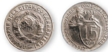
СССР. 15 копеек. Медно-никелевый сплав. 1931 г. 19, мм