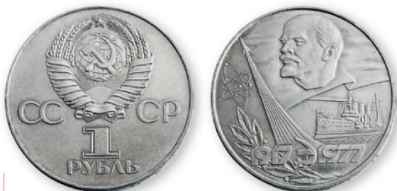
СССР. 1 рубль. Медно-никелевый сплав. 1977 г. 32 мм