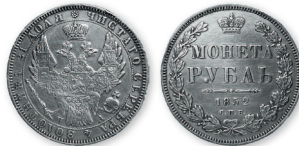
Николай I. Рубль. Серебро. 1852 г. 35 мм