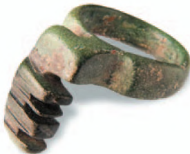
Перстень-ключ. Черняховская культура. Бронза. II-IV вв. н. э.

К началу IV в. н. э. греческие города Северо-Восточного Причерноморья находились в составе Боспорского царства, состоявшего в вассальных отношениях с Римской империей. Пантикапей, столица царства, продолжал оставаться крупнейшим торгово-ремесленным центром региона, поддерживавшим связи со всеми городами Причерноморья. В это время осуществлялся выпуск только бронзовой монеты— статера .