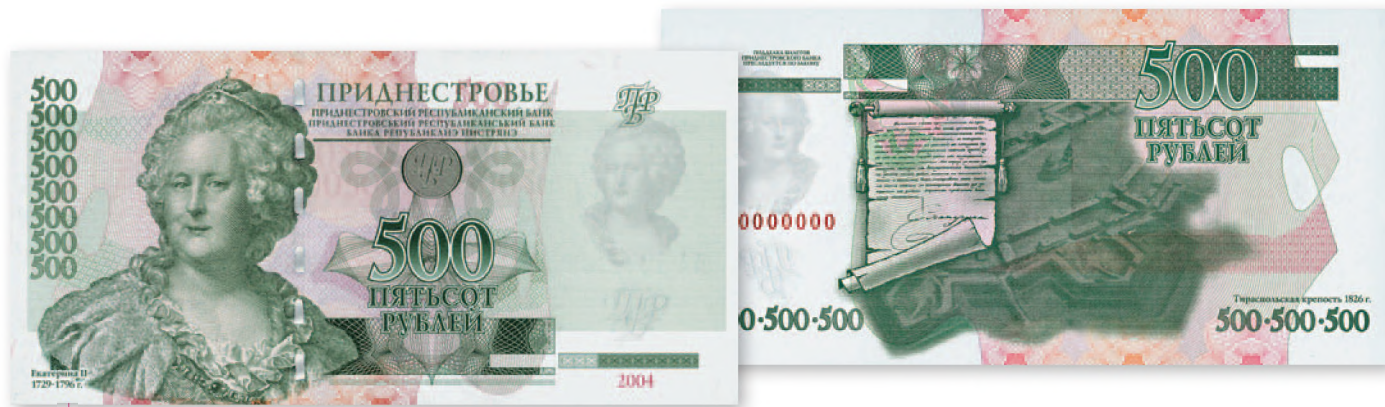
Билет Приднестровского Республиканского банка. 500 руб. образца 2004 г. 140x68 мм