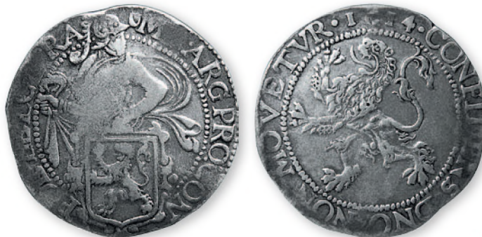
Священная Римская империя. Соединенные провинции Голландии. Левендаальдер (талер). Утрехт. Серебро. 1614 г. 40 мм

Наибольшее распространение в регионе получил голландский талер. Из-за изображенного на монете льва, стоящего на задних лапах, его называли « левендаальдер », т. е. «львиный талер». Эти монеты чеканили в Нидерландах в XVI—XVII вв. из серебра испанских владений в Америке. На Руси их именовали левками , а в Молдавии — леями . Позже это название получили все прочие монеты талерного типа. Известны фальшивые левендаальдеры. Предположительно, они могли производиться на территории Молдавского княжества.