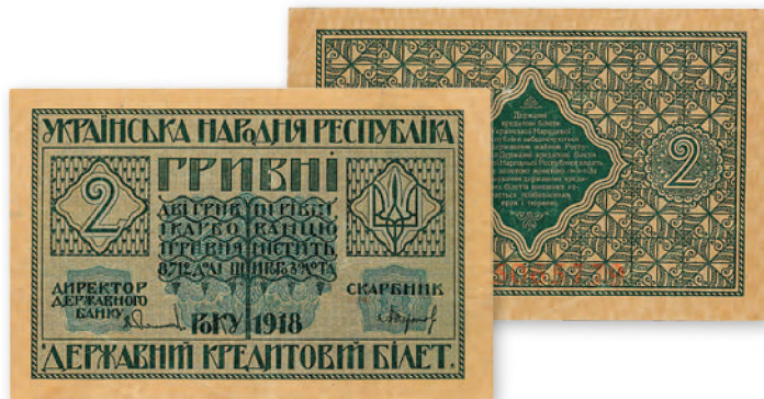
Украинская народная республика. Государственный кредитный билет. 2 гривны. 1918 г. 117x70 мм