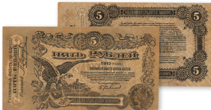
Разменный билет г. Одессы. 5 руб. 1917 г. 150x82 мм