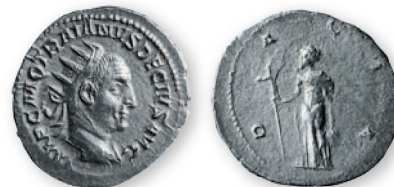
Римская империя. Деций Траян. Антониниан. Серебро. 249-250 гг. н. э. 22 мм