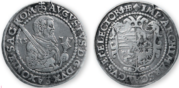
Священная Римская империя. Курфюршество Саксония. Август. Полуталер. Серебро. 1577 г. 34 мм