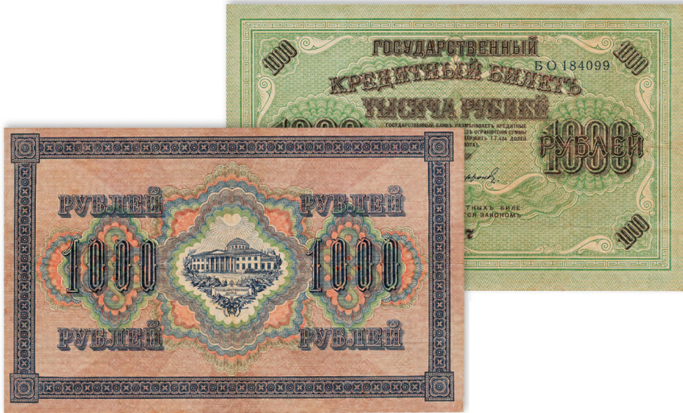
Временное правительство. Государственный кредитный билет. 1000 руб. 1917 г. 213x133 мм