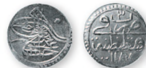
Османская империя. Абдул-Хамид I. Пара. Константинополь. Серебро. 1187 г. хиджры (1774 г.). 15 мм