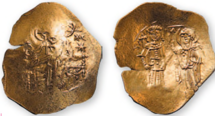
Балканская имитация трахеи Мануила I Комнина. Бронза. XIII в. 25-28 мм