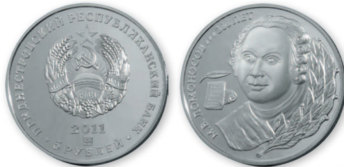
ПМР. 5 руб. «М.В. Ломоносову 300 лет». Серебро, проба 925.2011 г. 39 мм

Денежные знаки нашей республики пользуются популярностью в мире и не только у нумизматов. Для зарубежных коллекционеров — это монеты и купюры экзотической страны, для интересующихся краем — проекция исторических, общественных, культурных и других ценностей Приднестровья.