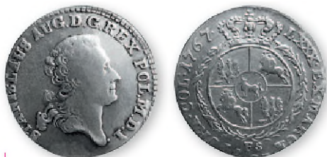
Речь Посполитая. Станислав Август Понятовский. Злотый. Варшава. Серебро. 1767 г. 26 мм

Польские медные монеты 50—70-х гг. XVIII в.