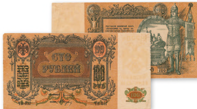
Денежный знак Ростовской-на-Дону конторы Госбанка. 100 руб. образца 1919 г. 181x94 мм

Денежные знаки белогвардейских властей отличались широким использованием в их оформлении патриотических мотивов. Странники России «единой и неделимой» на своих деньгах размещали изображения известных российских исторических памятников и героев.