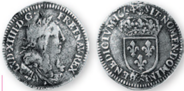
Франция. Людовик XIV. 1/12 экю. Серебро. 1664 г. 21 мм