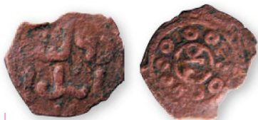
Золотая Орда. Анонимный пул времени правления Туда-Менгу. Крым. Медь. 1282-1287 гг. 17-20 мм