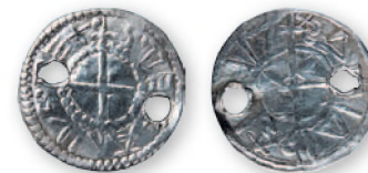
Королевство Венгрия. Стефан I. Денарий. Серебро. 1001-1038 гг. 18 мм

На территории Приднестровья (как и по всей Центральной Европе) со второй половины XIV в. начали обращаться пражские гроши — добротные чешские серебряные монеты массой около 4 г. Благодаря строго соблюдавшимся весу и пробе они быстро и надолго стали межгосударственным средством платежа. Эти гроши были в ходу на местных рынках даже спустя столетия после их выпуска.