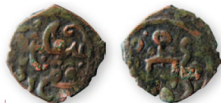
Золотая Орда. Анонимный пул. Предположительный регион выпуска— Пруто-Днестровское междуречье. 690 г. хиджры (1291 г.) 17 мм