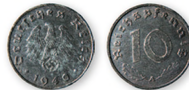
Германия. 10 рейхспфеннигов. Цинк. 1940 г. 21 мм

В начале 1944 г. по мере приближения линии фронта расширялось использование советских рублей, полностью вернувшихся в край после его освобождения.