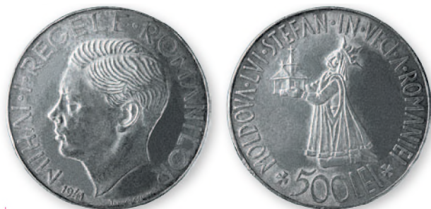
Королевство Румыния. Михай I. 500 леев. Серебро. 1941 г. 35 мм