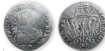
Силезия в составе Пруссии. Фридрих II. 6 крейцеров. Серебро. 1755 г. 24 мм

В XV-XVIII вв. Приднестровье отдельными своими частями входило в состав разных государств: Молдавского княжества, Велико-го княжества Литовского, Речи Посполитой, Османской империи и Крымского ханства. Однако в течение долгого времени обычным для нашего края было обращение привозной монеты, иногда выпущенной далеко за его пределами, в основном в странах Европы.