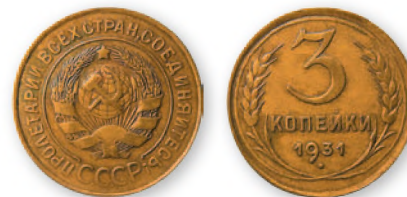
СССР. 3 копейки. Алюминийевая бронза. 1931 г. 22 мм

Новые образцы советских монет в 1,2,3 и 5 коп. с 1926 г. чеканили из алюминийево-бронзового сплава желтого цвета, а в 10,15 и 20 коп. с 1931 г.—из медно-никелевого сплава белого цвета. Тип мелких монет долгие годы менялся незначительно. На монетах в 10,15 и 20 коп. изображение рабочего с молотком, опирающегося на щит, и полное название государства в 1935 г. было заменено на более лаконичное обозначение номинала.