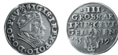
Королевство Польша. Сигизмунд I Старый. Тройной грош. Гданьск. Серебро. 1539 г. 21 мм