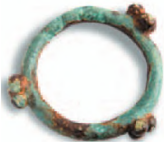
Кольцо кельтского типа. Бронза. IV-III вв. до н. э.

С конца IV в. до н. э. в связи с ростом могущества македонской державы монеты ее монархов играли значимую роль в денежном обращении большого региона. Позже, когда их приток сократился из-за военно-политических событий, местные варварские племена выпускали свои денежные знаки, подражавшие македонским образцам. Таким образом, недостаток привычной и необходимой монеты восполнялся собственными средствами.