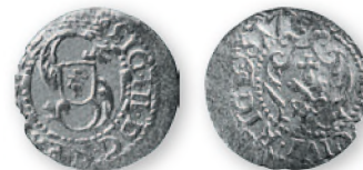
Речь Посполитая. Сигизмунд III. Солид. Рига. Биллон. 1617 г. 17 мм