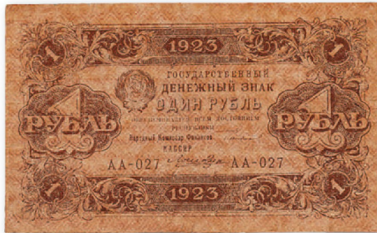
СССР. Государственный денежный знак. 1 руб. 1923 г. 109x66 мм