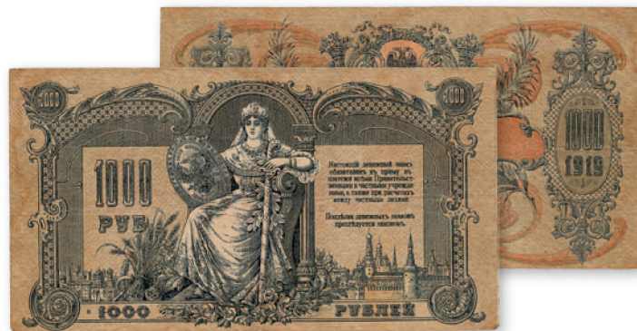
Денежный знак Ростовской-на-Дону конторы Госбанка. 1000 руб. образца 1919 г. 200x108 мм