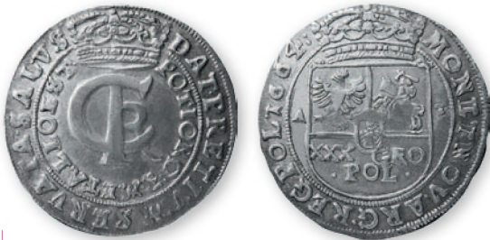
Речь Посполитая. Ян II Казимир Ваза. Тымф (30 грошей). Быдгощ. Серебро. 1664 г. 31 мм

При Яне II Казимире Ваза (1646-1668) наблюдался кратковременный прилив монет Речи Посполитой в Приднестровье.