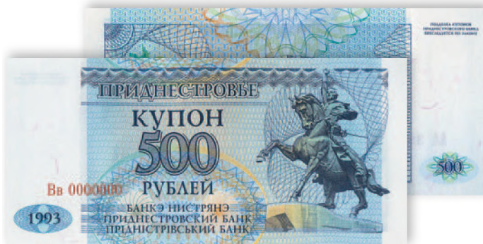
Купон Приднестровского Республиканского банка. 500 руб. образца 1993 г. 125x57 мм