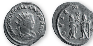
Римская империя. Галлиен. Антониниан. Серебро. 253-260 гг. н. э. 22 мм