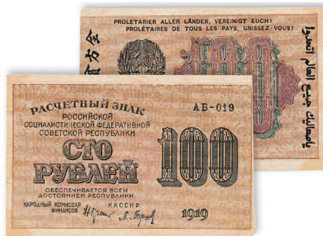
Расчетный знак РСФСР. 100 руб. 1919 г. 92x55 мм