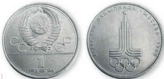
СССР. 1 рубль. Медно-никелевый сплав. 1977 г. 32 мм