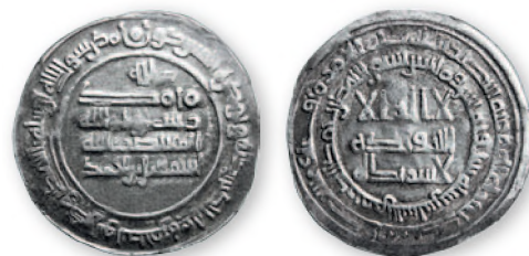
Государство Саманидов. Эмир Исмаил Самани. Дирхем. Монетный двор Шаш. Серебро. 286 г. хиджры (899 г.). 27 мм

Известны находки куфических монет в древнеславянских городищах у сел Екимауцы и Алчедар, на правом берегу Днестра.