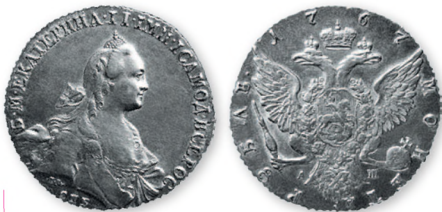
Екатерина II. Рубль. Серебро. 1767 г. 36 мм

Поток русской монеты усилился при Екатерине II: в ходе русско-турецких войн армия Российской империи, неоднократно совершавшая рейды по территории Приднестровья, для расчетов с местным населением при закупках продовольствия и фуража использовала российские деньги.