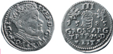
Речь Посполитая. Стефан Баторий. Тройной грош. Вильно. Серебро. 1585 г. 21 мм