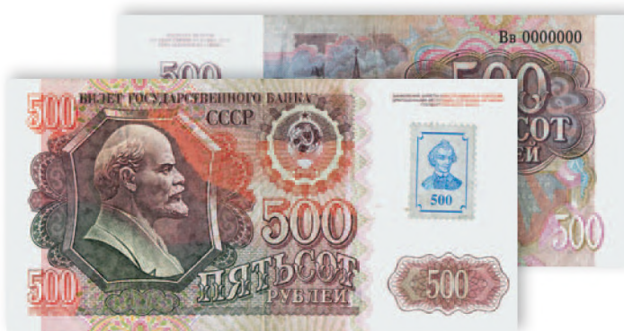
Билет Государственного банка СССР. 500 руб. образца 1991 г. с защитной маркой ПМР. 144x71 мм