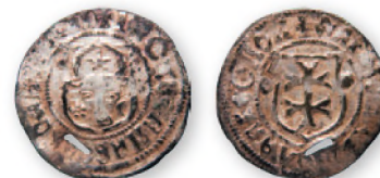
Молдавское княжество. Богдан III. Грош. Бронза, плакированная серебром. 1504-1517 гг. 19 мм