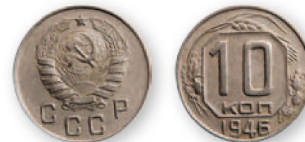
СССР. 10 копеек. Медно-никелевый сплав. 1946 г. 17 мм