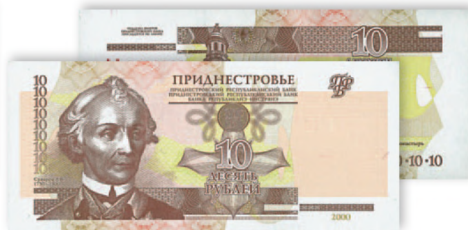
Билет Приднестровского Республиканского банка. 10 руб. образца 2000 г. 129x56 мм