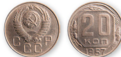
СССР. 20 копеек. Медно-никелевый сплав. 1957 г. 22 мм