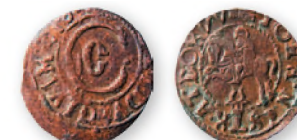
Молдавское княжество. Еустратие Дабижа. Солид (шалэу). Медь. 1661-1665 гг. 16 мм