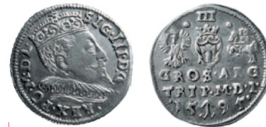
Речь Посполитая. Сигизмунд III Ваза. Тройной грош. Вильно. Серебро. 1595 г. 21 мм

Наиболее интенсивным потоком серебряные польско-литовские монеты поступали в регион в период правления королей Стефана Батория (1576-1586) и особенно Сигизмунда III Ваза (1586-1632). Причиной разнообразия монетной чеканки стала активная деятельность целого ряда государственных монетных дворов, которые размещались в «коронной» польской части государства — Познани, Мальборке, Быдгоще, Олькуше и др., в литовской части — Вильно, а также в Риге, захваченной Речью Посполитой в 1581 г.