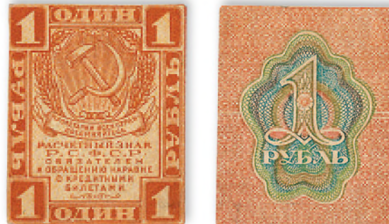
Расчетный знак РСФСР. 1 руб. 1919 г. 34x43 мм

Для облегчения денежных расчетов и снижения расходов бумаги и краски на изготовление денег большевики в 1920 г. приняли решение выпустить купюры более крупных номиналов, вплоть до 10 000 руб. В 1921 г. в ходу уже были совзнаки нарицательной стоимостью 25 000, 50 000 и даже 100 000 руб. Этот факт свидетельствовал о крайне расстроеном состоянии денежного обращения и огромных масштабах инфляции.