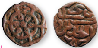
Золотая Орда. Предположительно региональный выпуск по образцу анонимного пула Сарая ал-Джедид. Медь. 753 г. хиджры (1352/1353 гг.). 18 мм

Наибольшее количество найденных монет золотоордынского периода приходится на время правления ханов Узбека (1312-1341) и Джанибека (1342-1357). Этот период характеризовался расцветом Золотой Орды: развитие получили сельское хозяйство, ремесла и торговля как между отдельными удаленными регионами джучидского государства, так и с его соседями.