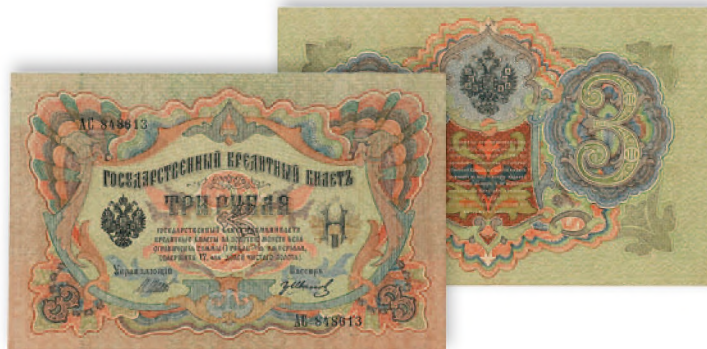
Государственный казначейский билет. 3 руб. образца 1905 г. 155x100 мм

Кредитные билеты образца 1909-1912 гг. продолжили традицию изображения на бумажных денежных знаках парадных портретов российских монархов, начало которой было положено еще в 60-е гг. XIX столетия. Настоящими шедеврами среди российских бумажных денег являются знаменитые 100-рублевые « каменки » и 500-рублевые « петуши ». Сложнейшие и искуснейшие гравюры портретов российских самодержцев Екатерины II и Петра I на них уже сами по себе служили серьезной защитой банкнот от подделок наряду с водяным знаком, который к тому времени стал весьма сложным.