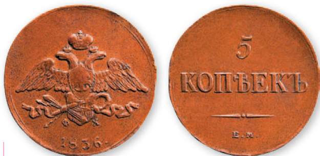
Николай I. 5 копеек. Медь. 1836 г. 36 мм