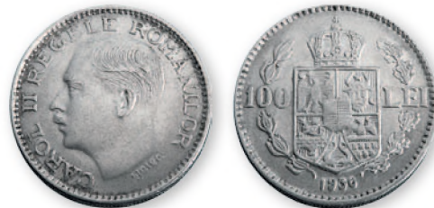
Королевство Румыния. Карол II. 100 леев. Никель. 1936 г. 27 мм