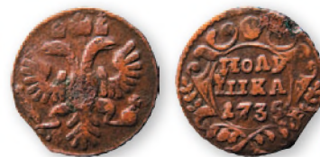
Анна Иоанновна. Полушка. Медь. 1735 г. 20 мм

Русская монета, в первую очередь медные деньги императрицы Анны Иоанновны и Елизаветы Петровны, не редкость среди находок в нашем крае.