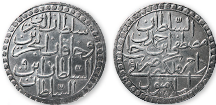
Османская империя. Мустафа III. Алтмышлык (60 пара). Стамбул. Серебро. 1171 г. хиджры (1757 г.). 42 мм