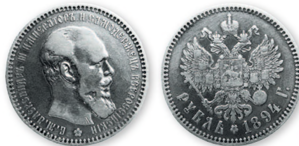
Александр III. Рубль. Серебро. 1894 г. 33 мм