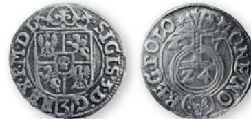
Речь Посполитая. Сигизмунд III. Полтораки. Быдгощ. Серебро. 1627 г. 20 мм