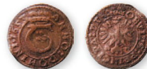
Герцогство Тешин. Фердинанд IV. Обол. Биллон. 1653 г. 16мм