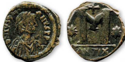
Византия. Юстиниан I. Фоллис. Медь. 527-556 гг. 30 мм

Византийская монетная система оказывала большое влияние на соседние страны, включая Киевскую Русь, Болгарию и Сербию.