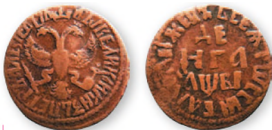
Петр I. Деньга. Медь. 1712 г. 22 мм