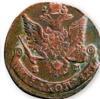
Екатерина II. 5 копеек. Медь. 1784 г. 41 мм