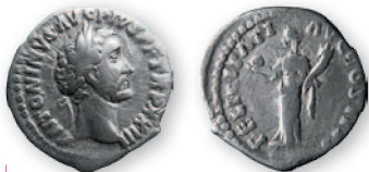
Римская империя. Антоний Пий. Денарий. Серебро. 153-154 гг. н. э. 18 мм