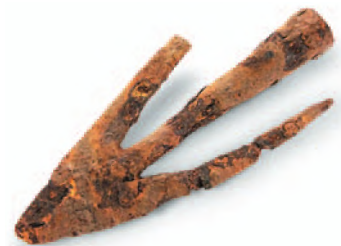
Наконечник стрелы. Железо. VIII—IX вв.