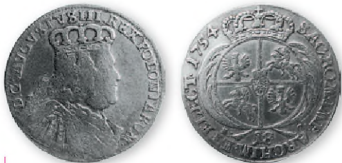
Речь Посполитая. Август III. Орт (тымф). Лейпциг Серебро. 1754 г 28 мм