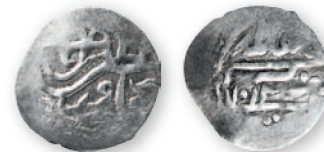
Османская империя. Ахмед I. Бешлык. Джанджа. Серебро. 1012 г. хиджры (1603 г.). 18 мм