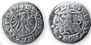
Великое княжество Литовское. Александр Ягеллончик. Полугрош. Серебро. 1492-1506 гг. 21 мм

В XIV в. Великое княжество Литовское захватило обширные земли на юге и распространило свою власть вплоть до Черного моря. Позиции княжества и Польского королевства еще больше укрепились в конце столетия благодаря династической унии и союзу государств, что создало крайне благоприятные условия для распространения их монет.