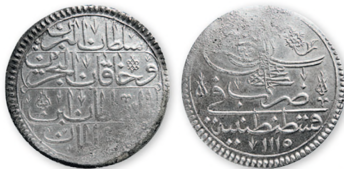
Османская империя. Ахмед III. Куруш (40 пара). Константинополь. Серебро. 1115 г. хиджры (1703 г.). 39 мм