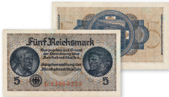
Германия. Билет Имперских кредитных касс. 5 рейхсмарок. 123x70 мм