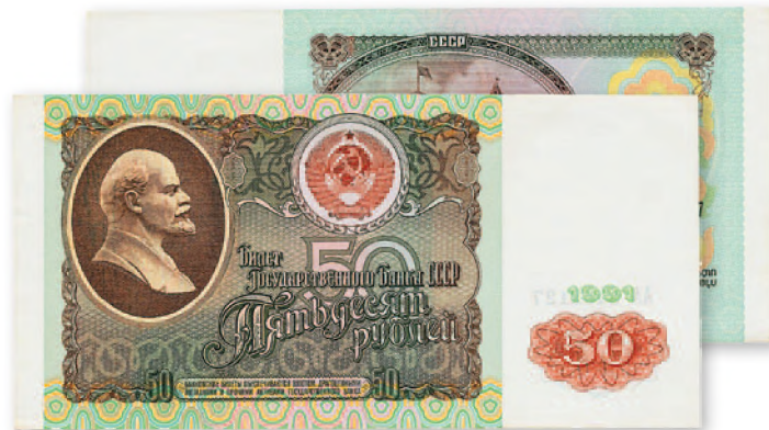
СССР. Билет Государственного банка. 50 руб. 1991 г. 144x71 мм