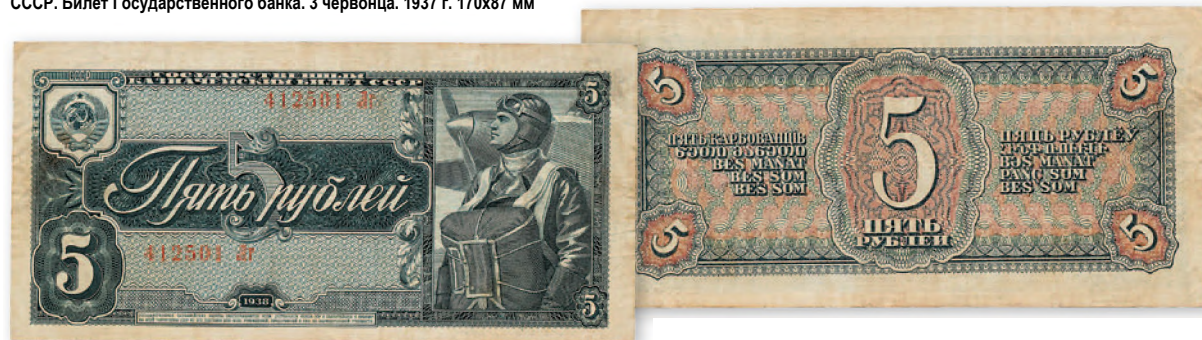
СССР. Государственный казначейский билет. 5 руб. 1938 г. 145x70 мм