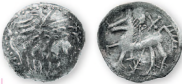
Кельтское (?) подражание македонской тетрадрахме Филиппа II. Серебро. II-I вв. до н. э. 19-20 мм