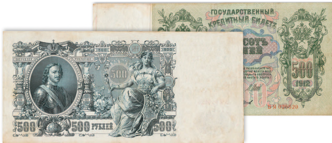
Государственный казначейский билет. 500 руб. образца 1912 г. 275x126 мм