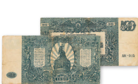
Денежный знак Главного командования Вооруженными силами Юга России. 500 руб. образца 1920 г. 151x76 мм