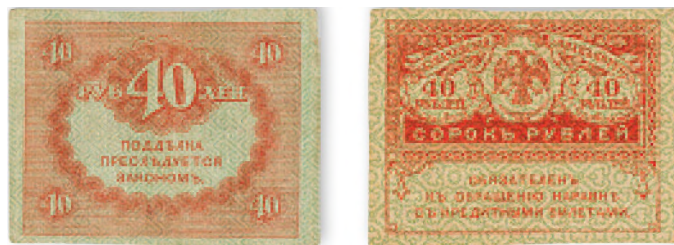
Временное правительство. Казначейский знак. 40 руб. (керенка). 1917 г. 55x43 мм