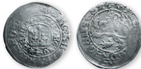
Королевство Чехия. Йиржи из Подебрад. Грош. Серебро. 1458-1471 гг. 28 мм