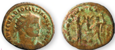
Римская империя. Диоклетиан. Антониниан. Бронза. 291 г. н. э. 18-20 мм