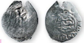
Золотоордынский данг хана Кичи Мухаммеда, контрамаркированный (надчеканенный) в Белгороде. Серебро. Вторая треть XV в. 14-17 мм