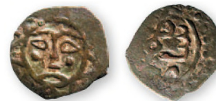
Золотая Орда. Анонимный пул с тамгами Менгу-Тимура и Ногая. Сакчи (?) или Солхат (?). Медь. Предположительно 90-е гг. XIII в. 16-18 мм