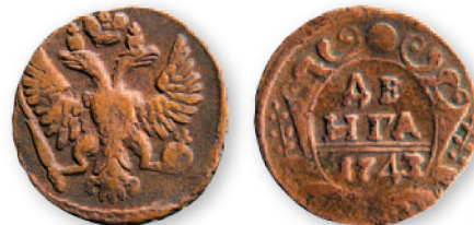
Елизавета Петровна. Деньга. Медь. 1743 г. 24 мм