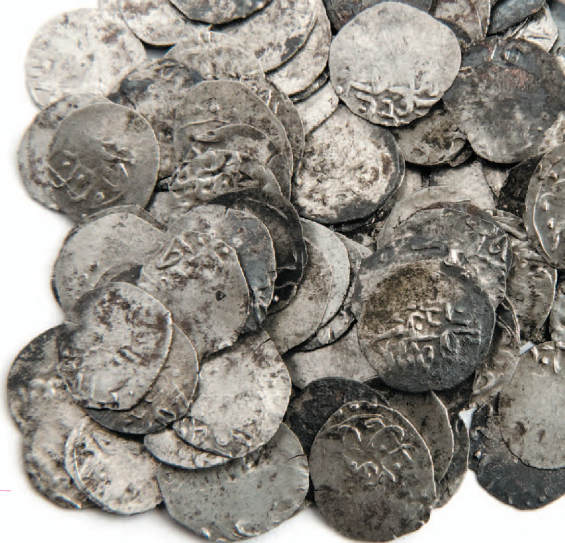
Акче Ахмеда III из бендерского клада