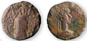
Боспорское царство. Рескупорид V. Статер. Бронза. 326 г. н. э. 19 мм