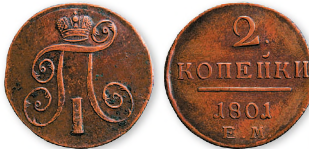
Павел I. 2 копейки. Медь. 1801 г. 36 мм

С серебряных монет почти на 100 лет исчез портрет. Дело в том, что император был курнос и на пробных монетах его изображение в профиль получалось совсем без носа. Поэтому вместо своего портрета он поместил надпись «Не нам, не нам, а имени твоему»—библейский девиз рыцарей ордена Тамплиеров.