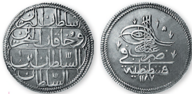
Османская империя. Абдул-Хамид I. Куруш (40 пара). Константинополь. Серебро. 1187 г. хиджры (1774 г.). 38 мм