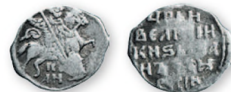
Иван IV Грозный. Копейка. Новгород. Серебро. 50—60-е гг. XVI в. 14-17 мм