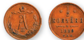
Александр III. 1/2 копейки. Медь. 1889 г. 15 мм

При Александре III с 1886 г. на банковской монете (25, 50 коп. и 1 руб.) появился портрет императора. Серебряная проба этих монет была повышена с 868-й до 900-й при некотором снижении массы самой монеты. Рублевая монета стала весить 20 г, но содержание чистого серебра в ней осталось прежним —18 г.