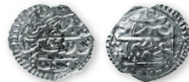
Крымское ханство. Крым Гирей, первое правление. Бешлык. Бахчисарай. Серебро. 1172 г. хиджры (1758 г.). 18-21 мм