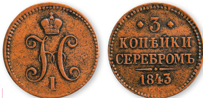
Николай I. 3 копейки. Медь. 1843 г. 38 мм

В годы царствования Николая I оформление монет неоднократно изменялось. Так, в период с 1830 по 1839 г. на лицевой стороне медных монет помещалось изображение двуглавого орла особого образца: вместо скипетра и державы он держал в лапах венок, факел, стрелы и ленты. Кроме номиналов в 1, 2 и 5 коп. в то же время выпускалась медная монета в 10 коп.