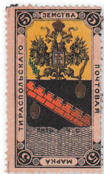
Марка земской почты Тираспольского уезда, 1879 г.