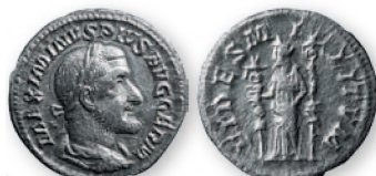
Римская империя. Максимиан I Фракийец. Денарий. Серебро. 235-236 гг. н. э. 19 мм

Римский денарий на долгое время стал самой распространенной серебряной монетой Древнего Рима. Даже после падения государства еще на протяжении столетий денарий сохранялся в названиях многих европейских денежных единиц.