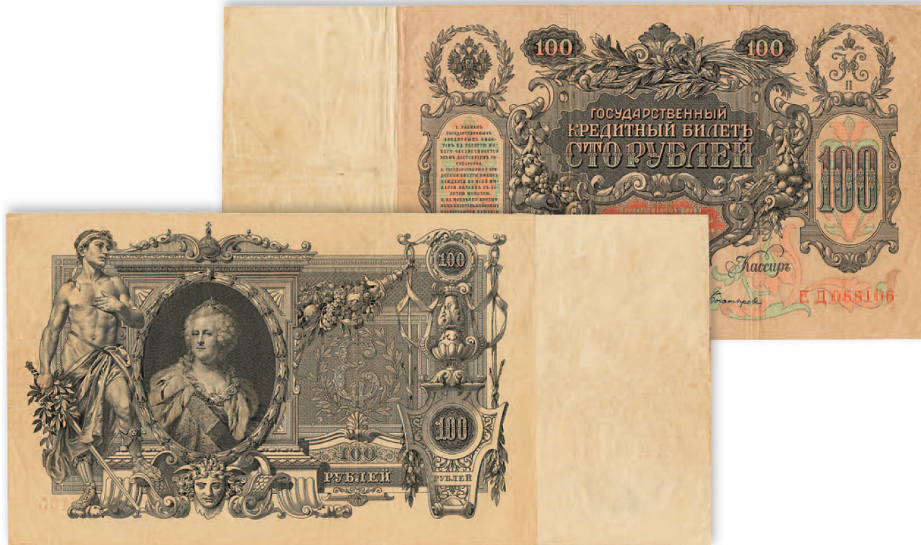
Государственный казначейский билет. 100 руб. образца 1910 г. 258x120 мм