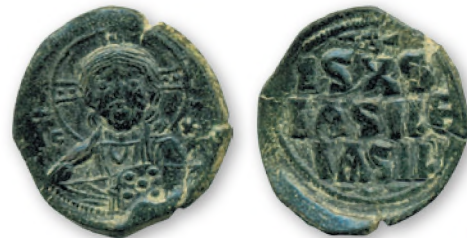
Византия. Анонимный фоллис. Медь. X - начало XI в. 28 мм