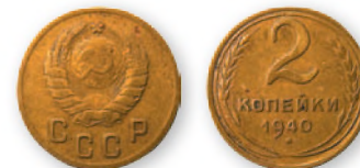
СССР. 2 копейки. Алюминийевая бронза. 1940 г. 18 мм