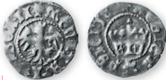
Королевство Польша. Ян I Ольбрахт. Полугрош. Серебро. 1492-1501 гг. 19 мм