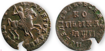
Петр I. Копейка. Медь. 1713 г. 25 мм

Со времен Прутского похода Петра I в 1711г. российские монеты все чаще стали проникать в денежное хозяйство Приднестровья. Важную роль в их распространении играли русские войска, воевавшие в этом регионе и в соседних областях против Османской империи и ее вассала—Крымского ханства.