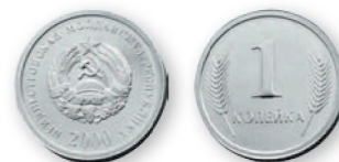
ПМР. 1 коп. Алюминиевый сплав. 2000 г. 16 мм

Полный цикл монетного производства включает изготовление заготовок, их термическую и гальваническую обработку, штамповку и упаковку. Продукцию местного монетного двора отличает год чеканки — 2005-й.