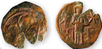
Византия. Андроник III. Стаменон. Бронза. 1328-1341 гг. 20 мм

В период раннего средневековья Византия выступала единственным источником пополнения монетной массы на территории Северо-Западного Причерноморья. Статистика находок византийских монет в этом регионе позволяет выделить несколько хронологических этапов их поступления. Первый охватывает V - середину VIII в. Второй, после присоединения Добруджи к владениям Византии при Иоанне I Цимисхии, - середину X - конец XII в. Последний период относится к XIV в., когда византийская монета, предположительно, наряду с болгарской обращалась на золотоордынских поселениях Днестровско-Прутского междуречья.