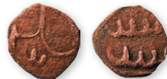
Золотая Орда. Анонимный пул. Костештское поселение. Медь. 50—60-е гг. XIV в. 17 мм

Есть предположение, что самая встречаемая в регионе золотоордынская монета — медный пул с цветочным орнаментом (розеткой), несущий даты времен хана Джанибека и место чекана Сарай ал-Джедид — тоже чеканилась в нашем регионе по образцу столичной монеты.