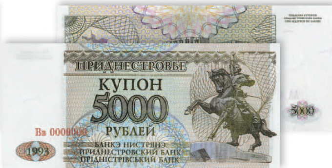
Купон Приднестровского Республиканского банка. 5000 руб. образца 1993 г. 125x57 мм