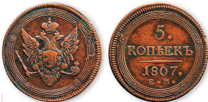
Александр I. 5 копеек. Медь. 1807 г. 42 мм