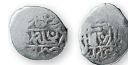
Османская империя. Сулейман I. Медини. Багдад. Серебро. 926 г. хиджры (1520 г.). 13-14 мм