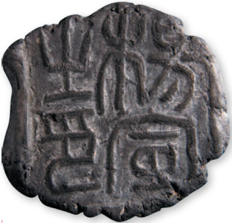
Китай. Династия Юань. Оттиск именной торговой печати из находок на Костештском поселении. Глина. Конец XIII - XIV вв.