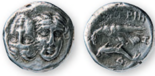
Истрия. Драхма. Серебро. IV-III вв. до н. э. 17 мм

Важную роль в экономической жизни Причерноморья во второй половине IV — начале III в. до н. э. играла западно-понтийская греческая колония Истрия, серебряные монеты которой — драхмы — служили значимым средством торговли в регионе. На лицевой стороне драхм этого города были изображены головы Диоскуров (древнегреческих полубогов — сыновей Зевса), а на оборотной — орел над дельфином, вверху наименование Истрии на ионийском диалекте—ΙΣΤΡΗΝ