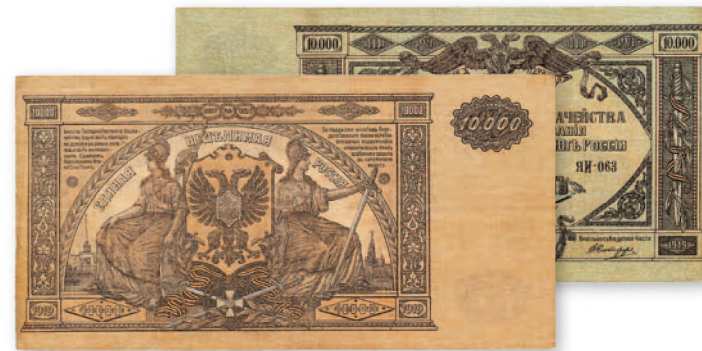
Денежный знак Главного командования Вооруженными силами Юга России. 10 000 руб. образца 1919 г. 200x103 мм