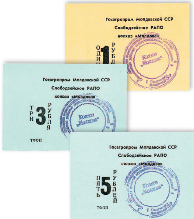
Внутрихозяйственные денежные знаки колхоза «Молдова» с. Коротное Слободзейского района. 1989 г.

Со второй половины 80-х гг. партийное руководство СССР предпринимало попытки реформирования всех сфер жизни советского общества. Для стимулирования аграрного сектора было дано разрешение использовать внутрихозяйственные , или хозрасчетные деньги — особые знаки, вводимые колхозом, совхозом. Приднестровские колхозы и совхозы тоже включились в эту практику взаиморасчетов.