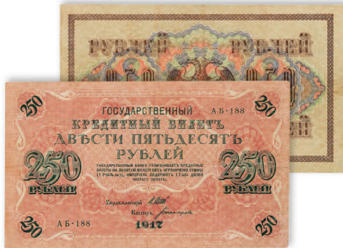
Временное правительство. Государственный кредитный билет. 250 руб. 1917 г. 175x104 мм

Мелкие керенки (маленькие квадратные денежные знаки достоинством 20 и 40 руб.) поставлялись в больших неразрезанных листах, от которых отрезали необходимую часть во время расчетов. По мере роста инфляции их перестали резрзывать и расплачивались целыми листами. Керенки печатались в неспециализированных типографиях, иногда даже на обороте этикеток, что привело в скором времени к потере какого-либо доверия к ним населения.