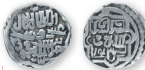
Золотая Орда. Джанибек. Данг. Сарай ал-Джедид. Серебро. 743 г. хиджры (1342/1343 гг.). 16 мм