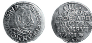
Княжество Трансильвания. Сигизмунд Баторий. Тройной грош. Серебро. 1597 г. 21 мм

Использование местного сырья давало возможность венгерским и трансильванским монетным дворам работать относительно независимо от политической обстановки и ситуации на международных торговых путях.