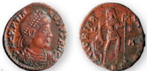
Западная Римская империя. Флавий Грациан. АЕ 3. Бронза. 375 г. н.э. 17 мм

Интересным представляется факт использования монеты как средства политической пропаганды. Так, некоторые позднеримские монеты несли изображение воина, пронзающего копьем упавшего всадника, и надпись: «FEL TEMP REPARATIO» («Восстановление счастливых времен»), что должно было вселять в римских граждан уверенность в успехе борьбы с варварами.