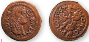
Речь Посполитая. Ян II Казимир Ваза. Солид (боратинка). Уяздов. Медь. 1664 г. 17 мм