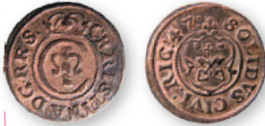
Прибалтийские владения Швеции. Кристина Августа Ваза. Рига. Солид. Биллон. 1647 г. 16 мм