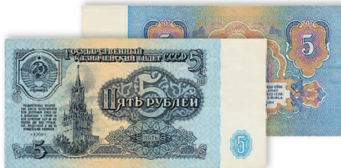
СССР. Государственный казначейский билет. 5 руб. 1961 г. 114x57 мм

Советский рубль сохранял свою относительную устойчивость вплоть до конца 80-х гг. После распада СССР в 1991 г. создаваемые национальные валюты независимых республик окончательно похоронили советские деньги.