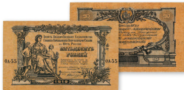
Денежный знак Главного командования Вооруженными силами Юга России. 50 руб. Образца 1919 г. 148x90 мм