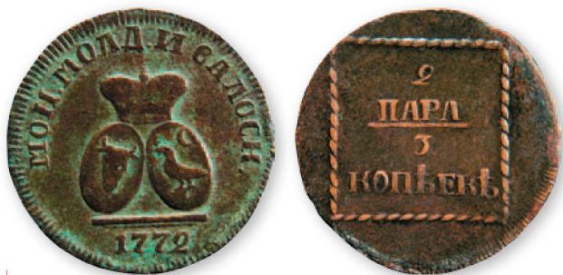
Екатерина II. Монета для Молдавии и Валахии. 2 пара—3 копейки. Бронза. 1772 г. 35 мм

Монеты чеканились на частном монетном дворе в Буковине, в местечке Садогура (ныне в пределах г. Черновцы). В качестве сырья использовалась бронза трофейных турецких пушек. Так, только в Бендерах у турок было отбито более 200 пушек и 85 мортир, и общий вес турецких орудий, доставленных из этой крепости для переплавки в монету, составил свыше 7,7 тыс. пудов.