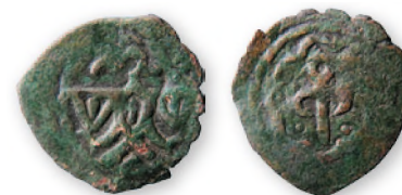
Золотая Орда. Анонимный пул с тамгой Ногая. Регион выпуска, предположительно, Подунавье. Медь. Вероятно, 90-е гг. XIII в. 21-22 мм