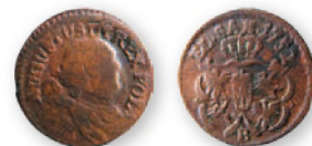
Речь Посполитая. Август III. Солид. Губин. Медь. 1752 г. 15 мм