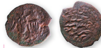
Бейлик Эретна (Малая Азия). Ала ал-Дин. Фельс. Медь. 751 г. хиджры (1350 г.). 18,5-19 мм

Золотоордынские поселения поддерживали торговые связи с другими частями монголо-татарского государства, а также с соседями на Балканах и в Малой Азии и, возможно, с далеким Китаем. Свидетельством таких контактов являются найденные монеты XIII-XIV вв. как исламских стран (государств Ильханов и Сельджуков Рума, анатолийских бейликов), так и христианских (Византии, Болгарии, Трапезунда, Сербии).