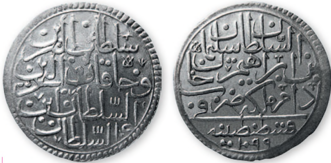
Османская империя. Сулейман II. Золта (30 пара). Константинополь. Серебро. 1099 г. хиджры (1687 г.). 38 мм