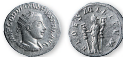
Римская империя. Гордиан III. Антониниан. Серебро. 242-244 гг. н. э. 22 мм

Впрочем, в связи с дальнейшим ухудшением положения денежной системы империи антониниан повторил судьбу денария. При Галлиене (253-268 гг.) он чеканился из серебра значительно более низкой пробы, а затем и вовсе стал субэратной или просто бронзовой монетой с принудительным курсом обращения.