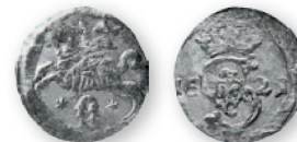
Речь Посполитая. Сигизмунд III. Двойной денарий. Вильно. Биллон. 1621 г. 14 мм

Качество европейской серебряной монеты все более ухудшалось, что создавало условия для возвращения в наш регион турецкой монеты, поскольку политическое и военное влияние Османской империи в Приднестровье и Молдавии оставалось огромным.