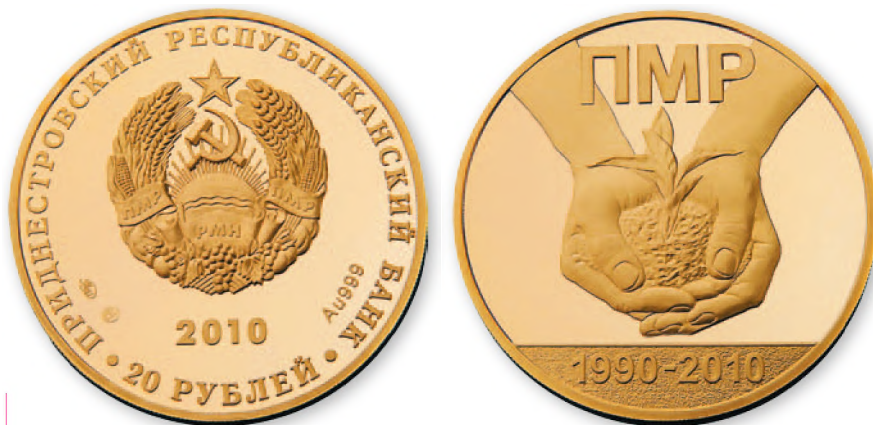
ПМР. 20 руб. «20 лет образования ПМР». Золото, проба 999.2010 г. 50 мм