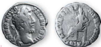
Римская империя. Коммод. Денарий. Серебро. 188-189 гг. н. э. 18 мм