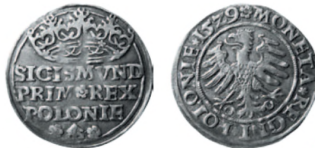
Королевство Польша. Сигизмунд I Старый. Грош. Серебро. 1529 г. 25 мм

В 1958 г. в с. Спя Григориопольского района был обнаружен клад, содержащий 100 серебряных монет, среди которых находились как польские полугроши Сигизмунда I Старого, так и турецкие акче Баязида II (1481-1512), Селима I (1512-1520) и Сулеймана I (1520-1566). Предположительно, клад был зарыт в середине XVI в. Эта находка свидетельствует не только о параллельном хождении различных иностранных монет, но и о притоке польских денег, которые в последней четверти XVI в. заменили теряющие в весе турецкие акче.