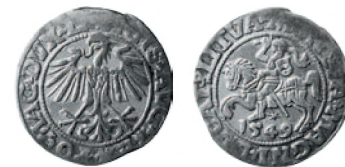
Великое княжество Литовское. Сигизмунд II Август. Полугрош. Серебро. 1549 г. 19 мм