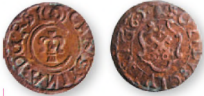
Сучавская подделка рижского солида Кристины Августы Ваза с ошибочной датой -1662 г. (Кристина Августа отреклась от престола в 1654 г.). Медь. 16 мм