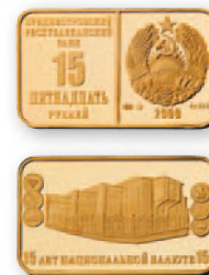
ПМР. 15 руб. «15 лет национальной валюте». Золото, проба 999.2009 г. 22x13 мм