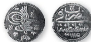
Османская империя. Ахмед III. Пара. Константинополь. Серебро. 1115 г. хиджры (1703 г.). 16 мм

Необходимо отметить, что география находок охватывает преимущественно южную и центральную части нашего региона, т. е. земли, подвластные Османской империи и ее вассалу — Крымскому ханству.