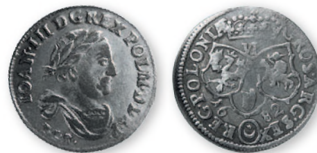
Речь Посполитая. Ян III Собеский. Шестак (6 грошей). Быдгощ. Серебро. 1682 г. 25 мм

В северном Приднестровье, входившем в состав Речи Посполитой, неполноценная польская монета активно вытеснялась иностранной (европейской, русской и турецкой). Потеря независимости Польского государства в 1795 г. привела к утрате собственной монеты.