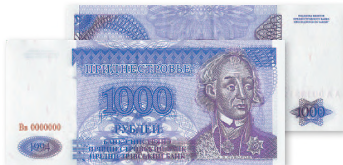
Денежный знак Приднестровского Республиканского банка. 1000 руб. образца 1994 г. (использовался номиналом 100 000 руб.) 125x57 мм

Выпуск денег не поспевал за инфляцией. Так, банкнота образца 1994 г. (без слова «купон») в 1000 руб. сразу приобрела номинал в 100 000. Знак в 50 000 руб. был приравнен к 500 000. В своем оформлении он отличался украинскими мотивами. На одной стороне вместо привычного портрета А. Суворова было помещено изображение Б. Хмельницкого, а на другой — памятник Т. Шевченко на фоне здания Приднестровского государственного университета.