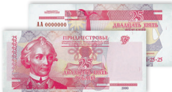
Билет Приднестровского Республиканского банка. 25 руб. образца 2000 г. 129x56 мм