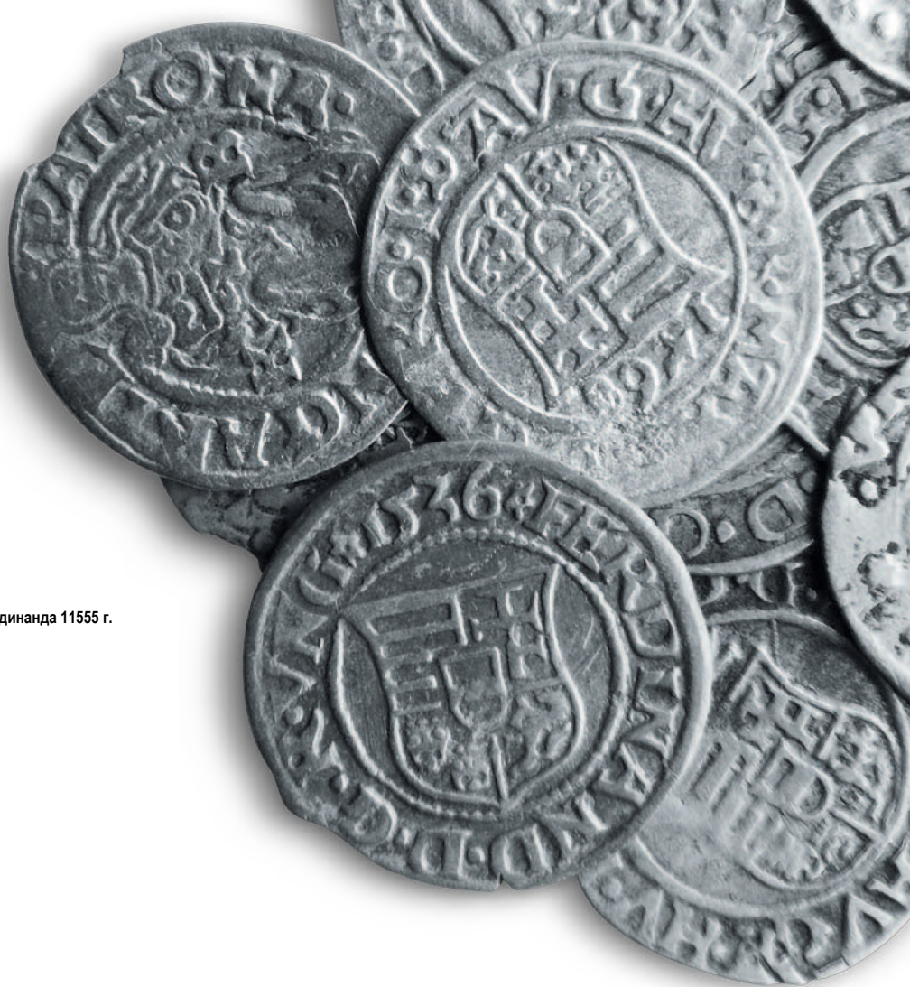
Венгерские денарии XVI в.