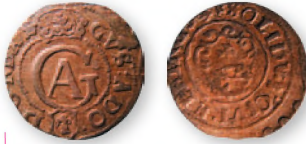
Прибалтийские владения Швеции. Густав II Адольф Ваза. Солид. Эльблонг. Биллон. 1624 г. 17 мм