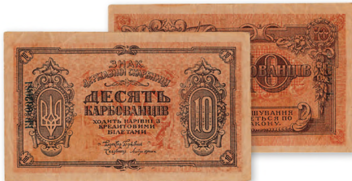
Украинская держава. Государственный казначейский знак. 10 карбованцев. 1918 г. 140x85 мм

Первые денежные знаки самостоятельного украинского правительства — карбованцы были выпущены еще в 1917 г. Они имели одинаковую со старыми романовскими рублями стоимость и несли на себе изображение нового герба Украины — трезубца с крестом.