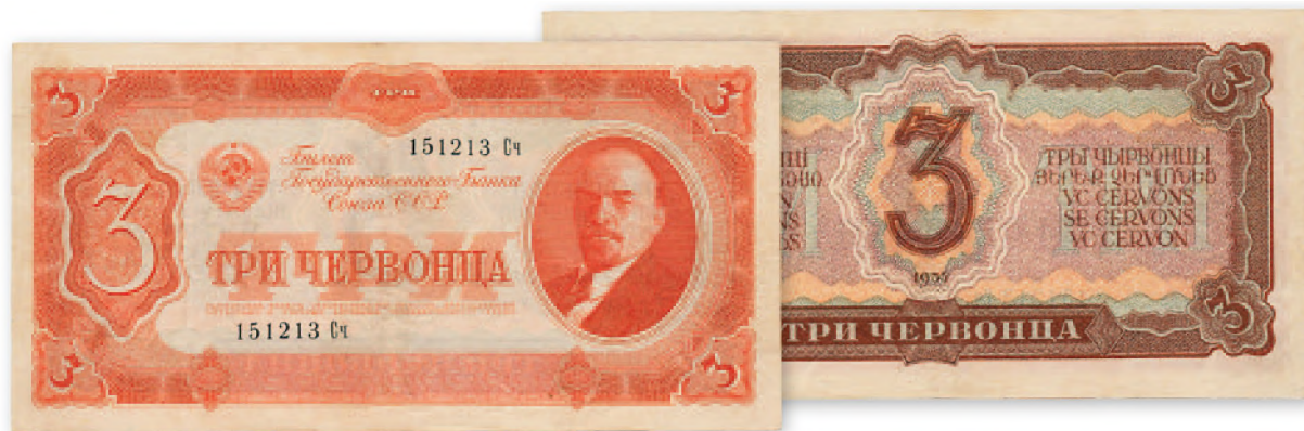
СССР. Билет Государственного банка. 3 червонца. 1937 г. 170x87 мм