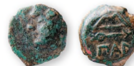
Пантикалей. Обол. Медь. 275-250 гг. до н. э. 15-16 мм