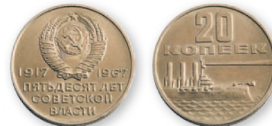
СССР. 20 копеек. Медно-никелевый сплав. 1967 г. 22 мм