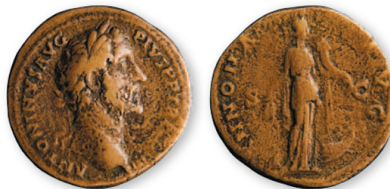
Рим. Антоний Пий. Сестерций. Аурихалк (латунь), 140-144 гг. н. э. 32 мм

В Риме наряду с обычными для того времени металлами — золотом, серебром и бронзой был распространен аурихалк («золотая медь») — более дорогой, чем бронза, сплав меди и цинка. Из него начиная с правления Августа (27 г. до н. э. -14 г. н. э.) чеканились сестерции (1/4 денария) и дупонды (1/8 денария).