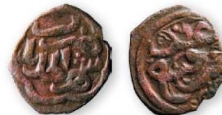
Золотая Орда. Анонимный пул. Шехр ал-Джедид. Медь. 60-е гг. XIV в. 17 мм