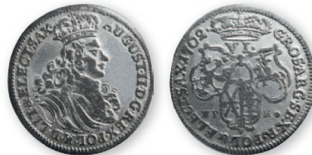
Речь Посполитая. Август II. Шестак (6 грошей). Лейпциг. Серебро. 1702 г. 26 мм