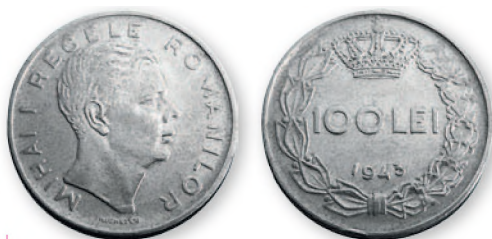
Королевство Румыния. Михай I. 100 леев. Никелированная сталь. 1943 г. 28 мм