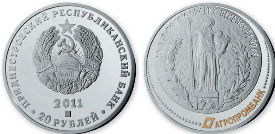
ПМР. 20 руб. «20 лет первому банку Приднестровья». Серебро, проба 925, позолота. 2011 г. 52 мм