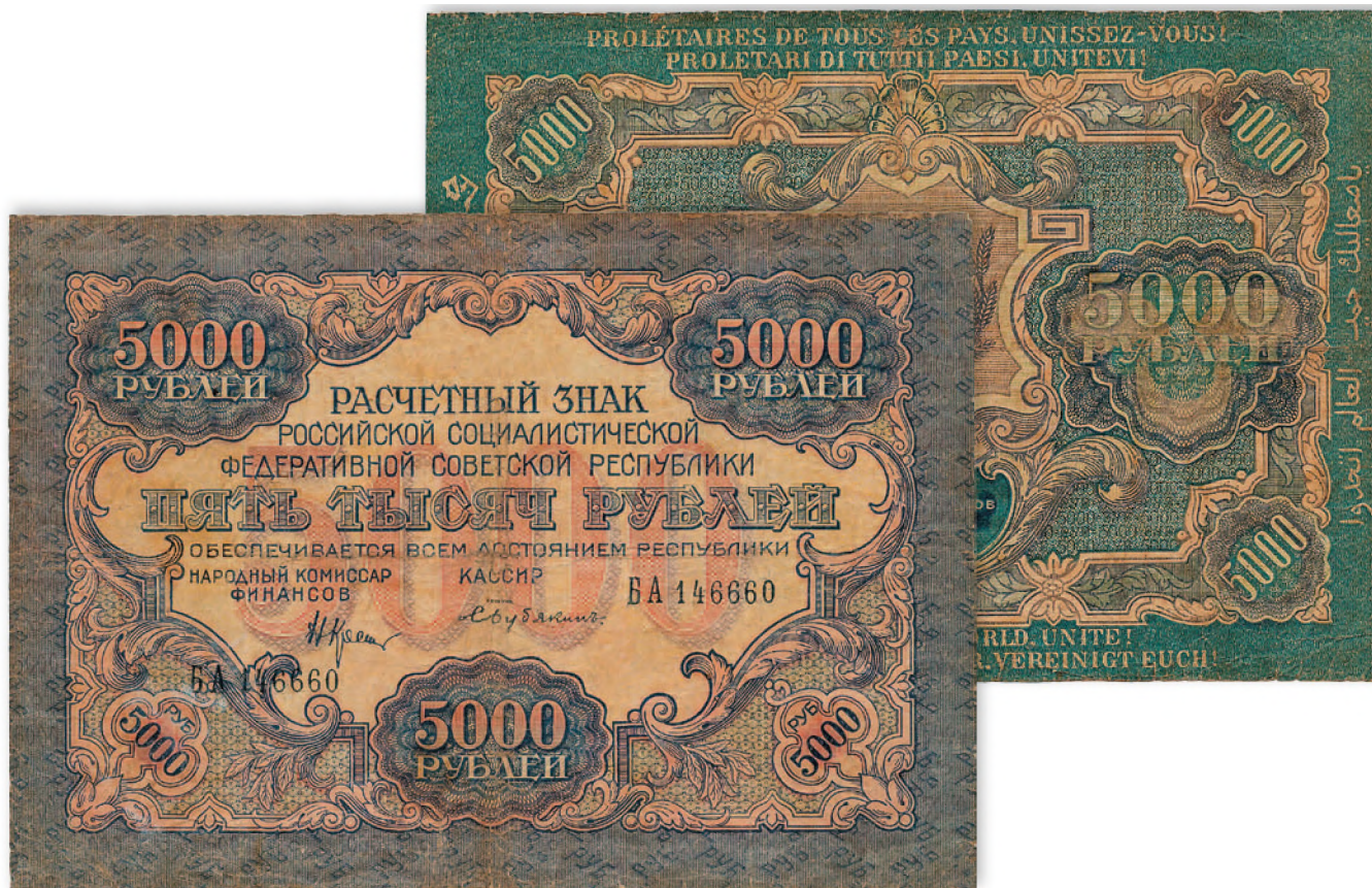
Расчетный знак РСФСР. 5000 руб. 1920 г. 165x117 мм