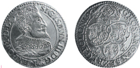
Речь Посполитая. Сигизмунд III Ваза. Шесть грошей. Мальборк. Серебро. 1596 г. 28 мм