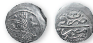
Османская империя. Махмуд I. Пара. Миср. Серебро. 1143 г. хиджры (1730 г.). 16 мм