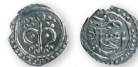
Золотая Орда. Фракция дирхема (?) с тамгой Ногая. Акча-Керман. Серебро. Предположительно 90-е гг. XIII в. 15 мм

Около 1291г. Ногай возвел на золотоордынский престол хана Токту, который спустя какое-то время вступил с ним в открытую борьбу, закончившуюся гибелью Ногая в 1300 г.