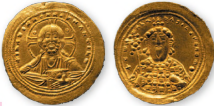
Византия. Константин VIII. Гистаменон номизма. Золото. 1025-1028 гг. 25,5 мм