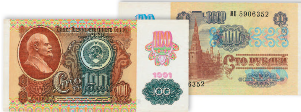
СССР. Билет Государственного банка. 100 руб. 1991 г. 144x71 мм