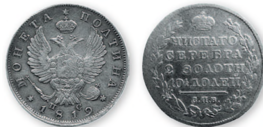
Александр I. Полтина. Серебро. 1819 г. 29 мм

Во время Отечественной войны для покрытия военных расходов правительство Александра I увеличило эмиссию ассигнаций и, соответственно, медных монет для их размена. Самым крупным номиналом медных монет тогда были 2 копейки, которые выпускались в гораздо большем количестве, чем другие номиналы. В 1812 г. только на Екатеринбургском монетном дворе было отчеканено свыше 130 млн двухкопеечников. Поэтому монеты Александра I в 2 коп., выпущенные с 1810 по 1825 г., являются самой распространенной в Приднестровье находкой русских денег XIX столетия.