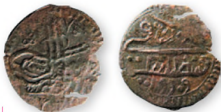
Местное подражание мангиру Сулеймана II. Медь. 18 мм

В период правления султана Сулеймана II (1687-1691) в обращение была введена крупная серебряная монета весом около 19 г — куруш , выполненная по образцу европейских талеров и призванная служить растущим требованиям денежного рынка Османского государства. Одновременно денежные рынки были наводнены медными мангирами , которые обращались по принудительному курсу 1/2 серебряного акче. Они использовались для обеспечения мелких расчетов и активно подделывались населением.