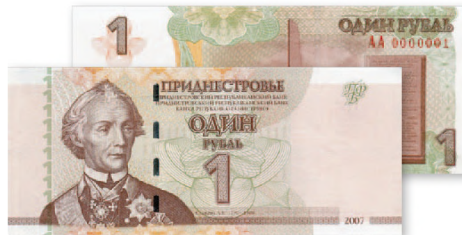
Билет Приднестровского Республиканского банка. 1 руб. образца 2007 г. 129x56 мм

С декабря 2007 г. в обращение вошли банкноты нового дизайна номиналом от 1 до 100 руб. Благодаря микротексту и «норяющей» металлизированной полоске возросла защищенность денежных знаков. Новые банкноты имеют параллельное хождение с купюрами образца 2000 г., которые постепенно, по мере износа, изымаются из оборота. Срок параллельного хождения денежных знаков образца 2000 и 2007 гг. не ограничен.