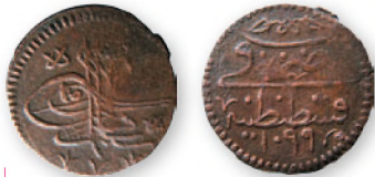
Османская империя. Сулейман II. Мангир. Константинополь. Медь. 1099 г. хиджры (1687 г.). 18 мм