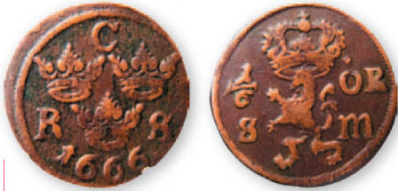
Швеция. Карл XI. 1/6 зр. Медь. 1666 г. 25 мм