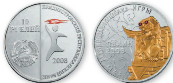
ПМР. 10 руб. «XXIX Олимпийские игры в Пекине». Серебро, проба 925, позолота, полудрагоценные камни. 2008 г. 32 мм