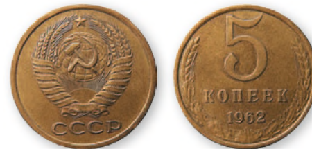
СССР. 5 копеек. Латунь. 1962 г. 25 мм

Введенные в 1961 г. монеты в 1, 2, 3 и 5 коп. чеканили из латуни, монеты в 50 коп. и 1 руб. (как и монеты в 10, 15 и 20 коп.)—из медно-никелевого сплава. Новые бумажные денежные знаки были представлены государственными казначейскими билетами в 1,3 и 5 руб. и билетами государственного банка в 10, 25,50 и 100 руб. Последние несли изображение Ленина, ставшего иконой Советского государства.