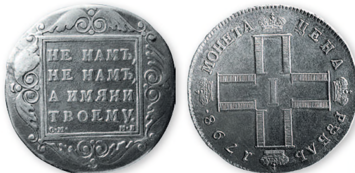
Павел I. Рубль. Серебро. 1798 г. 40 мм