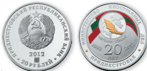
ПМР. 20 руб. «20-я годовщина образования Министерства иностранных дел ПМР». Серебро, проба 925, тампопечать, позолота. 2012 г. 32 мм