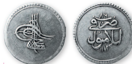
Османская империя. Мустафа III. Ирмилык (20 пара). Стамбул. Серебро. 1171 г. хиджры (1757 г.). 25 мм

Все османские монеты XVIII в. датированы. На них помещена дата арабскими цифрами по лунному мусульманскому календарю — хиджре (буквально - переселение). По преданию в 622 г. н. э. пророк Мухаммед бежал из Мекки в Медину. С этого времени начинается летоисчисление по хиджре. Счет ведется по лунным годам (354 дня в обычном и 355 — в високосном).