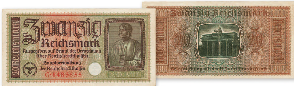
Германия. Билет Имперских кредитных касс. 20 рейхсмарок. 154x80 мм