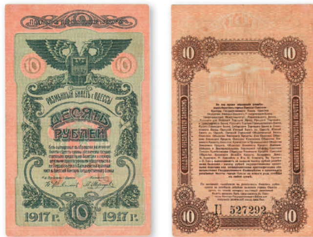
Разменный билет г. Одессы. 10 руб. 1917 г. 94x150 мм

Одесские деньги получили свободное хождение также в Николаеве, а затем почти во всей Херсонской губернии, включая Приднестровье. В самой Одессе местные боны 1917-1918 гг. предпочитали деньгам других правительств и продолжали пользоваться ими вплоть до оставления города белыми войсками в феврале 1920 г.