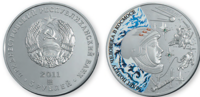
ПМР. 5 руб. «50 лет человека в космосе». Серебро, проба 925, тампопечать, полудрагоценные камни. 2011 г. 39 мм