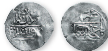
Крымское ханство. Арслан Гирей, первое правление. Бешлык. Бахчисарай. Серебро. 1161 г. хиджры (1748 г.). 19 мм