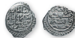
Османская империя. Сулейман I. Акче. Балья. Серебро. 926 г. хиджры (1520 г.). 12-13 мм

Для упрочения османской власти в регионе по приказу Сулеймана I была построена Бендерская крепость. Ее сооружение велось по проекту турецкого зодчего Ходжи Синана. Вплоть до начала XIX в. крепость служила важнейшим опорным пунктом османов в Приднестровье. Многовековое пребывание здесь турок оставило свой след, в том числе и в виде османских монет, большая часть которых найдена в Бендерах и их окрестностях.