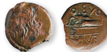
Ольвия. Борисфен. Медь. 260-250 гг. до н. э. 20 мм