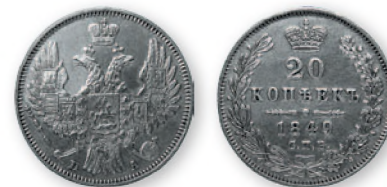
Николай I. 20 копеек. Серебро. 1849 г. 26 мм

Чеканка серебряных монет продолжалась по прежней пробе в 83 и 1/3 золотника. Выпускались серебряные монеты в 5, 10, 20, 25 коп., полтины, рубли, на лицевой стороне которых изображался двуглавый орел.