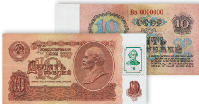
Билет Государственного банка СССР. 10 руб. образца 1961 г. с защитной маркой ПМР. 122x61 мм

В 1992 г., когда республики бывшего СССР стали вводить собственные денежные знаки, огромная масса советских денег хлынула на приднестровский рынок. Пытаясь защитить финансовую систему, правительство ПМР в июле 1993 г. приняло решение модифицировать советские банкноты путем наклеивания на них специальной марки. Эти зубцовые марки с указанием номинала купюры и портретом А. Суворова были отпечатаны на московском Гознаке.