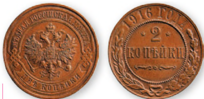
Николай II. 2 копейки. Медь. 1916 г. 23 мм