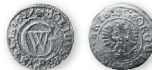
Пруссия (под властью Польши). Георг Вильгельм. Солид. Биллон. 1629 г. 16 мм

К началу XVII в. чеканка молдавской монеты вообще прекратилась и ненадолго возобновилась лишь в годы правления Еустратия Дабижы (1661-1665). Молдавская монета выпускалась по образцу европейских солидов. Молдавские шиллинги, или шалэу , имели низкую реальную стоимость и уже не могли составить конкуренцию иностранной монете, безраздельно господствовавшей на денежном рынке княжества.