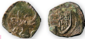
Молдавское княжество. Александр I Добрый. Полугрош. Бронза. 1430 г. 14-15 мм