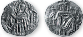
Болгария. Иван Александр. Грош. Тырново. Серебро. Предположительно 1355-1367 гг. 19 мм