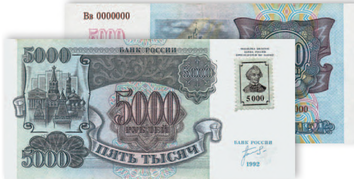
Билет Банка России. 5000 руб. образца 1992 г. с защитной маркой ПМР. 144x71 мм

Маркировке подлежали банковские билеты СССР номиналом от 10 до 1000 руб., выпущенные в 1991-1992 гг., а также появившиеся в 1992 г. билеты Банка России достоинством в 5000 и 10 000 руб. Недостаток банкнот сделал обычной практикой наклеивания марки с номиналом в 5000 руб. на советскую пятирублевую купюру, таким образом ее номинал сразу увеличивался в 1000 раз.