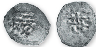
Крымское ханство. Селим II Гирей. Бешлык. Бахчисарай. Серебро. 1156 г. хиджры (1743 г.). 18-21 мм

Неказистые, зачастую неполноценные крымские монеты последних десятилетий существования государства Гиреев не могли пользоваться большим доверием у населения нашего региона. Очевидно, они мало участвовали в торговом обороте, а попадали сюда по пути во время многочисленных походов крымчаков.