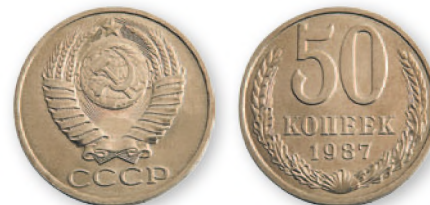
СССР. 50 копеек. Медно-никелевый сплав. 1987 г. 24 мм