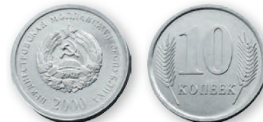
ПМР. 10 коп. Алюминиевый сплав. 2000 г. 20 мм