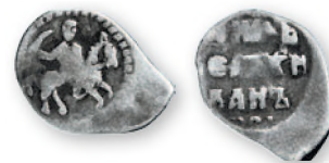
Иван IV Грозный. Копейка (сабельная). Москва. Серебро. 1535-1538 гг. 15-18 мм

Потерявшая в весе русская копейка XVII в. уже не представляла интереса для местного денежного рынка и в таком виде просуществовала вплоть до начала XVIII в.