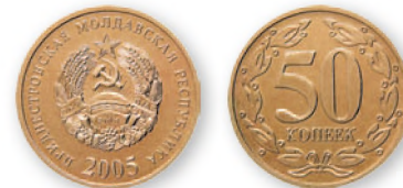
ПМР. 50 коп. Сталь, плакированная медно-цинковым сплавом. 2005 г. 19 мм