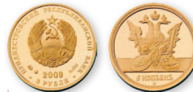
ПМР. 3 руб. «5 копеек». Золото, проба 999.2009 г. 21 мм