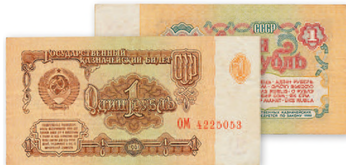
СССР. Государственный казначейский билет. 1 руб. 1961 г. 105x53 мм