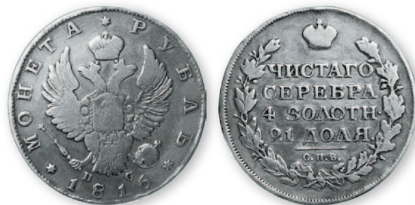
Александр I. Рубль. Серебро. 1816 г. 35 мм