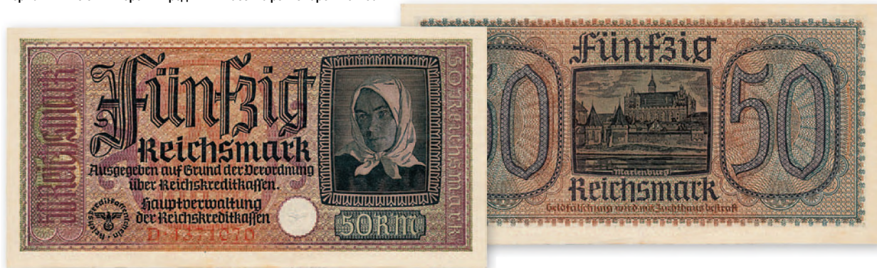
Германия. Билет Имперских кредитных касс. 50 рейхсмарок. 170x86 мм