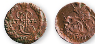
Екатерина II. Полушка. Медь. 1771 г. 17 мм

В начале очередной русско-турецкой войны 1768-1774 гг. русские войска перешли Днестр и заняли Дунайские княжества — Молдавию и Валахию. Командующий армией П. А. Румянцев в целях обеспечения войск принял решение о выпуске особой монеты с двойным обозначением—русским и турецким, получившей название « русско-молдавской ».