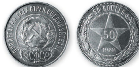
РСФСР. 50 копеек. Серебро. 1922 г. 27 мм