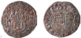
Фальшивая монета по образцу венгерского денария Фердинанда 11555 г. Посеребренная медь. 15 мм