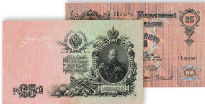
Государственный казначейский билет. 25 руб. образца 1909 г. 178x108 мм