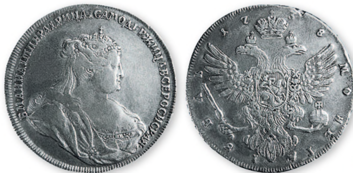
Анна Иоанновна. Рубль. Серебро. 1738 г. 41 мм