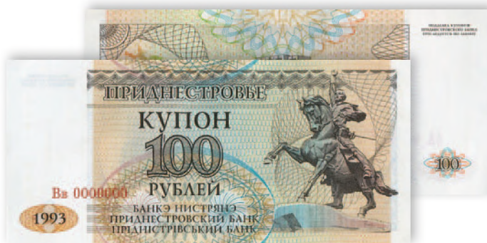
Купон Приднестровского Республиканского банка. 100 руб. образца 1993 г. 125x57 мм