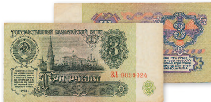
СССР. Государственный казначейский билет. 3 руб. 1961 г. 114x57 мм