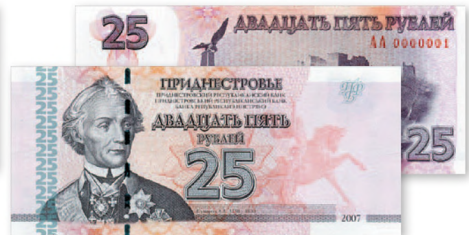
Билет Приднестровского Республиканского банка. 25 руб. образца 2007 г. 129x56 мм