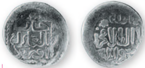
Золотая Орда. Узбек. Данг. Крым. Серебро. 713 г. хиджры (1313/1314 гг.). 16 мм