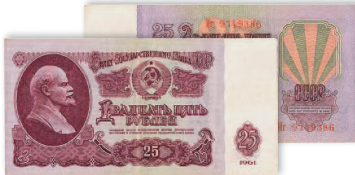
СССР. Билет Государственного банка. 25 руб. 1961 г. 122x61 мм