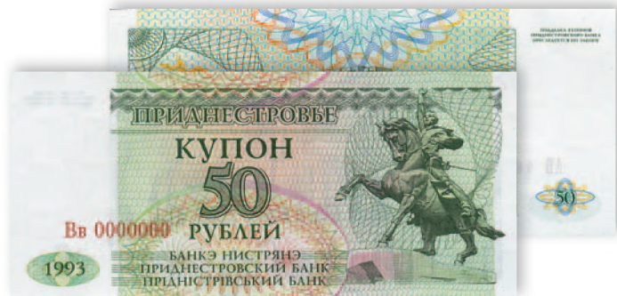
Купон Приднестровского Республиканского банка. 50 руб. образца 1993 г. 125x57 мм