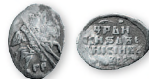
Иван IV Грозный. Копейка. Псков. Серебро. 1547 г. 15-18 мм