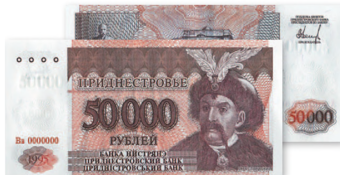
Денежный знак Приднестровского Республиканского банка. 50 000 руб. образца 1995 г. (использовался номиналом 500000 руб.) 129x62 мм