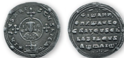
Византия. Иоанн I Цимисхий. Милиарисий. Серебро. 969-976 гг. 23 мм