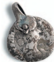
Подвеска, сделанная из римского денария Фаустины II из сарматского погребения. Серебро. II в. н. э.