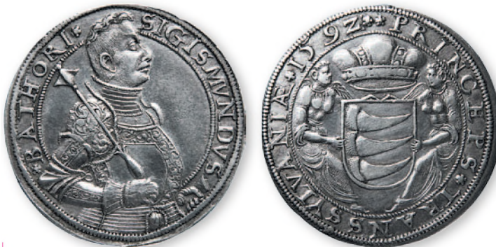
Княжество Трансильвания. Сигизмунд Баторий. Талер. Серебро. 1592 г. 41 мм

Характер денежного обращения Приднестровья во второй половине XVIII в. отражает состав клада, найденного в 1959 г. на западной окраине с. Карагаш Слободзейского района. Он содержал несколько сотен серебряных монет, чеканившихся различными государствами в течение значительного периода — около 200 лет. Наиболее ранняя монета датирована 1568 г., а самая поздняя — 1763 г. Было обнаружено много крупных турецких монет— курушей и алтмышлыков (60 пара), чеканившихся с конца XVII до третьей четверти XVIII в., а также крупных талерных монет Соединенных провинций Голландии и других территорий Священной Римской империи (XVII в.) и Австрии (XVIII в.).