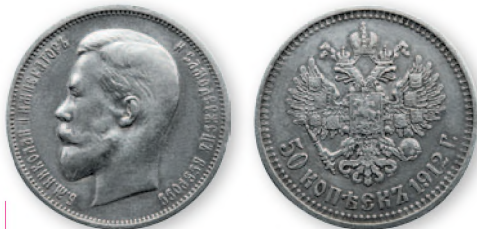
Николай II. 50 копеек. Серебро. 1912 г. 27 мм