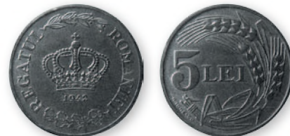
Королевство Румыния. Михай I. 5 леев. Цинк. 1942 г. 23 мм