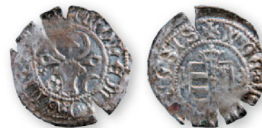
Молдавское княжество. Ильяш I. Полтора гроша, тип 1432 г. Серебро. 21 мм

Наследники Стефана Великого продолжают чеканку монеты, однако ее качество заметно ухудшается. Теперь молдавская монета больше выступает как символ новой власти, а не как экономический гарант надежности финансовой системы государства. Это приводит к вытеснению ее из денежного обращения региона более полноценной привозной серебряной монетой.