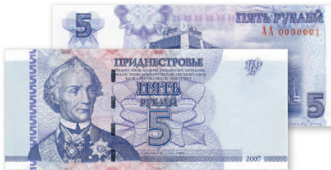
Билет Приднестровского Республиканского банка. 5 руб. образца 2007 г. 129x56 мм