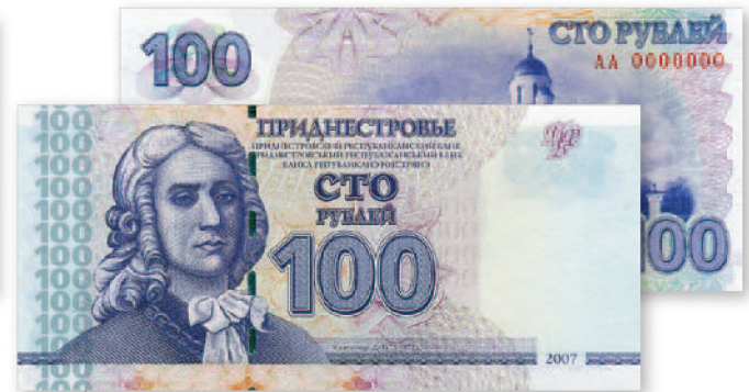
Билет Приднестровского Республиканского банка. 100 руб. образца 2007 г. 129x60 мм