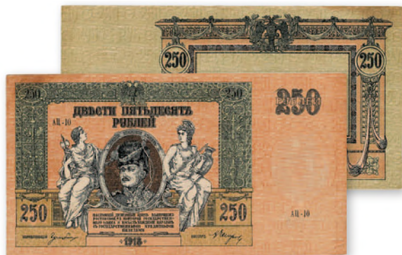
Денежный знак Ростовской-на-Дону конторы Госбанка. 250 руб. образца 1918 г. 183x98 мм