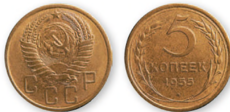
СССР. 5 копеек. Алюминиевая бронза. 1955 г. 25 мм

Пытаясь спасти свою наличность, граждане Страны Советов бросились скупать промышленные и продовольственные товары. Однако государство сумело присвоить значимую часть «излишних» накоплений населения.