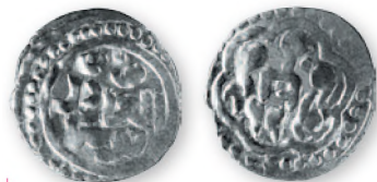
Золотая Орда. Токта. Дирхем. Крым. Серебро. 690 г. хиджры (1291 г.) 19 мм

В 40-е гг. XIII столетия наш регион вошел в состав Улуса Джучи — государственного образования, включавшего огромную территорию от северной части Болгарии до Иртыша. Немногочисленное население края стало пополняться переселенцами из разных районов Золотой Орды, сложившейся в центральной и западной частях Улуса Джучи. Поднестрие, находясь на самом западе государства Джучидов, начало втягиваться в его экономику, и после длительного перерыва здесь возобновилось денежное обращение. Его основу составляли серебряные дирхемы (позже данги ) и медные пулы.