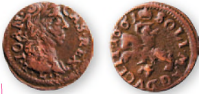
Речь Посполитая. Ян II Казимир Ваза. Солид (боратинка). Вильно. Медь. 1661 г. 16 мм