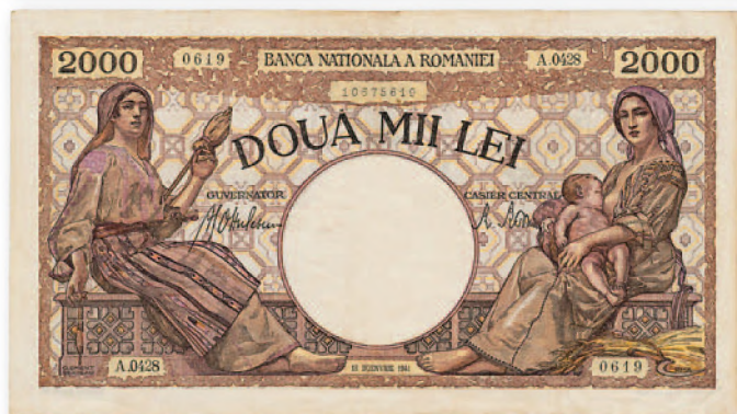
Билет Национального банка Румынии. 2000 леев образца 10 сентября 1941 г. 202x112 мм