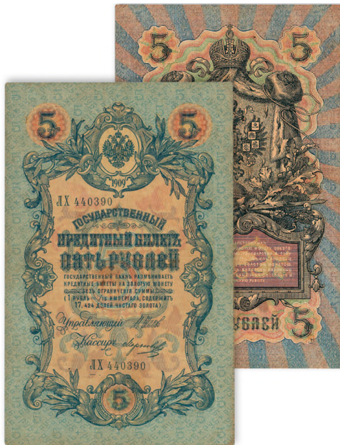
Государственный казначейский билет. 5 руб. образца 1909 г. 98x157 мм

В 1915 г. были выпущены марки достоинством в 10, 15 и 20 коп. Для их изготовления использовалось клише почтовых марок юбилейной серии, посвященной 300-летию дома Романовых, с изображением российских императоров. На обороте печатался герб Российской империи и текст: «Имѣть хожденіе наравнѣ съ размѣнной серебряной монетой». В 1916 г. дополнительно были выпущены марки мелких номиналов—в 1,2 и 3 коп.