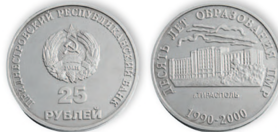
Приднестровский Республиканский банк. 25 руб. Медно-никелевый сплав. 2000 г. 31 мм

Стабильный приднестровский рубль стал основой укрепившейся финансовой системы республики.