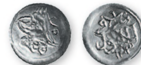
Османская империя. Селим III. Пара. Стамбул. Серебро. 1203 г. хиджры (1789 г.). 15 мм