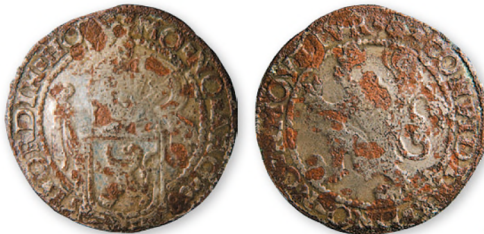
Фальшивая монета по образцу левендаальдера. Посеребренная медь. 40 мм