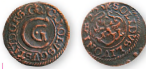
Прибалтийские владения Швеции. Карл X Густав. Ливония. Солид. Биллон. 1655 г. 16 мм

Ко второй трети XVII в. денежный рынок региона наводнила мелкая биллоновая монета, чеканившаяся Швецией на захваченных ею землях в Прибалтике. Шведские шиллинги, выпускавшиеся в Эльблонге, Риге, Ливонии от имени Густава II Адольфа (1621-1632), Кристины Августы (1632-1654) и других шведских правителей широко использовались местными жителями для повседневных расчетов.