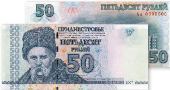
Билет Приднестровского Республиканского банка. 50 руб. образца 2007 г. 129x60 мм