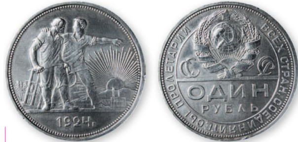
СССР. Рубль. Серебро. 1924 г. 34 мм