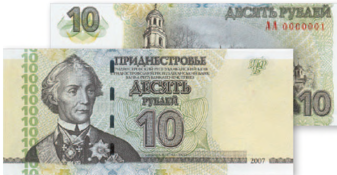
Билет Приднестровского Республиканского банка. 10 руб. образца 2007 г. 129x56 мм