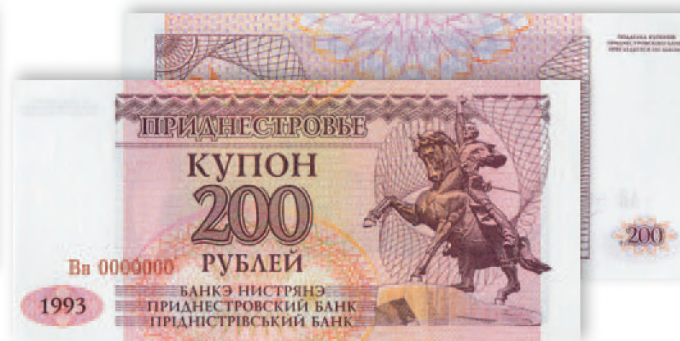
Купон Приднестровского Республиканского банка. 200 руб. образца 1993 г. 125x57 мм