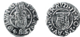
Священная Римская империя. Королевство Венгрия. Рудольф II. Денарий. Серебро. 1584 г. 15 мм