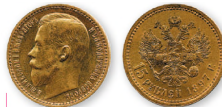
Николай II. 15 рублей. Золото. 1897 г. 24,5 мм

В самом начале правления Николая II министр финансов С. Ю. Витте провел денежную реформу (1895-1897 гг.), которая была направлена на усиление национальной валюты, обеспеченной золотом. Основой денежной системы страны стала золотая монета. Установился свободный обмен кредитных билетов на золотую монету из расчета один бумажный рубль за один рубль в золоте. Возникла необходимость в чеканке новых золотых монет. Потребность в монете была столь высока, что часть заказов пришлось передать Парижскому и Брюссельскому монетным дворам. Чеканились золотые монеты основных номиналов — в 5 и 10 руб. Кроме того, были выпущены монеты достоинством в 7,5, 15 и 25 руб. и монета в 100 франков, что соответствовало 37,5 руб.