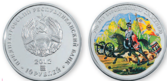
ПМР. 10 руб. «200 лет Бородинскому сражению». Серебро, проба 925, тампопечать. 2012 г. 32 мм

Практика денежного обращения в нашем крае прошла большой эволюционный путь длиной почти в две с половиной тысячи лет от использования денег-товаров до современного периода широкого применения электронных денег.