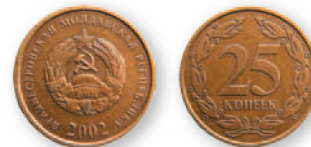
ПМР. 25 коп. Медно-цинковый сплав. 2002 г. 17 мм