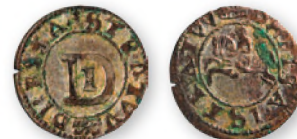
Молдавское княжество. Еустратие Дабижа. Солид (шалэу). Посеребренная медь. 1661-1665 гг. 16 мм