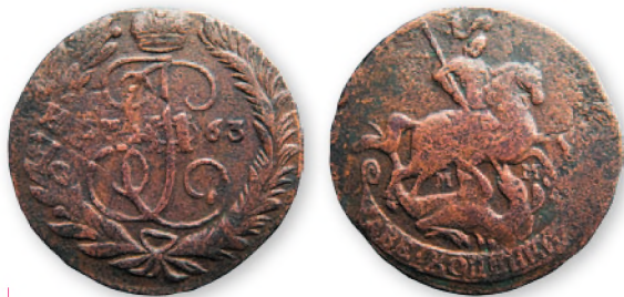
Екатерина II. 2 копейки. Перечекан из 4 коп. Петра III. Медь. 1763 г. 32 мм