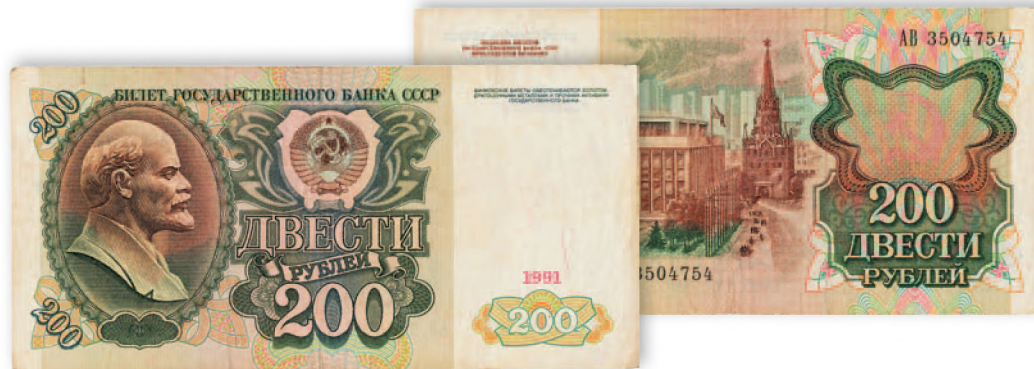
СССР. Билет Государственного Банка. 200 руб. 1991 г. 144x71 мм