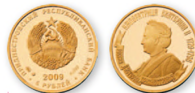
ПМР. 5 руб. «Екатерина II». Золото, проба 999.2009 г. 21 мм