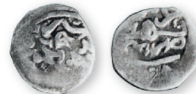
Османская империя. Мехмед IV. Пара. Миср. Серебро. 1058 г. хиджры (1648 г.). 13-14 мм