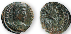
Римская империя. Констанций II Август. АЕ 3. Бронза. 337-361 гг. н. э. 17 мм