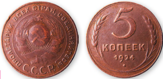
СССР. 5 копеек. Медь. 1924 г. 32 мм