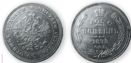
Александр II. 25 копеек. Серебро. 1878 г. 24 мм

С 1860 г., в период правления Александра II, увеличился выпуск разменной серебряной монеты (5, 10, 15 и 20 коп.) за счет уменьшения на 15% доли серебра в ней. В высокопробных серебряных монетах крупных номиналов, называвшихся банковыми, содержание драгоценного металла оставалось прежним.