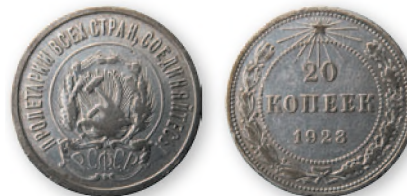
РСФСР. 20 копеек. Серебро. 1923 г. 23 мм

Разменную серебряную монету чеканили вплоть до 1931 г., когда новая экономическая политика окончательно сошла на нет.