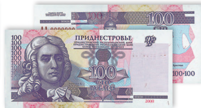
Билет Приднестровского Республиканского банка. 100 руб. образца 2000 г. 129x60 мм