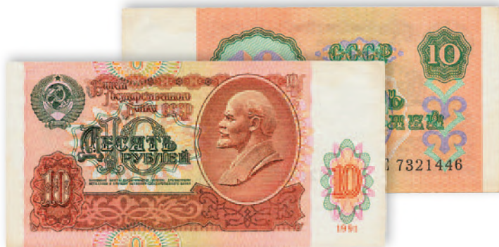
СССР. Билет Государственного банка. 10 руб. 1991 г. 124x62 мм

Растущая инфляция вынудила правительство начать выпуск банкнот более крупных номиналов в 200,500 и 1000 руб.