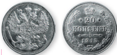
Николай II. 20 копеек. Серебро. 1915 г. 22 мм