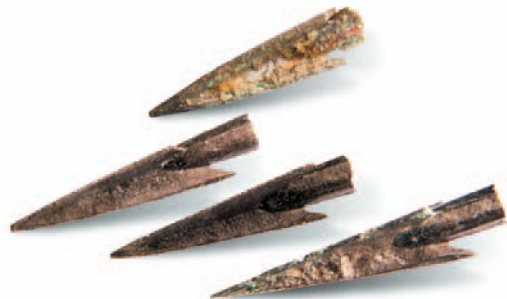
Скифские наконечники стрел. Бронза. Вторая половина IV в. до н. э.

Ольвийские дельфины широко встречаются среди находок в Северо-Западном Причерноморье.