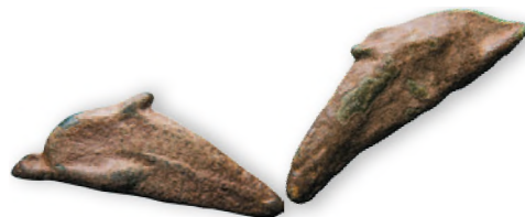
Ольвия. Дельфины (1/10 оболы). Бронза. V—IV вв. до н. э.