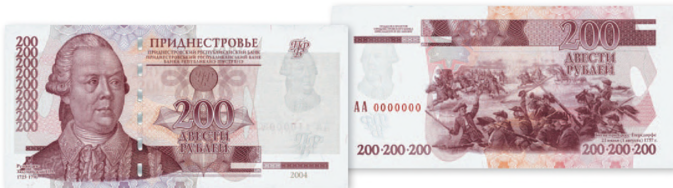
Билет Приднестровского Республиканского банка. 200 руб. образца 2004 г. 135x64 мм