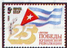
5465. 5 к.— Государственный флаг Республики Куба и памятный текст, украшенный лавровой ветвью Славы — многоцветная . . . . . —05 —02 Т и р а ж 3,5.