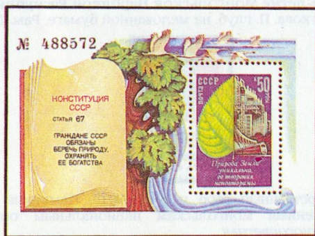
Рисунок Ю. Левиновского. Офсет на мелованной бумаге. Рам. 12 1 / 2 : 12. Размер 9x6,5 см.

5581. 50 к.— На марке в блоке — лист липы, символизирующий окружающую нас природу. Левая часть его естественна, не занята человеческой деятельностью, правая представляет собой индустриальную панораму. Текст: «Природа Земли уникальна, ее творения неповторимы».