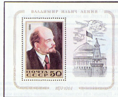
Рисунок И. Мартынова. Офсет на мелованной бумаге с лаковым покрытием. Рам. 11 1 / 2 :12 1 / 2 .

5500. 50 к.— На марке — портрет В. И. Ленина по картине Е. Широкова «Встреча В. И. Ленина с членами Исполкома IV конгресса Коминтерна» (фрагмент, подлинник в ЦМЛ).