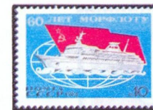
Рисунок Т. Панченко. Гравюра на металле М. Сильяновой. П. глуб. в сочетании с металлографией на мелованной бумаге. Рам. 11 1 / 2 .

5524. 10 к.— Пассажирское судно на фоне Государственного флага СССР, условного изображения земного шара и стилизованных морских волн — многоцветная . . . —10 —03