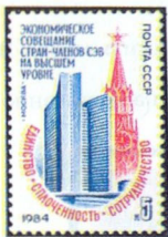
Рисунок Ю. Бронфенбренера. П. глуб. на мелованной бумаге. Рам. 11 1 / 2 .

5516. 5 к.— Спасская башня (см. 5510) Московского Кремля и здание СЭВ (1969, архитекторы М. Посохин, А. Мндоянц, В. Свирский, инженеры Ю. Рацкевич, С. Школьников и др.) в Москве. Надпись: «Единство. Сплоченность. Сотрудничество». Памятный текст — красная и синяя . . . . . —05 —02