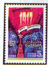
Рисунок С. Горлицева. Гравюра на металле В. Стариковского. П. глуб. в сочетании с металлогравией на мелованной бумаге. Рам. 11 1 / 2 .

1984. Октябрь, 23. 67-я годовщина Великой Октябрьской социалистической революции.