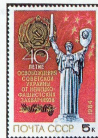
Рисунок И. Козлова. П. глуб. на мелованной бумаге. Рам. 12:11 1 / 2 .

1984. Октябрь, 8. 40-летие освобождения Украинской ССР от немецко-фашистских захватчиков.