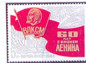
Рисунок Ю. Левиновского. П. глуб. на мелованной бумаге. Рам. 11 1 / 2 :12.

5523. 5 к.— Нагрудный комсомольский значок на развевающемся красном полотнище. На втором изобразительном плане — панорама тех отраслей народного хозяйства, науки и техники, исследования и освоения космического пространства, в которых Ленинский комсомол принимал и принимает сейчас активное участие — многоцветная . . . —10 —02