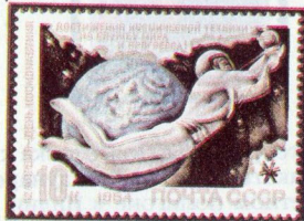
Рисунок Ю. Арцименева. П. глуб. на мелованной бумаге. Рам. 11 1 / 2 :12.

5495. 10 к.— Символический образ человека, устремленного в космос, с первым советским искусственным спутником Земли (запущен 4.10.1957) в руках. Фоновое изображение — Земля и сопредельное космическое пространство. Текст: «Достижения космической техники — на службу мира и прогресса!» — многоцветная . . . . . —10 —03