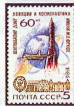
Рисунок И. Мартынова. Гравюра на металле О. Ключковой. П. глуб. в сочетании с металлогравией на мелованной бумаге. Рам. 11 1 / 2 .

1984. Ноябрь, 6. 60-летие Центрального дома авиации и космонавтики имени М. В. Фрунзе*.