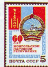
Рисунок Ю. Косорукова. П. глуб. на мелованной бумаге. Рам. 11½.

1984. Ноябрь, 26. 60-летие Монгольской Народной Республики.