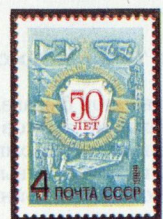
5464. 4 к.— Памятный текст на картуше* и вокруг него. Интерьер** современной радиотрансляционной станции, линия радиопередачи, старые и современные уличные репродукторы. Стилизованное изображение эмблемы связи СССР и башни Московского Кремля — многоцветная . . . . . —04 —02 Т и р а ж 3,6.