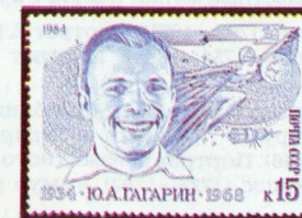
Рисунок Г. Комлева. Гравюра на металле М. Сильяновой. Металлография на мелованной бумаге. Греб. 12 1 / 2 :12.

1984. Март, 9. 50-летие со дня рождения Ю. А. Гагарина (1934—1968).