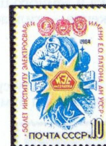
Рисунок Ю. Бронфенбренера. П. глуб. на мелованной бумаге. Рам. 11 1 / 2 .

1984. Май, 15. 50-летие Института электросварки имени Е. О. Патона Академии наук УССР.