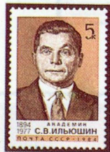
Рисунок П. Бенделя. П. глуп. на мелованной бумаге. Рам. 11 1 / 2 .

1984. Март, 23. 90-летие со дня рождения С. В. Ильюшина (1894—1977).