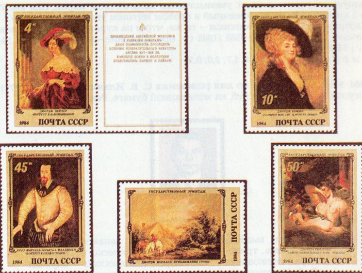
ПОЧТОВЫЙ БЛОК Размер 14,5x8 см.