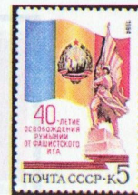
Рисунок А. Аксамита. Офсет на мелованной бумаге. Греб. 12 : 12 1 / 2 .

1984. Август, 23. 40-летие освобождения Румынии от фашистского ига.