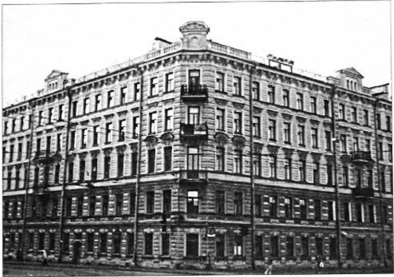
Лиговский пр., 19. Фото 1997 г.