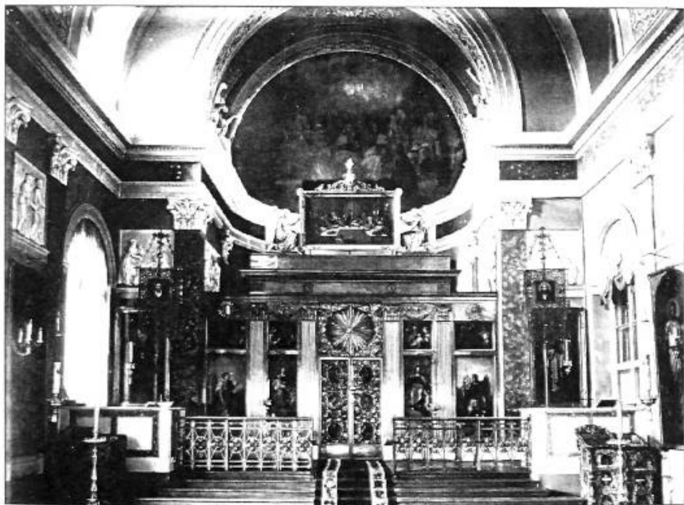
Внутреннее убранство, вид на иконостас. Фото 1914-1917 гг.