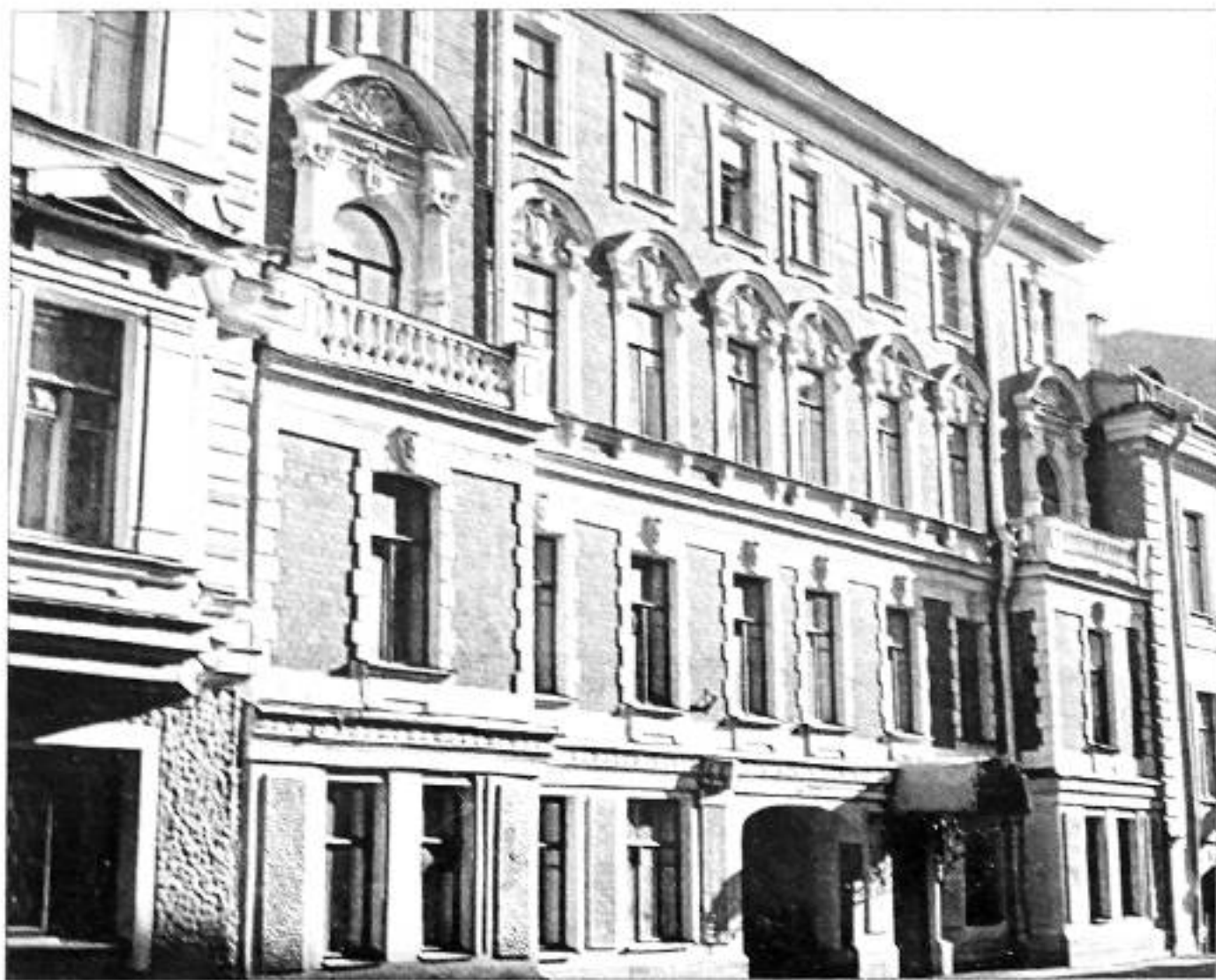
Фото 1997 г.

Вскоре после свадьбы, в конце 1901 года, семья Рерихов переехала с Васильевского острова на Галерную улицу в дом № 44, в квартиру под № 5 на 2-м этаже.