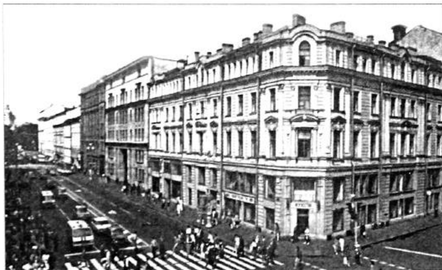
Невский пр., 16. Фото 1980-х гг.