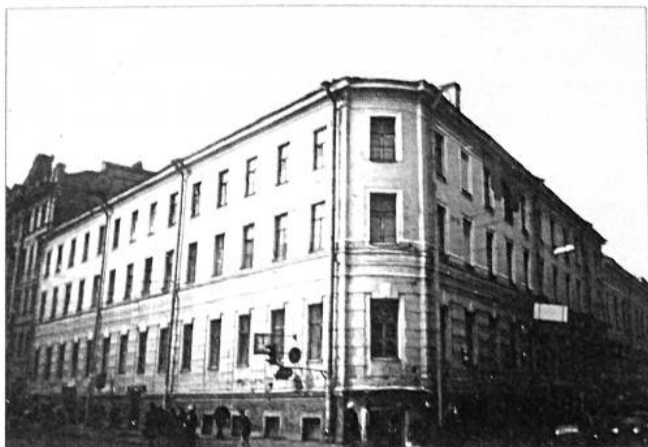
Загородный пр., 13. Фото 1998 г.

и Чернышова переулка, д. 11, у Пяти углов. Дом был построен в 1857-1858 годах по проекту архитектора П.С. Пименова.