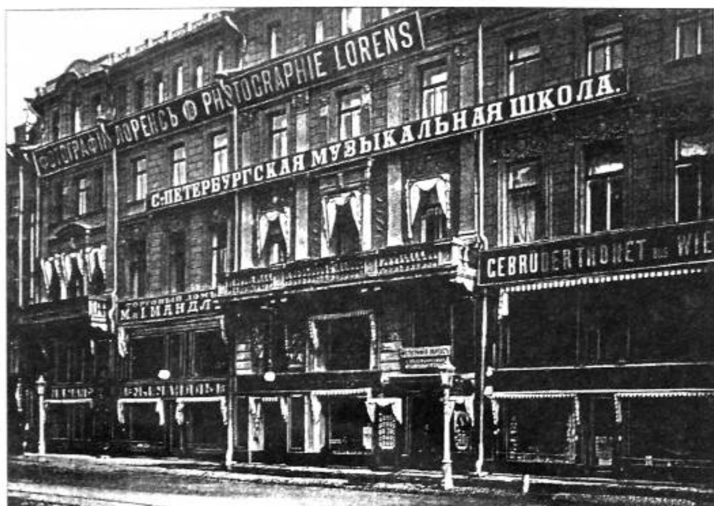
Невский пр., 16. Фото нач. XX в.