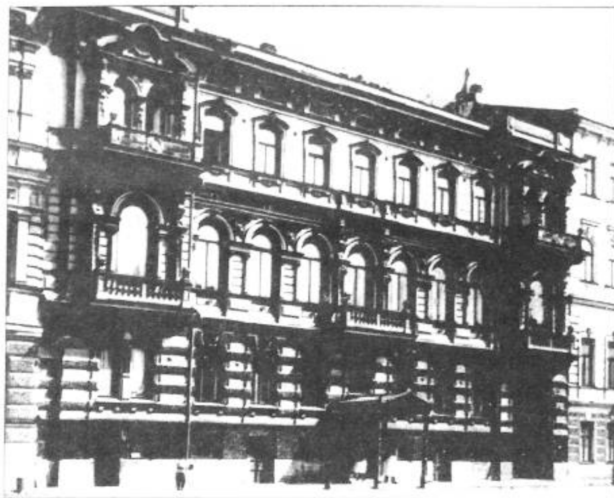
Сергиевская ул., 16. Фото кон. XIX в.