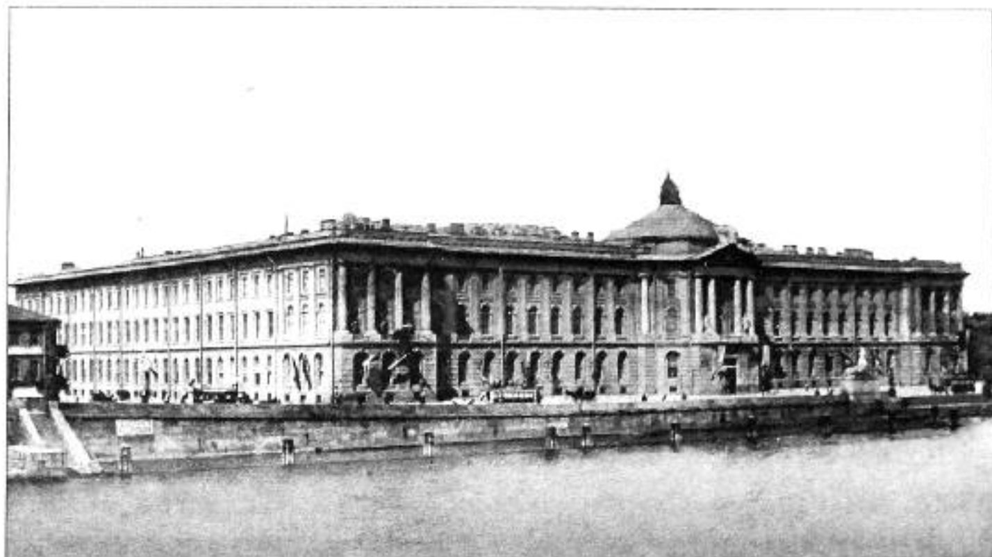
Открытка нач. XX в.

Академия художеств была учреждена решением Сената в 1757 году по инициативе выдающихся деятелей России – ученого М.В. Ломоносова и графа И.И. Шувалова; Устав и Привилегии утверждены в 1764 году при императрице Екатерине II. В 1764-1788 годах на участке между 3-й и 4-й линиями Васильевского острова, вдоль набережной реки Невы, было построено величественное здание, предназначенное для «Академии трех знатнейших художеств». Авторами проекта были профессора-архитекторы Ж.-Б. Валлен-Деламот и А.Ф. Кокоринов. В 1832-1834 годах перед главным входом в Академию архитектором К.А. Тоном сооружена каменная пристань с двумя сфинксами по сторонам. Во второй половине XIX – начале XX века по проектам архитекторов А.И. Резанова, Ф.И. Эппингера, Л.Н. Бенуа, В.А. Щуко была изменена отделка помещений в здании. Ныне в стенах Академии (Университетская наб., д.17) находится Институт живописи, скульптуры и архитектуры им. И.Е. Репина, Научная библиотека и Научно-исследовательский музей Академии художеств.