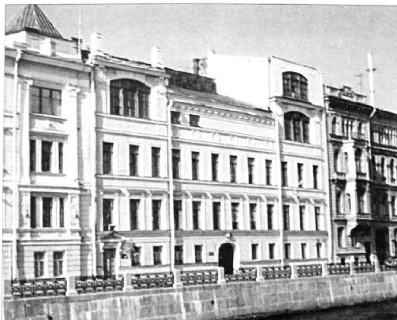
Набережная реки Мойки, д. 83. Фото 1997 г.

ром Рисовальной школы ИОПХ и вместе с семьей переехал на новую квартиру, которая находилась на втором этаже в здании Общества, на Большой Морской ул., 38. Вход в квартиру был со стороны набережной Мойки, дом № 83, но можно было пройти и со стороны Большой Морской улицы, мимо выставочных залов.