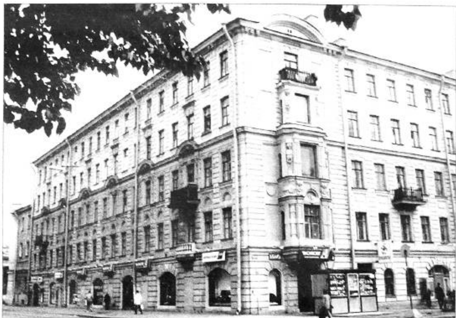
Разъезжая ул., 23. Фото 1998 г.

В 1884 (?) году Шапошниковы переезжают в доходный дом на углу Разъезжей ул., 23 и Ямской ул., 30, в квартиру под № 16.