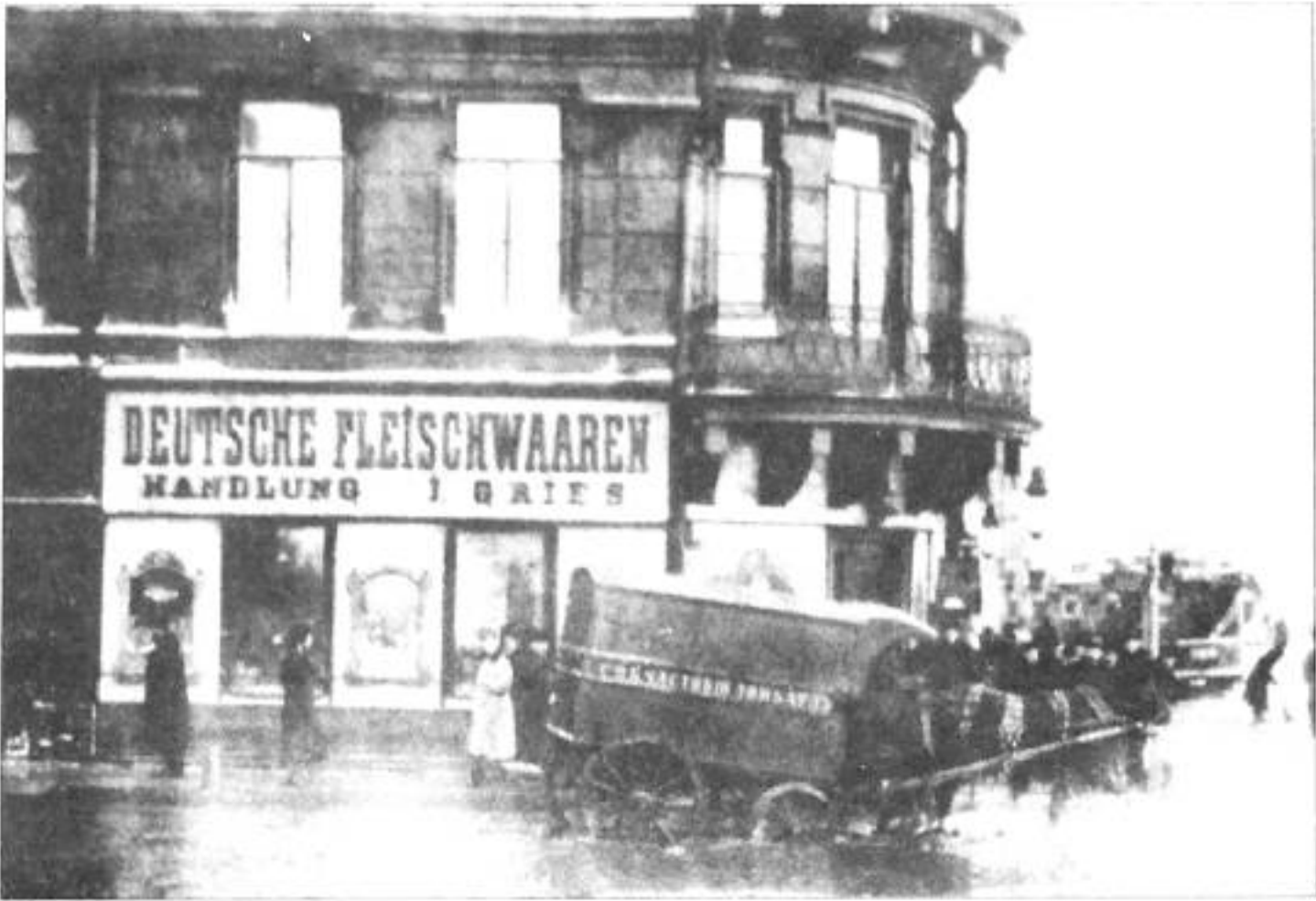
Университетская наб., 25/1. Открытка нач. XX в. (на 2-м этаже квартира, где жили Рерихи).