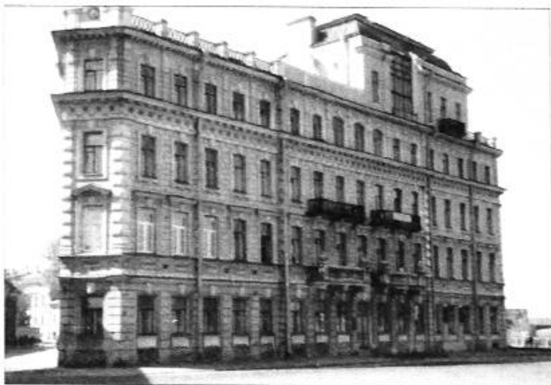
Биржевой пер., 1/10. Фото 1998 г.