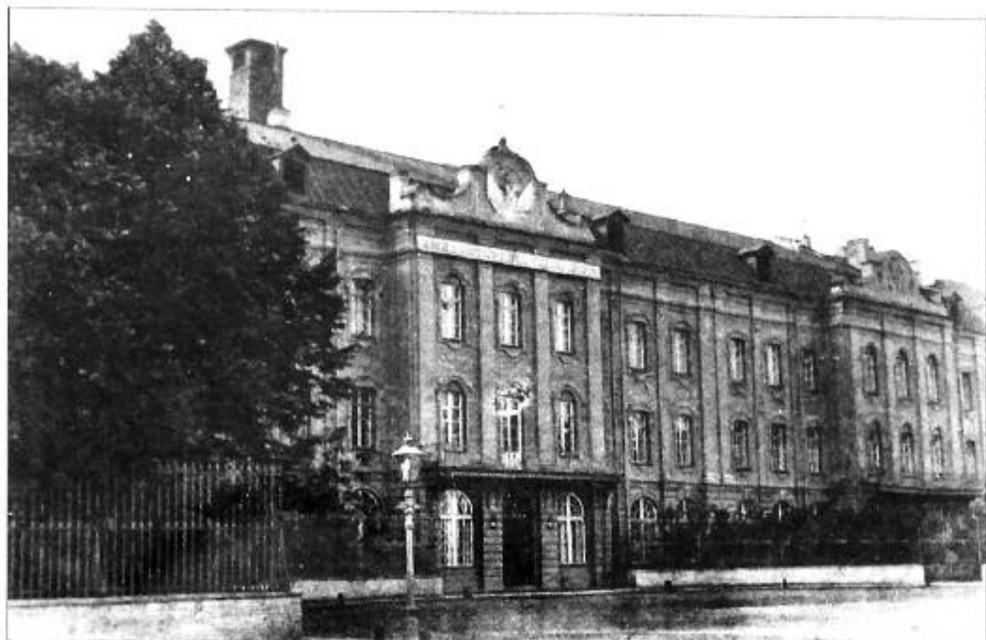
Императорский Университет. Открытка нач. XX в.

Н.К. Рерих был зачислен в Императорский С.-Петербургский университет на юридический факультет. Параллельно он слушал лекции на историко-филологическом факультете.