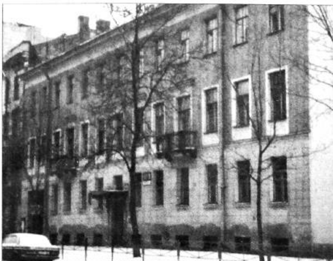
10 линия, 13. Фото 1997 г.

В 1856 году по инициативе нескольких немецких предпринимателей на 1-й линии Васильевского острова была открыта частная мужская школа. Возглавил ее педагог-практик Карл Иванович Май, который избрал в качестве основного девиза изречение основоположника современной педагогики Яна Амоса Коменского: «Сперва любить – потом учить», в соответствии с которым был создан коллектив педагогов, состоящий из людей с высокими нравственными и профессиональными качествами. В дальнейшем школа получила название «Гимназия и реальное училище К. Мая», а ученики и педагоги школы стали называть себя «Майскими жуками».