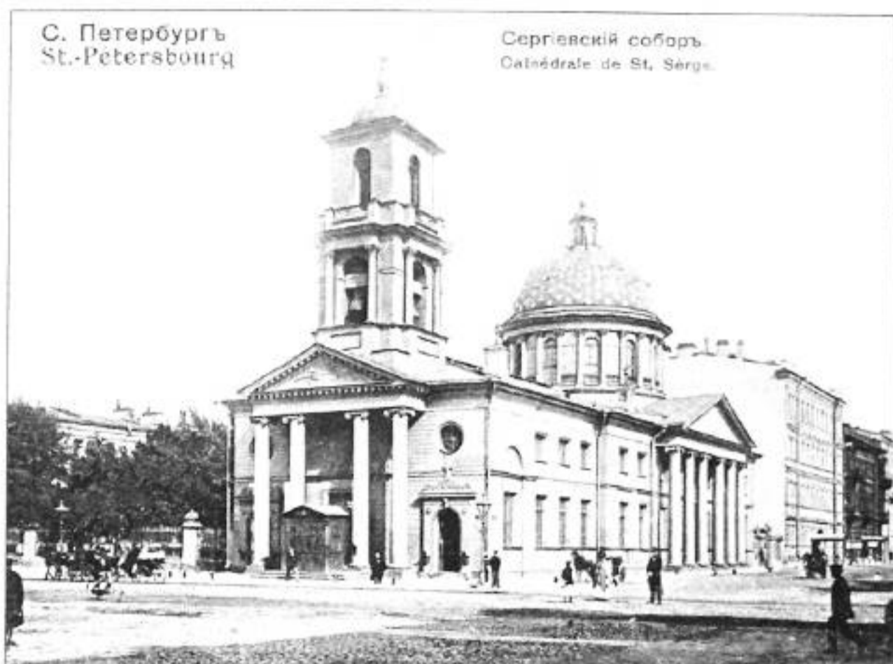
Сергиевский всей Артиллерии собор. Открытка нач. XX в.