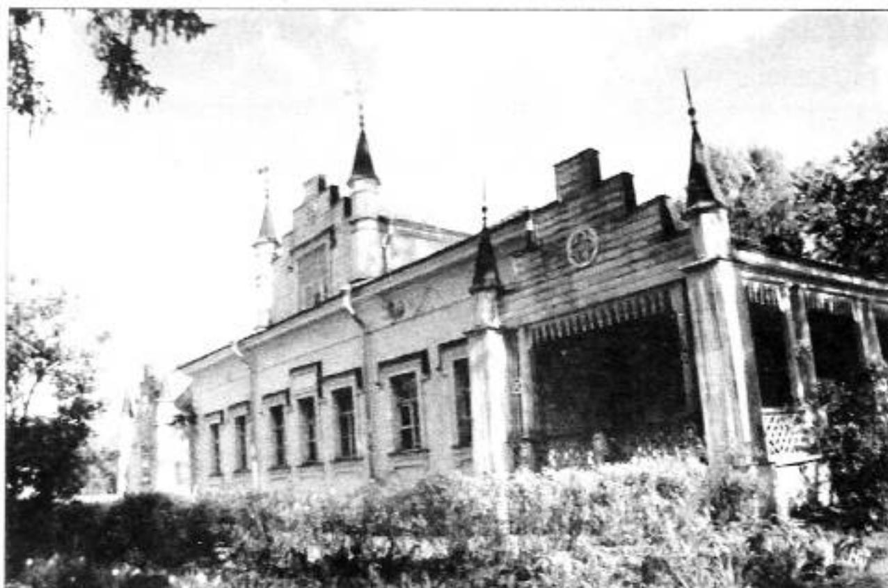
Извара. Музей-усадьба Н.К. Рериха. Фото 2002 г.

Более двадцати лет жизни художника Н.К. Рериха было связано с именем его родителей в деревне Извара. «Двух лет не было, а памятки связались с Изварою, с лесистым помещьем около станции Волосово, в сорока верстах от Гатчины.