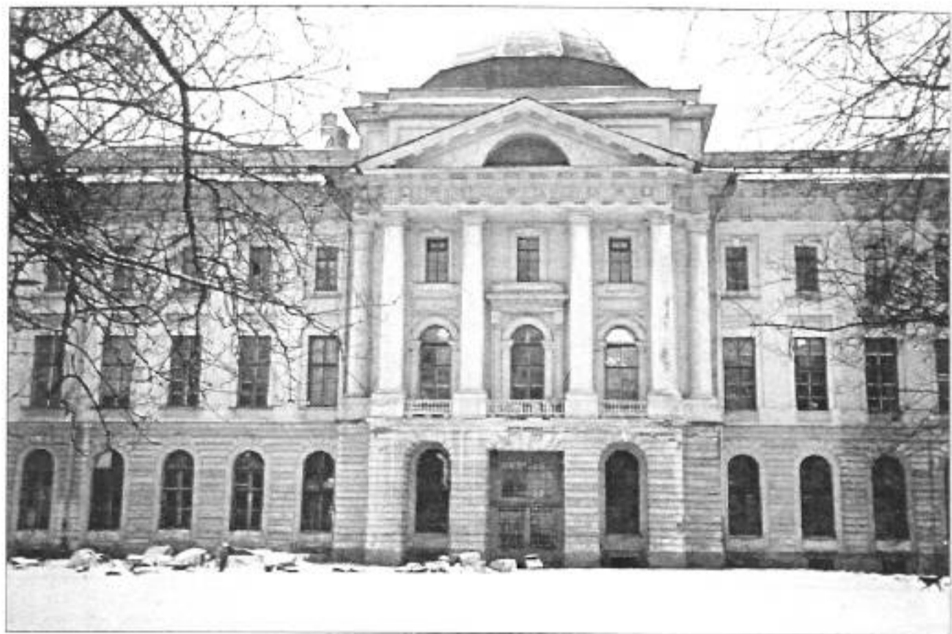
Вид церкви с академического сада. Фото 1998 г.