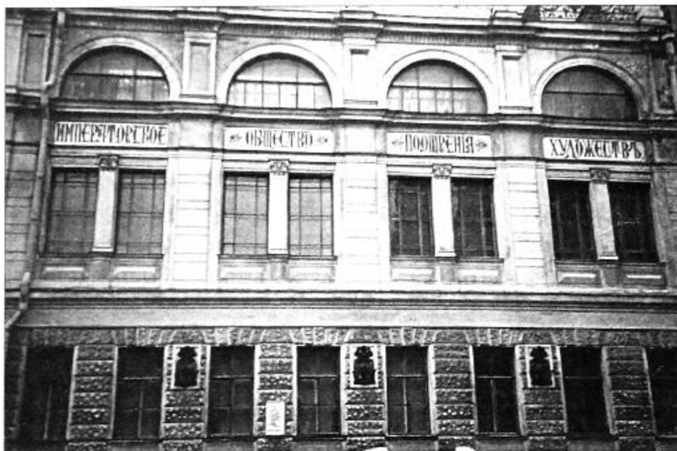
Большая Морская, 38. Фото 1998 г.