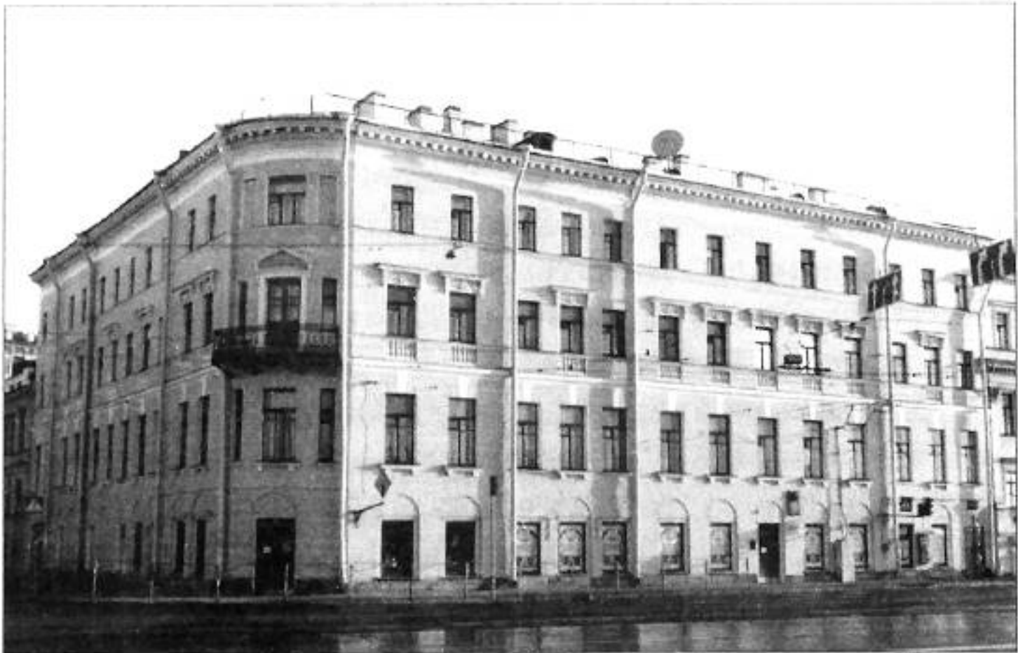
Университетская наб., 25. Фото 1997 г.