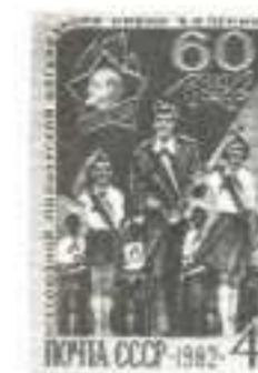
Рисунок Ю. Ряховского. П. глуб. на мелованной бумаге. Рам. 11 1/2.

5291. 4 к. — Торжественный марш пионерской дружины. Пионерский значок и юбилейная цифра, украшенная лавровой ветвью, на фоне красного знамени — многоцветная . . . . . -04 -02 Тираж 4,8.