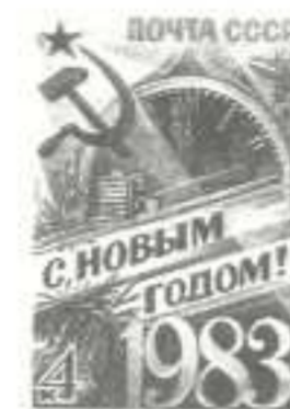
Рисунок С. Горлищева. Офсет на мелованной бумаге с лаковым покрытием. Грб. 12 : 12 1/2.

5354. 4 к. — Пятиконечная красная звезда и эмблема Советского государства Серп и Молот. Куранты Спасской башни Московского Кремля, показывающие полночь — время встречи Нового года, и ветка ели. Золотой луч от "Серпа и Молота", высвечивающий цифру "1983". Фон — индустриальная панорама — многоцветная . . . . . -04 -02