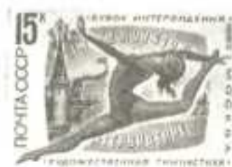
Рисунок Ю. Бронфенбрера. П. глуб. на мелованной бумаге. Рам. 11 1/2.

1982 г. Август, 10. XV турнир на кубок Интервидения по художественной гимнастике. Тбилиси (4 — 5.12).