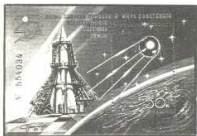
Рисунок летчика-космонавта СССР А. Леонова. Офсет на мелованной бумаге с лаковым покрытием. Марка в блоке — рам. 12 : 12 1/2.

5333. 50 к. — На марке — пролетающий в космосе над Землей первый советский ИСЗ (запущен 4.10.1957). На полях блока — ракета-носитель первого ИСЗ на стартовой установке и космическое пространство со спектральным свечением над поверхностью Земли. Памятный текст. Факсимиле А. А. Леонова. Шестизначный номер — многоцветный . . . . . -50 -15