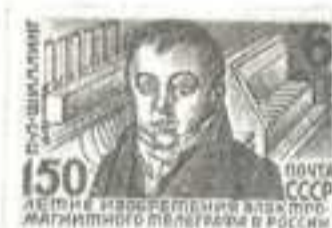
Рисунок А. Калашникова. Гравюра на металле И. Мокроусова. П. глуб. в сочетании с металлографией на мелованной бумаге. Рам. 11 1/2.

1982. Июль, 15. 150-летие изобретения электромагнитного телеграфа в России.