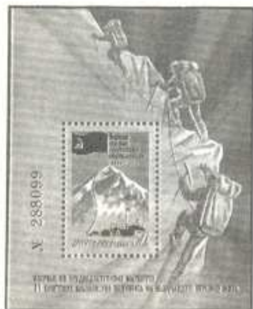
Рисунок Ю. Левиновского. П. Глуб. на мелованной бумаге. Марка – рам. 11 1/2 : 12. Размер блока – 6,5 x 8,5 см.

5356. 50 к. – На марке – схема маршрута альпинистов от базового лагеря к вершине (высота 8 848 м). Государственный флаг СССР. Надпись: "Эверест покорен советскими спортсменами".