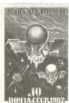
Рисунок Р. Стрельникова. П. глуб. на мелованной бумаге. Рам. 11 1/2.

5278. 10 к. – АМС в полете в космосе на фоне планет Земля и Венера – многоцветная . . . . . –10 –03