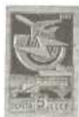
Рисунок Г. Комлева. Офсет на мелованной бумаге. Греб. 12 : 12 1/2.

5357. 5 к. – Эмблема почтовой связи и средства доставки корреспонденции и грузов воздушным, водным и наземным (железнодорожным и автомобильным) транспортом – зелено-голубая. . . . . –05 –02