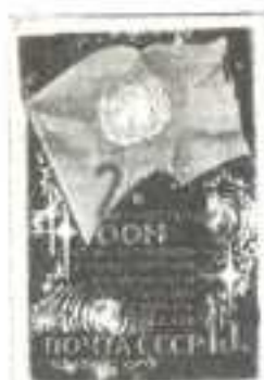
Рисунок И. Дергилева. П. глуб. на мелованной бумаге. Рам. 11 1/2.

5307. 15 к. – Флаг ООН на фоне межпланетного космического пространства и стилизованных орбит космических аппаратов. Памятный текст – многоцветная . . . . . –15 –03