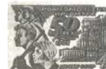
Рисунок Ю. Левиновского. Гравюра на металле Т. Никитиной. П. глуб. в сочетании с металлографией на мелованной бумаге. Рам. 11 1/2.

1982. Июнь, 20. 50-летие Комсомольска-на-Амуре.