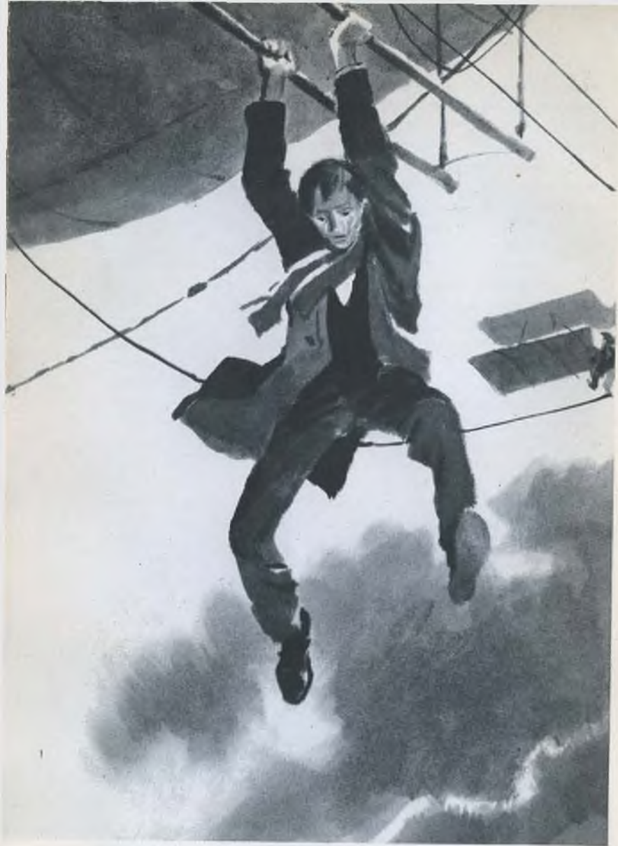
«ВОЙНА В ВОЗДУХЕ»