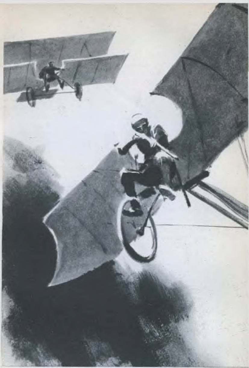
«ВОЙНА В ВОЗДУХЕ»