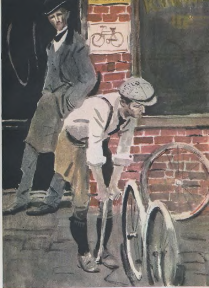
«ВОЙНА В ВОЗДУХЕ»