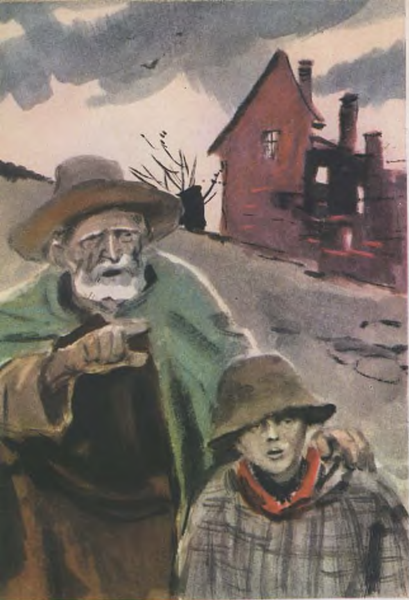
«ВОЙНА В ВОЗДУХЕ»