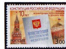
Рисунок Ю. Арцименева. Офсет на мелованной бумаге. Зубцовка гребенчатая 12 1/2 : 12. Размер марки 42 x 30 мм. Марка многоцветная .

2003. Октябрь, 15. 10-летие принятия Конституции 19 Российской Федерации.