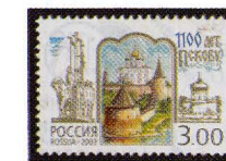
Рисунок А. Плетнева. Офсет на мелованной бумаге. Зубцовка гребенчатая 12 : 12 1/2. Размер марки 37 x 26 мм. Марка многоцветная . ©