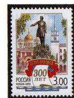
Рисунок А. Плетнева. Офсет на мелованной бумаге. Зубцовка гребенчатая 12 1/2 : 12. Размер марки 26 x 37 мм. Марка многоцветная . ©