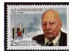
Рисунок Х. Бетрединовой. Офсет на мелованной бумаге. Зубцовка гребенчатая 12 1/2 : 12. Размер марки 42 x 30 мм. Марка многоцветная.