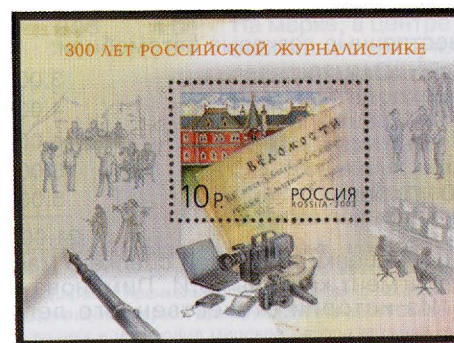
Рисунок Ю. Арцименева. Офсет на мелованной бумаге. Зубцовка рамочная 12 : 12 1/2. Размер блока 90 x 65 мм. Размер марки в блоке 40 x 28 мм. Блок многоцветный.