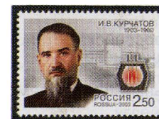
Рисунок Х. Бетрединовой. Офсет на мелованной бумаге. Зубцовка гребенчатая 12 1/2 : 12. Размер марки 42 x 30 мм. Марка многоцветная.