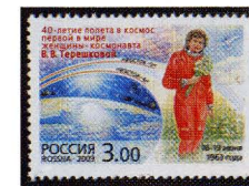
Рисунок А. Керносова. Офсет на мелованной бумаге. Зубцовка гребенчатая 12 1/2 : 12. Размер марки 42 x 30 мм. Марка многоцветная. ©

2003. Май, 20. 40-летие полета в космос первой в мире женщины-космонавта В.В. Терешковой.