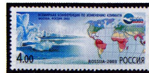
Рисунок А. Московца. Офсет на мелованной бумаге. Зубцовка гребенчатая 12 : 12 1/2. Размер марки 58 x 26 мм. Марка многоцветная .

2003. Август, 14. Всемирная конференция по изменению климата.