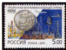
Рисунок Ю. Арцименева. Офсет на мелованной бумаге. Зубцовка гребенчатая 12 1/2 : 12. Размер марки 42 x 30 мм. Марка многоцветная .