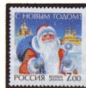
Рисунок М. Ларюшиной. Офсет на бархатистой, гуммированной бумаге. Зубцовка гребенчатая 13. Размер марки 31,75 x 31,75 мм. Марка многоцветная .