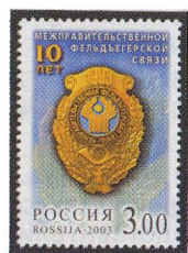
Рисунок А. Батова. Офсет на мелованной бумаге. Зубцовка гребенчатая 12 : 12 1/2. Размер марки 30 x 42 мм. Марка многоцветная .

2003. Январь, 16. 10 лет Межправительственной фельдъегерской связи 4 .