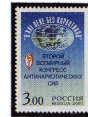
Рисунок И. Тыртычного. Офсет на мелованной бумаге. Зубцовка гребенчатая 12 : 12 1/2. Размер марки 30 x 42 мм. Марка многоцветная .