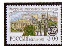
Рисунок А. Плетнева. Офсет на мелованной бумаге. Зубцовка гребенчатая 12 : 12 1/2. Размер марки 37 x 26 мм. Марка многоцветная .

2003. Апрель, 15. 100-летие присвоения Новосибирску статуса города.