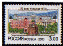
Рисунок А. Плетнева. Офсет на мелованной бумаге. Зубцовка гребенчатая 12 : 12 1/2. Размер марки 37 x 26 мм. Марка многоцветная .

2003. Август, 14. 350-летие основания Читы.