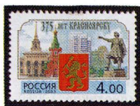
Рисунок А. Плетнева. Офсет на мелованной бумаге. Зубцовка гребенчатая 12 : 12 1/2. Размер марки 37 x 26 мм. Марка многоцветная .