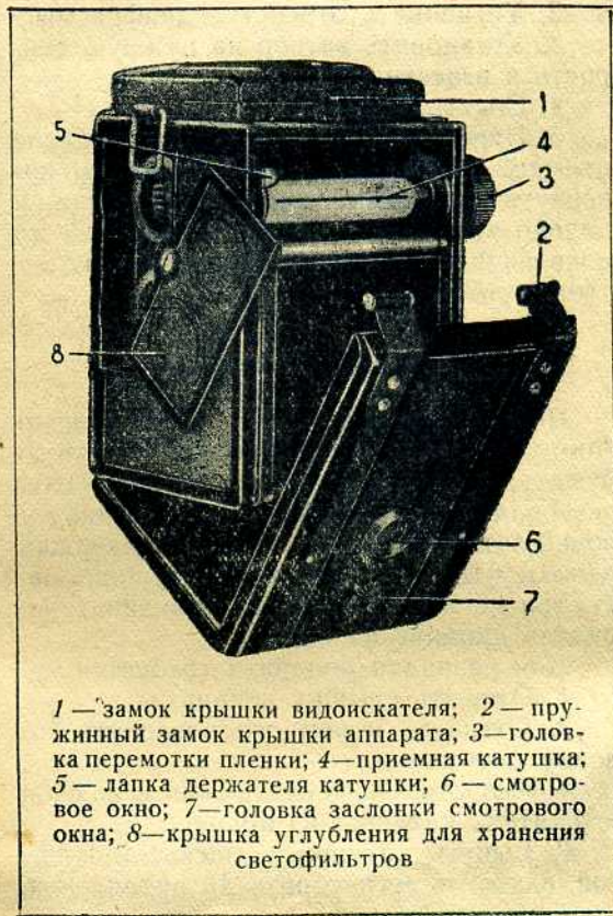
1 — замок крышки видоискателя; 2 — пружинный замок крышки аппарата; 3 — головка перемотки пленки; 4 — приемная катушка; 5 — лапка держателя катушки; 6 — смотровое окно; 7 — головка заслонки смотрового окна; 8 — крышка углубления для хранения светофильтров

1. Установить объектив на фокус по резкости изображения на матовом кружке или по шкале расстояний.