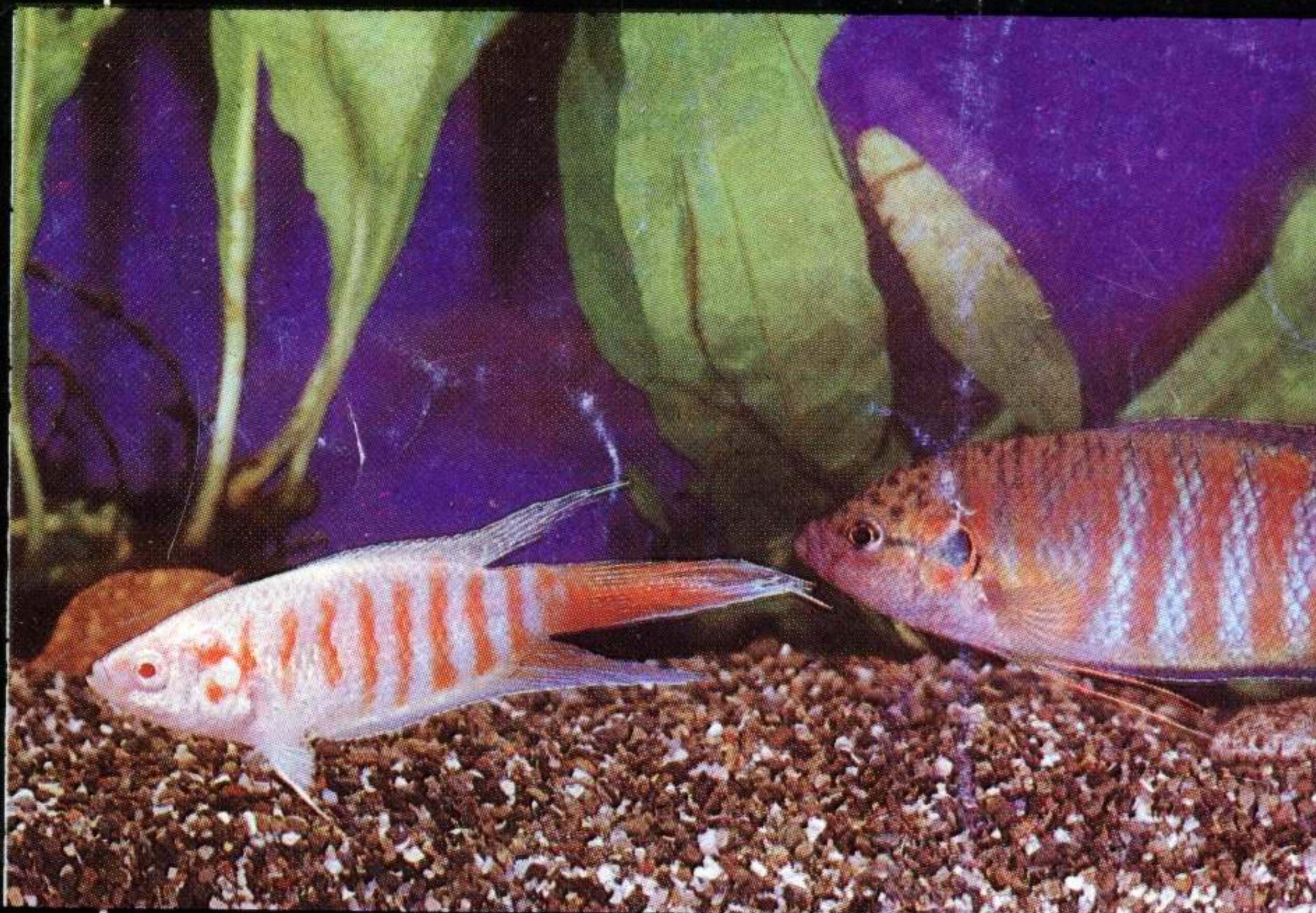
▲ Макропод Гурами мраморный ▶

МП «Фотопринт» намерено и в дальнейшем готовить к выпуску издания для любителей аквариумных рыб. Мы расскажем вам, как разводить и содержать аквариумных питомцев, поведаем родословные различных видов рыб, поможем правильно подобрать режим их питания. Следите за нашими изданиями.