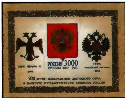
Рисунок М. Слонова. Офсет на мелованной бумаге. Зубцовка рамочная 12 1/2 : 12. Размер блока 9,5 x 7,5 см.

1997. Март, 20. 500-летие изображения двуглавого орла в качестве государственного символа России. Почтовый блок.