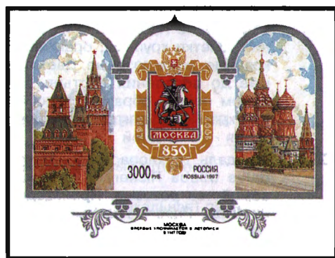
Рисунок А. Плетнева. Офсет на мелованной бумаге. Зубцовка рамочная 12 : 12 1/2. © Размер блока 9 x 7 см.

1997. Февраль, 20. 850 лет Москве. Почтовый блок.